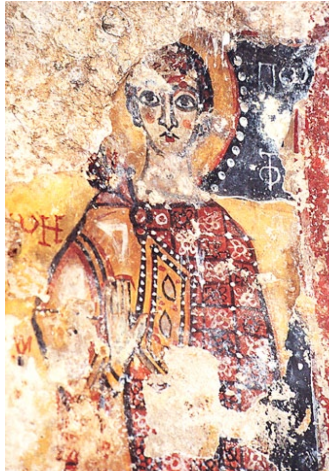
11. Zidni oslik s prikazom nepoznatog svetca, istočni zid, kriptna, Gravina di Riggio, Grottaglie, Apulija

St Michael's church in Ston, mural painting depicting an anonymous saint, southern niche in the eastern wall