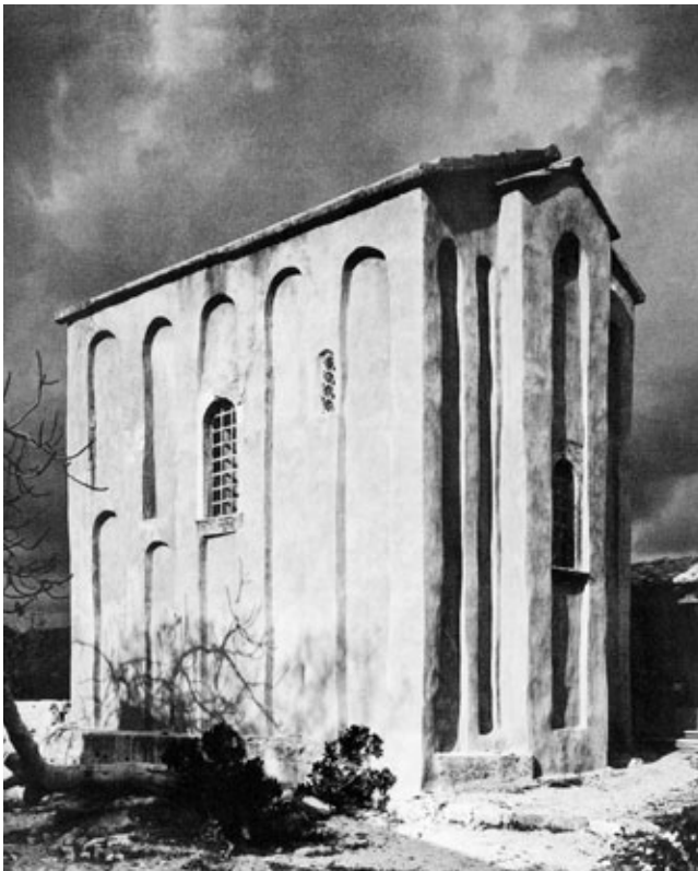
2. Crkva Sv. Mihajla, Ston, jugoistočna strana

Uzdužne stijenke bočnih zidova crkve podijeljene su u tri veličinom izjednačena polja s pomoću dviju lezeta tzv. T presjeka, a na vrhu ih povezuju polukružni lukovi. Sred svakog zidnog polja nalazi se po jedna vitka niša, polukružnoga presjeka, a niše su izvedene i s obje strane apside. Gornji dijelovi konstrukcije (pojasnice, svod i polukalota apside) obnovljeni su početkom prošlog stoljeća. U svodovima su uzidane amfore, kao i kod predromaničkih i ranoromaničkih zdanja toga tipa na Elafitskom otočju. Nad svodom istočnog i zapadnog traveja primjetna su tanka rebra od žbuke trokutastoga presjeka, koja se u tjemenu dijagonalno križaju. Iako se krajem 19. stoljeća urušio središnji dio gornje konstrukcije, nedavnim je istraživanjem izgleda utvrđena tzv. lažna trobrodnost krovišta. 33 Na temelju tlocrtnih dispozicija možemo pretpostaviti da je crkva imala kupolu. 34