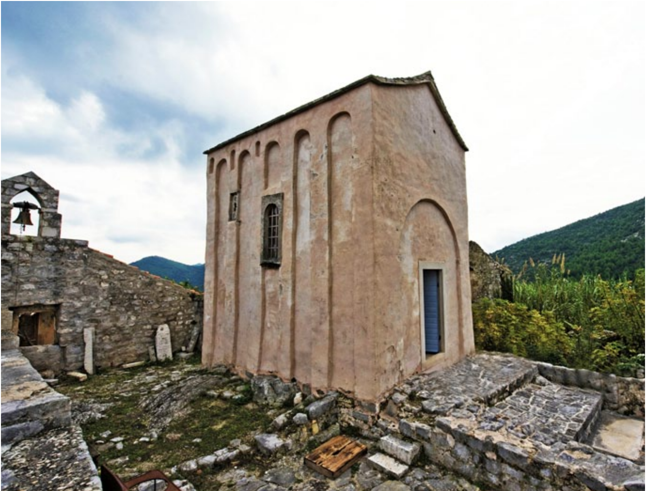
1. Crkva Sv. Mihajla, Ston, sjeverozapadna strana St Michael's church in Ston, north-western side

Tom prilikom zazidan je prolaz na njezinom sjevernom zidu i ponovno su otvorena vrata na začelju veće crkve, a u cijelosti je obnovljena i njezina gornja konstrukcija. 16 Također, namjera je bila da se rekonstruiraju prozorski otvori na južnom zidu i apsidi jer su u njih bili uzidani ulomci kamene plastike. 17 No, iz kasnijih fotografija, zamjetno je da je rekonstruiran samo apsidalni otvor, dok je onaj južni ostao zazidan. 18 U crkvenoj unutrašnjosti obnovljeni su ranoromanički zidni oslici, a vršena su istraživanja i u podnici. 19 Godine 1938. spomenik je istraživao danski arhitekt Ejnar Dygge, koji je tada u unutrašnjosti pronašao ostatke nadsvedene grobnice. 20