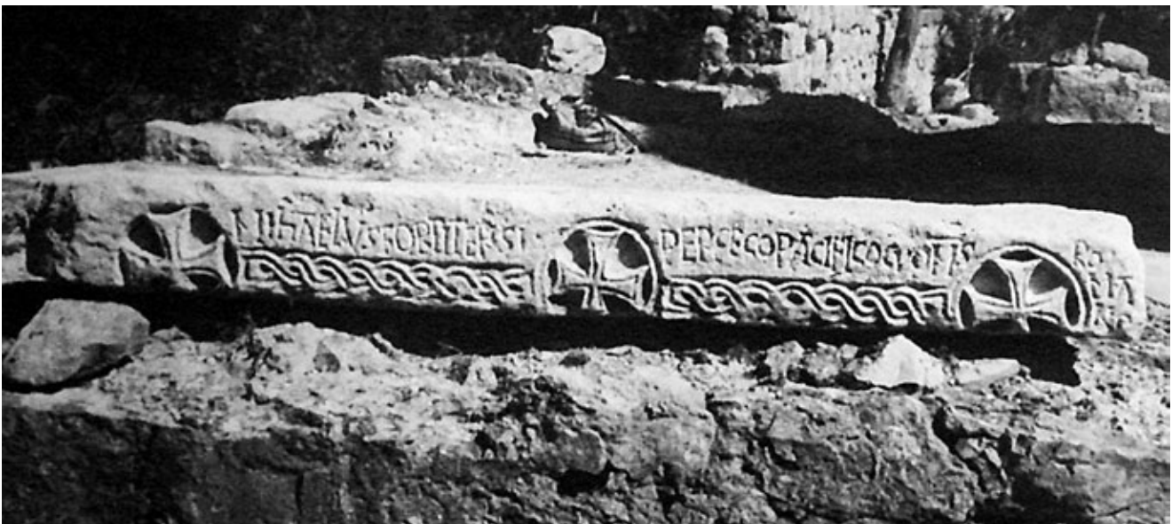
6. Nadvratnik s natpisom MIHAELUS Lintel bearing the inscription MIHAELUS

Treći nadvratnik bio je ugrađen u zid samostanskog dvorišta kod Sv. Mihajla, a 1928. godine pogrešno je rekonstruiran kao nadprozornik apsidalnog otvora. 61 Na prednjoj strani isklesana je ista kompozicija s tri križa i dvoprutom „pletenicom“, kao i na potonjem. Uzimajući u obzir da je srodna kompozicija s tri križa izvedena i na