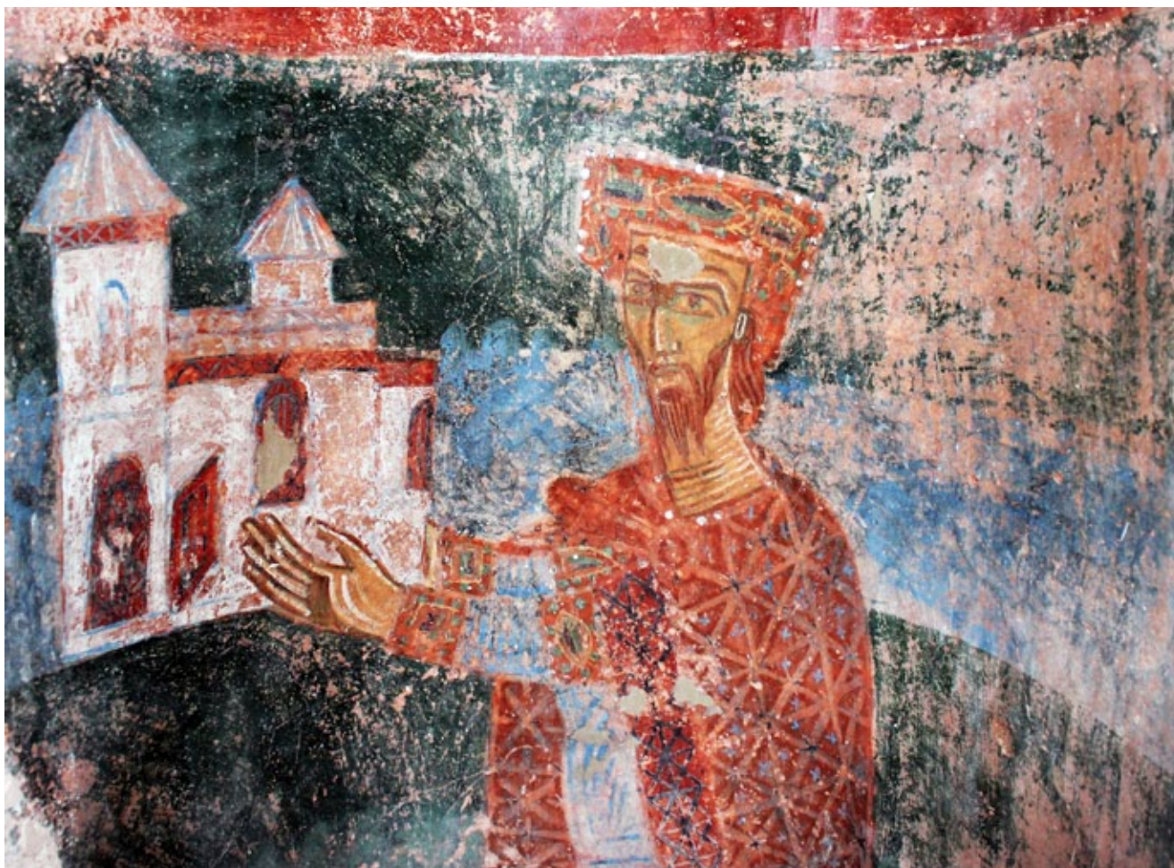
9. Crkva Sv. Mihajla, Ston, zidni oslik s prikazom vladara (Stefan Vojslav), zapadni travej, sjeverna strana St Michael's church in Ston, mural depicting a ruler (Stefan Vojslav), northern side of the western bay

smatram da su freske nešto ranijeg vremena postanka od onoga kako se dosad mislilo. Na to upućuje njihova naglašena sklonost linearizmu i grafizmu, napose prisutna u prikazu ljudskoga lika koji je posve apstrahiran i oblici su stilizirani u krute, gotovo geometrijske forme, pa im tjelesa djeluju kao apstraktne dekorativne vrijednosti. Najbliže paralele na istočnoj obali Jadrana zamjetne su sa zidnim slikama u Sv. Agati kod Kanfanara iz prve polovine 11. stoljeća, što su već opravdano primijetili Lj. Karaman i C. Fisković. 76 Formalna sličnost između stonskih i istarskih oslika uočljiva je u prikazu svetica, njihovom tipiziranom licu i frontalnom stavu, a napose u dekorativnoj im odjeći geometrijskog uzorka, s ujednačenim i paralelnim vertikalnim naborima. 77 U novije vrijeme o zidnim oslicima u Sv. Agati pisala je Nikolina Maraković, koja donosi iscrpnu analizu tih fresaka i dovodi ih u vezu s bliskim primjerima otonskog i postotonskog knjižnog i zidnog slikarstva. 78 U tom pogledu zanimljivo je njezino zapažanje o dekorativnom motivu kojim je urešena