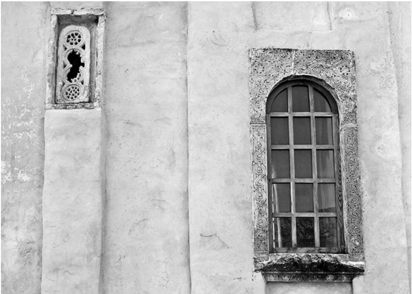
5. Crkva Sv. Mihajla, Ston, tranzena i prozorski okvir, sjeverna strana St Michael's church in Ston, transenna and the window frame, northern side

između obruba i vitica nalaze se stilizirani dvolisti. Na nadvratniku izvedena je slična vitica, s četiri tropruta kruga i stiliziranom ptičjom glavom. 44 Na temelju dužine nadvratnika (80 cm) i širine dovratnika (14.5 cm), moguće je zaključiti da su najvjerojatnije pripadali portalu Sv. Mihajla jer im dimenzije odgovaraju uobičajenoj širini crkvenog ulaza (oko 50 cm) kod spomenika tzv. južnodalmatinskog jednobrodnog kupolnog tipa . 45