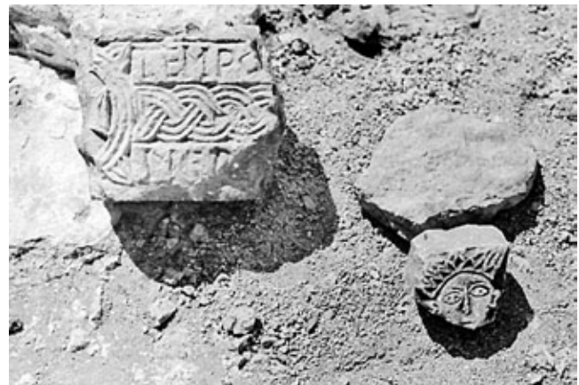
8. Ulomak nadvratnika s natpisom TEMPO(RE) i ulomak s prikazom ljudskog lica Fragment of a lintel with the inscription TEMPO(RE) and a fragment with human face

Mlađem sloju skulpture možemo pripisati tri prozorska okvira – dva na bočnim zidovima i jedan na apsidi. Većih su dimenzija (143 cm x 73 cm), a njihov dekorativni okvir rekonstruiran je šezdesetih godina 20. stoljeća. 64 Sva tri okvira pravokutnog su oblika i isklesana su