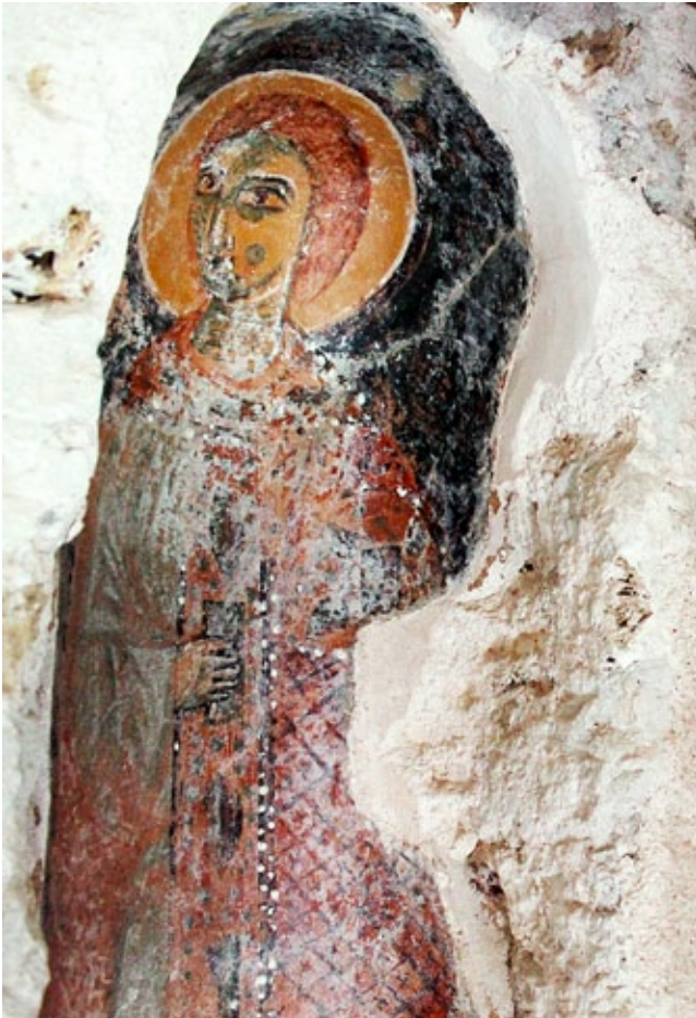
10. Crkva Sv. Mihajla, Ston, zidni oslik s prikazom nepoznatog svetca, istočni zid, južna niša

St Michael's church in Ston, mural painting depicting an anonymous saint, southern niche in the eastern wall