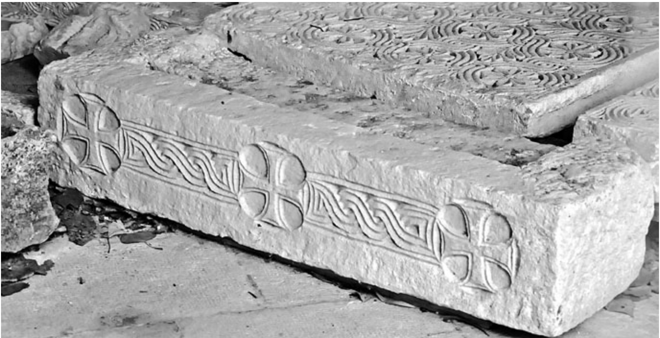
7. Nadvratnik s tri križa pronađen kod Gospe od Lužina, Ston Lintel with three crosses, found at Our Lady of Lužine, Ston