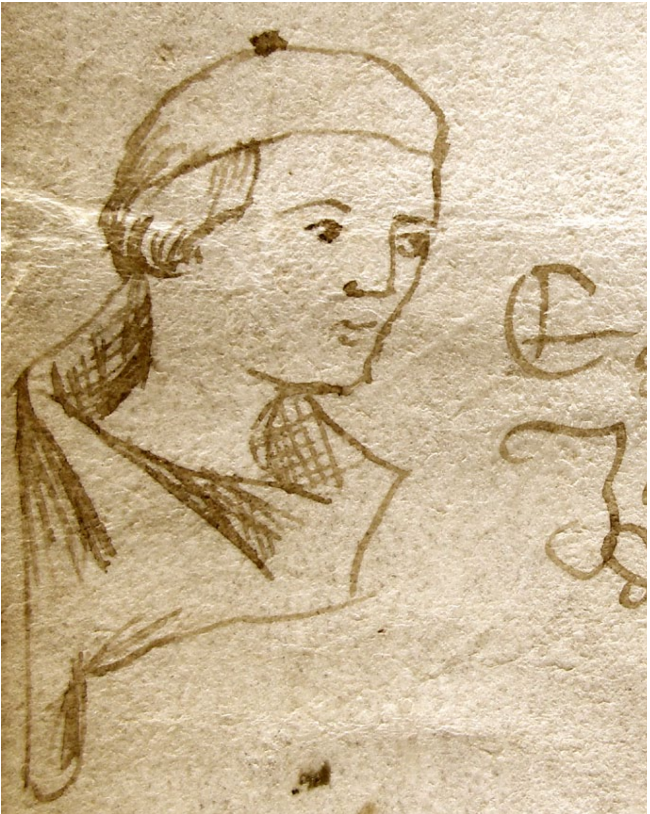
2. Svećenik Ilija, Notarski znak – autoportret (4. ožujka 1361., ASSM, Mapa 4, perg. br. 227. – kat. br. 1) Priest Helias's notarial sign – self-portrait (March 4, 1361, ASSM, folder 4, parch. nr. 227 – cat. nr. 1)