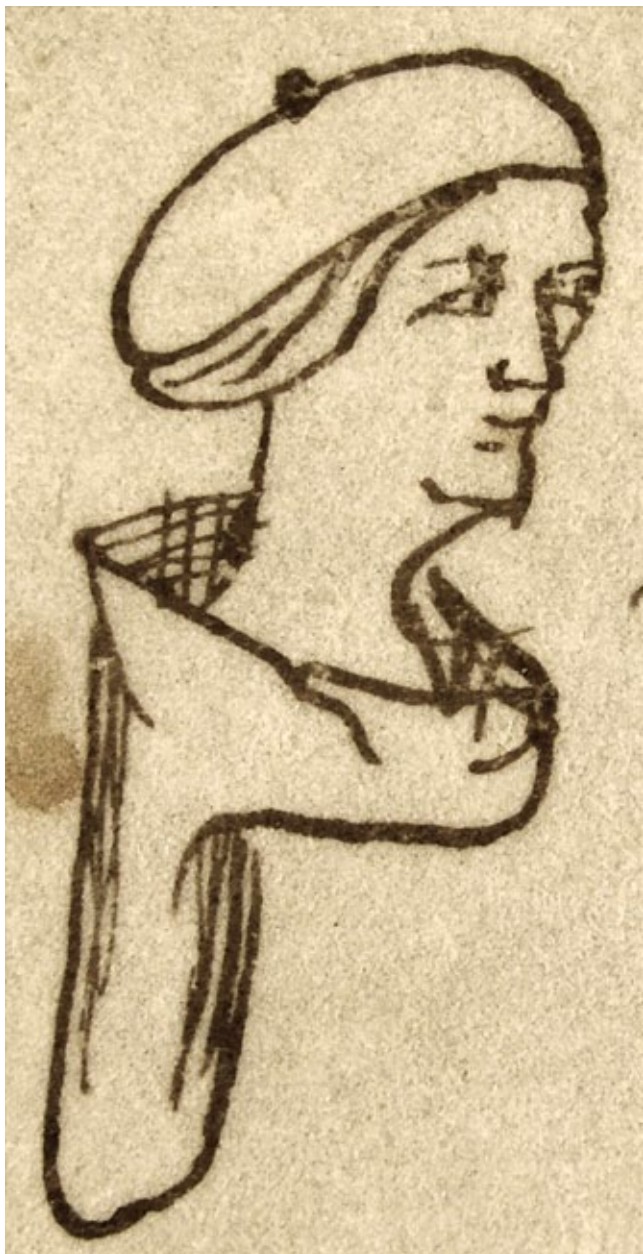
9. Svećenik Ilija, Notarski znak – autoportret (25. travnja 1373., HR-DAZD, Benediktinski samostan Sv. Krševana u Zadru (918. – 1806.), Pergamene, br. 258. – kat. br. 40)

Priest Helias's notarial sign – self-portrait (April 25, 1373, HR-DAZD, Benedictine monastery of St Chrysogonus in Zadar (918-1806), parch. nr. 258 – cat. nr. 40)