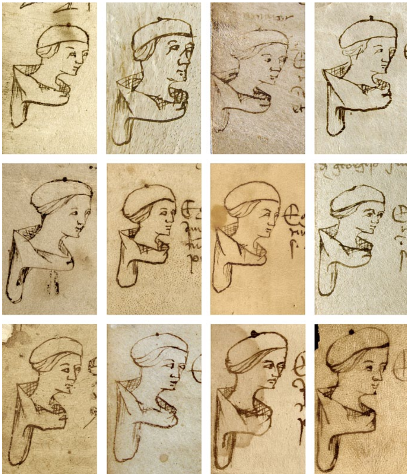
16. Svećenik Ilija, Notarski znakovi – autoportreti, kat. br. 25 do 36 (omjer 1,5 : 1) Priest Helias's notarial signs – self-portraits, cat. nr. 25-36 (ratio 1.5:1)