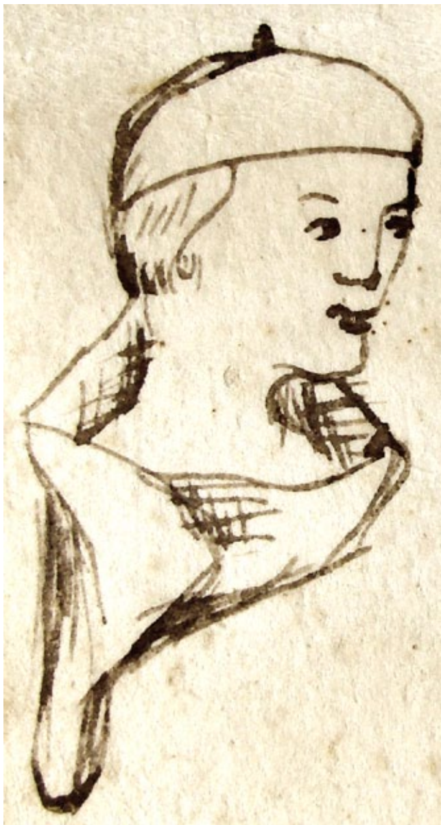
3. Svećenik Ilija, Notarski znak – autoportret (3. studenog 1365., ASSM, Mapa 4, perg. br. 240. – kat. br. 5) Priest Helias's notarial sign – self-portrait (November 3, 1365, ASSM, folder 4, parch. nr. 240 – cat. nr. 5)

možda nije i jedina preokupacija, to jest kojem nisu sasvim strani elementi svjetovnog života. Ilija, kao splitski kanonik, koji u Zadru vjerojatno nije imao previše dužnosti vezanih uz svoj svećenički poziv, 22 a zacijelo se mogao barem dijelom održavati svojom bilježničkom djelatnošću, 23 čini se sasvim pogodnim kandidatom za tako predočen lik mladog svećenika nešto slobodnijeg stila života. Stoga smatram da se može zaključiti da, barem na razini prvobitnog predloška i zamisli, svi navedeni crteži predstavljaju Ilijin autoportret. 24