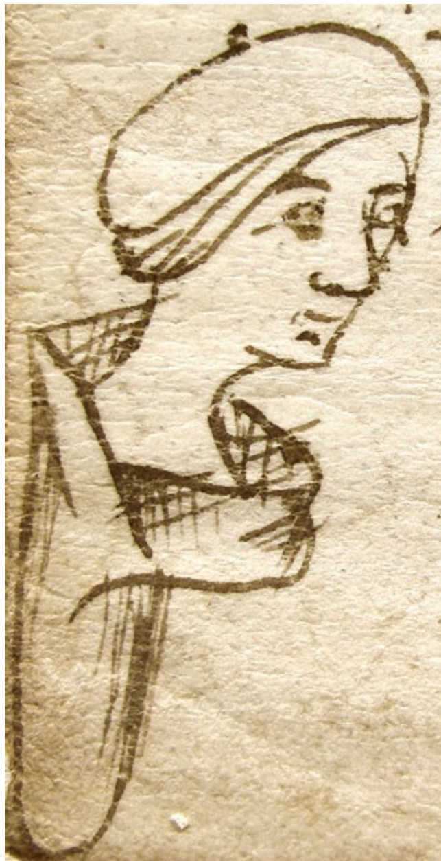
10. Svećenik Ilija, Notarski znak – autoportret (3. siječnja 1375., ASSM, Mapa 4, perg. br. 282. – kat. br. 45)

rima nije moguće pronaći dva identična, što ukazuje na to da je Ilija vjerojatno svjesno varirao prikazani lik. 25 Pritom treba imati na umu da je dio razlika među pojedinim crtežima između ostalog uvjetovan i objektivnim čimbenicima, kao što su kvaliteta pergamene (osobito u smislu hrapavosti površine), naoštrenost pera i koncentrat tinte. Također su i oštećenja koje su pojedine per-