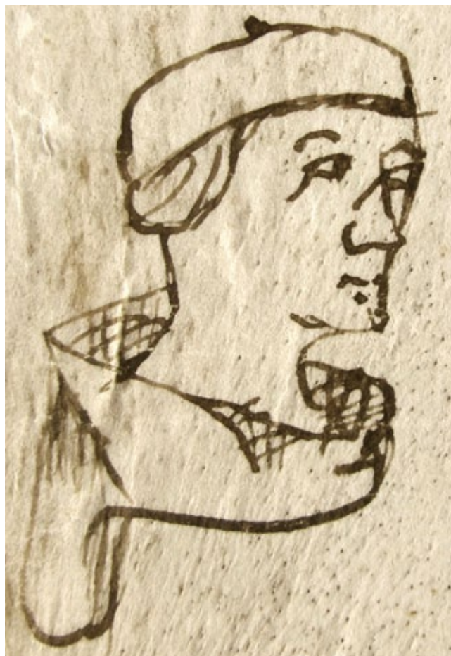
6. Svećenik Ilija, Notarski znak – autoportret (30. ožujka 1370., ASSM, Mapa 4, perg. br. 270. – kat. br. 26)

Priest Helias's notarial sign – self-portrait (November 23, 1368, HR-DAZD, Benedictine monastery of St Cosmas and Damian at Čokovac (1059-1806), parch. nr. 87 – cat. nr. 23)