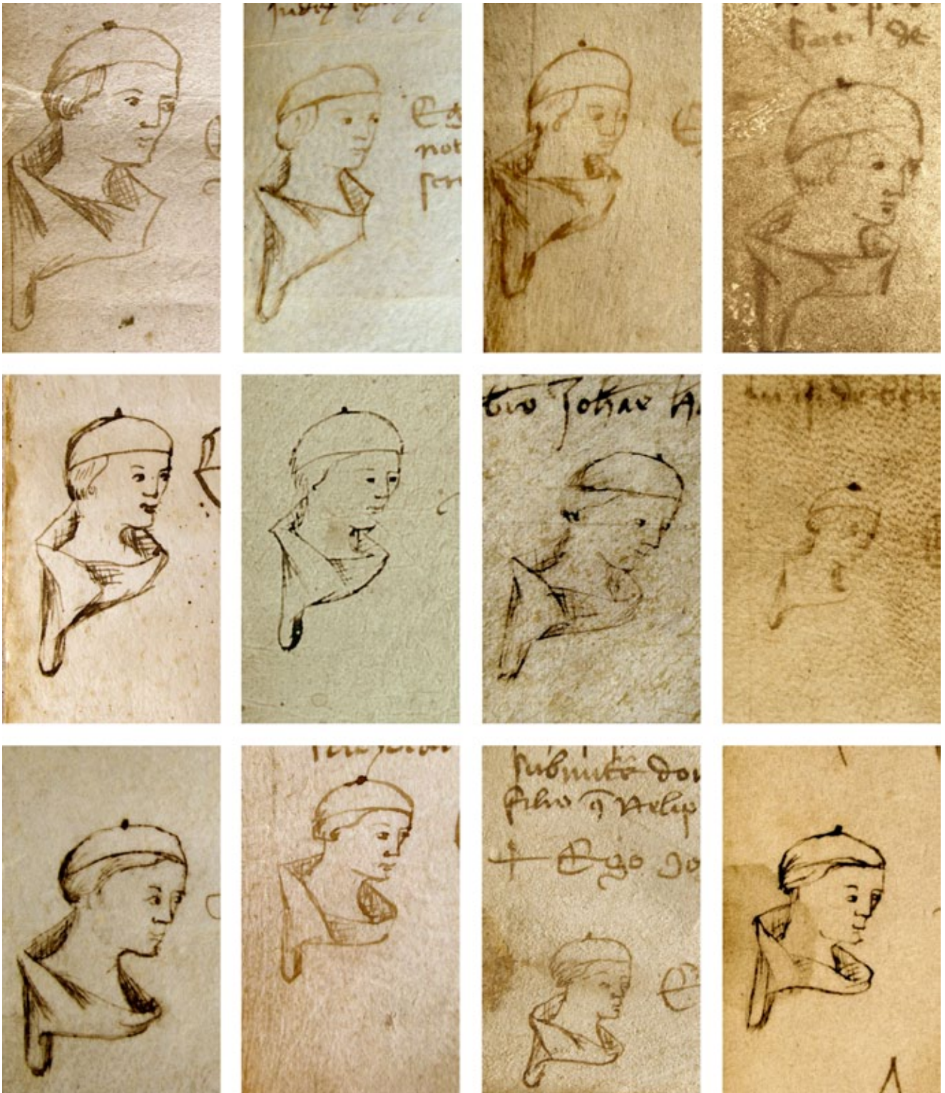
14. Svećenik Ilija, Notarski znakovi – autoportreti, kat. br. 1 do 12 (omjer 1,5 : 1) Priest Helias's notarial signs – self-portraits, cat. nr. 1-12 (ratio 1.5:1)