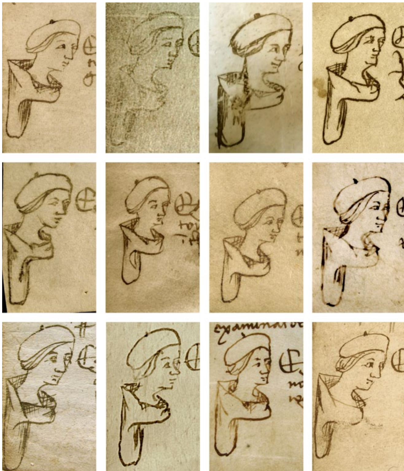
17. Svećenik Ilija, Notarski znakovi – autoportreti, kat. br. 37 do 48 (omjer 1,5 : 1) Priest Helias's notarial signs – self-portraits, cat. nr. 37-48 (ratio 1.5:1)