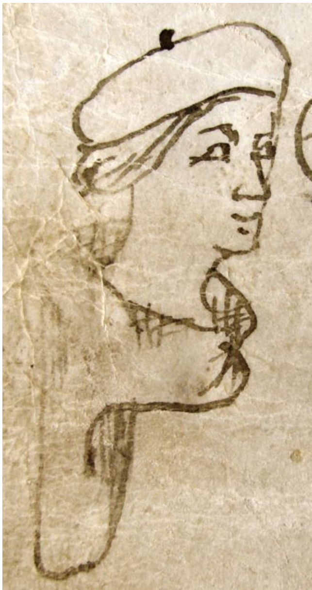
12. Svećenik Ilija, Notarski znak – autoportret (6. travnja 1377., ASSM, Mapa 4, perg. br. 285. – kat. br. 49) Priest Helias's notarial sign – self-portrait (April 6, 1377, ASSM, folder 4, parch. nr. 285 – cat. nr. 49)