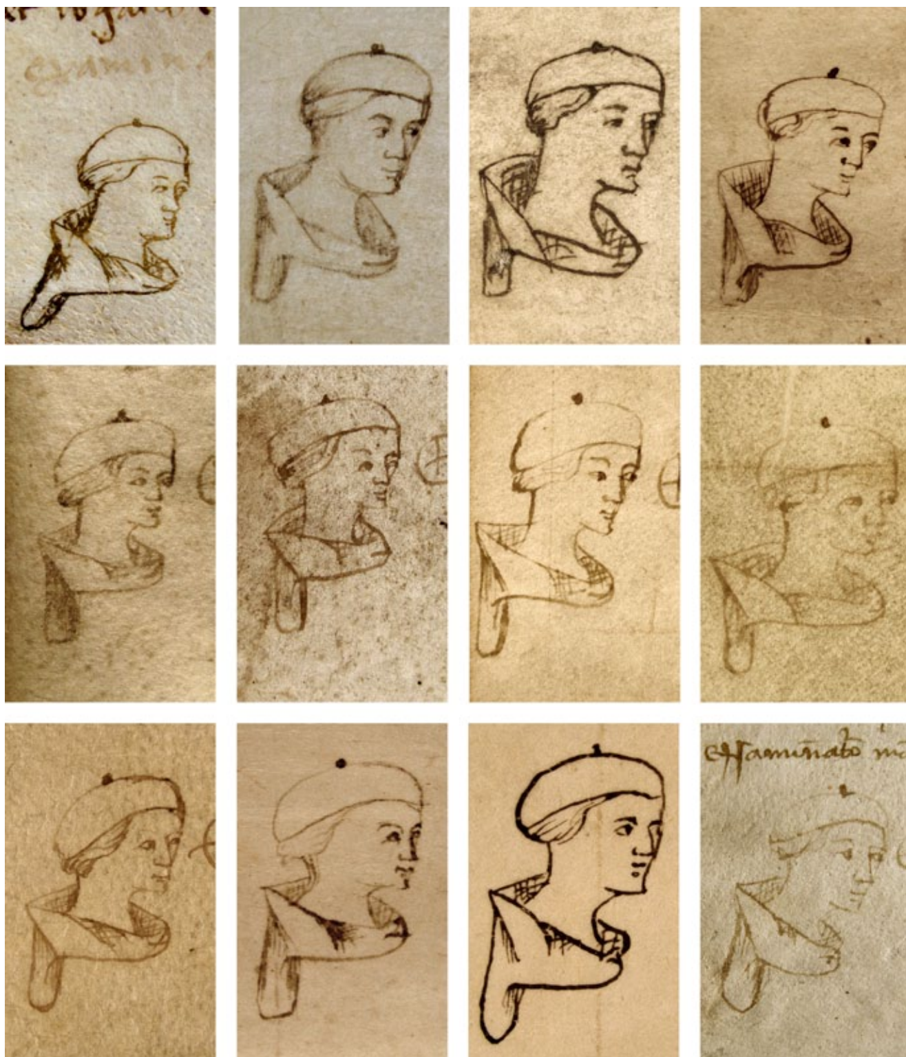
15. Svećenik Ilija, Notarski znakovi – autoportreti, kat. br. 13 do 24 (omjer 1,5 : 1) Priest Helias's notarial signs – self-portraits, cat. nr. 13-24 (ratio 1.5:1)