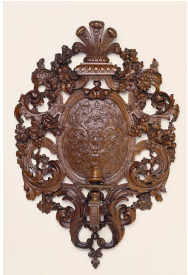
7. Zidni svijećnjak, oko 1700. godine, The J. Paul Getty Museum, Los Angeles

Ova tipologija zidnih svijećnjaka vjerojatno ima izvor u oblikovanju zidnih škropionica, samo što je na krajevima držača, umjesto postolja za svijeću, bila postavljena posuda sa svetom vodom. 37 Takve su se škropionice počele izrađivati tijekom 17. stoljeća za privatne potrebe plemićkih obitelji kao dio opreme njihovih kućnih kapela ili oratorija. U središtu se škropionica najčešće nalazio prikaz Bogorodice s Djetetom ili nekog drugog sveca, ovisno o izboru naručitelja, a njihov je okvir oponašao male kućne oltare. S obzirom na vrstu materijala, zidne škropionice najčešće su se izrađivale od metala te bogato ukrašavale pozlatom ili dragim kamenjem. Istovremeno se razvijala i tipologija zidnih svijećnjaka koji u svom središnjem dijelu imaju ogledala radi bolje refleksije svijetlosti. Takvi su svijećnjaci primjerice prikazani na jednoj tapiseriji iz kolekcije francuskog kralja Louisa XIV. koja prikazuje Audijenciju Kardinala Chigija nastalu između 1667. i 1672. godine u radionici Jeana Lefebvrea