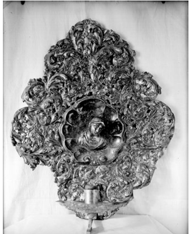
4. Zidni svijećnjak, Franjevački samostan na Trsatu Wall candelabrum, Franciscan monastery in Trsat

njevac Paškal Cvekan koji ih je naveo kao samostansku dragocjenost u povijesnom pregledu trsatskog svetišta objavljenom 1985. godine. 20 Iako su se svijećnjaci dosada usputno spominjali, o njima nije napisana stručna studija niti se iščitala stvarna kvaliteta ovog vrlo vrijednog umjetničkog djela. O tome svjedoči i činjenica da nisu bili uvršteni u riznicu 1992. godine, već su pomalo zaboravljeni bili odloženi u samostanskom spremištu.