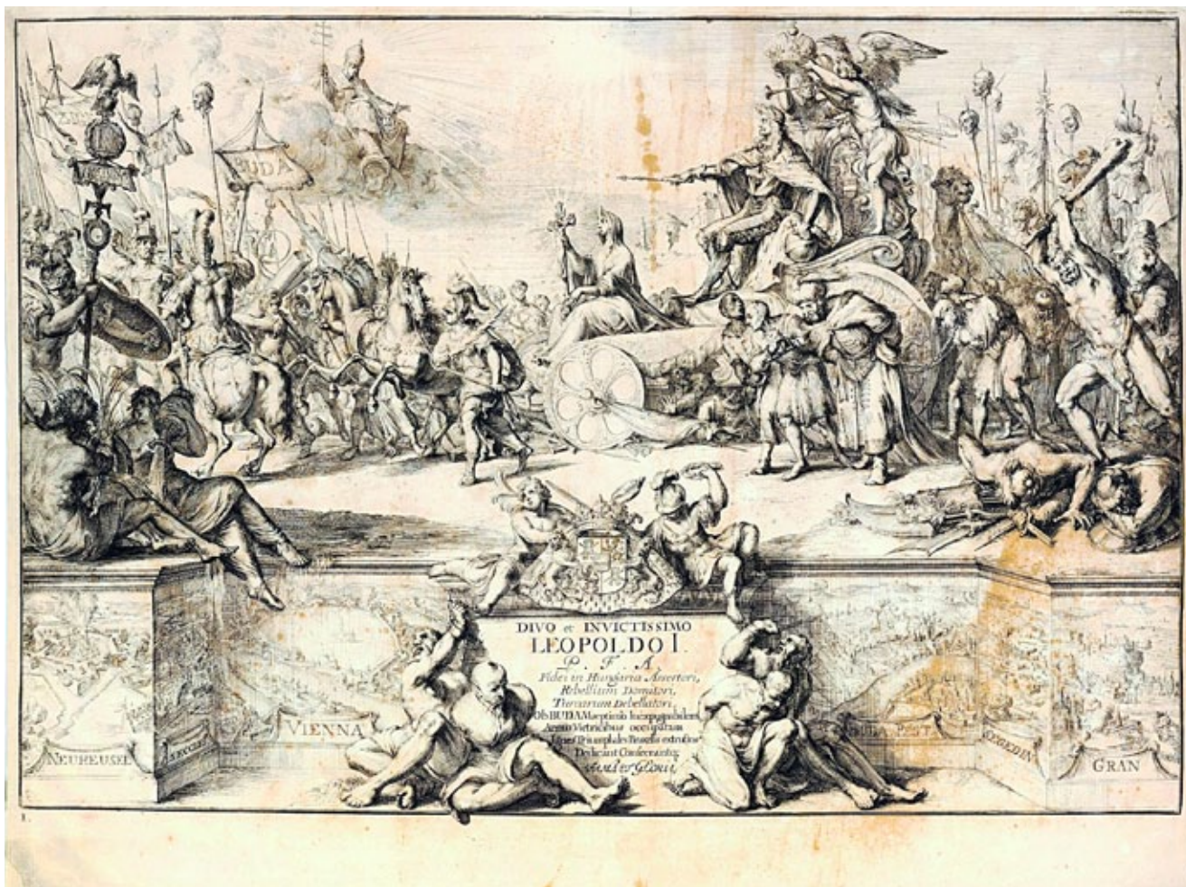
5. Romeyn de Hooghe, Algorija trijumfalne procesije cara Leopolda I. u Bruxellesu, nakon carskih i savezničkih pobjeda na Turcima , o. 1686. godine

Značaj ovog carskog darivanja trsatskom samostanu očituje se i u podržavanju tradicije koju je započeo Leopoldov prethodnik Karlo V. (1519. – 1556.). On je trsatskim franjevcima poklonio vrijedan zlatni privjesak u obliku dvoglavog orla ukrašen dragim kamenjem. Osim toga, štovanje Blažene Djevice Marije bilo je jedno od glavnih elemenata Pietas Austriaca koju su započeli članovi obitelji Habsburg tijekom prve polovice 17. stoljeća. Kako je car Leopold I., kao drugorođeni sin bio predodređen da postane svećenik, svoju je pobožnost tim više isticao. 31 Štoviše, sebe je nazivao „najnižim i najmanje dostojnim slugom Blažene Djevice Marije” koja mu je