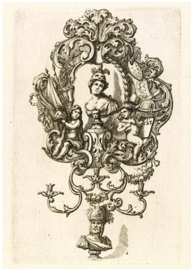
12. Jakob Wilhelm Heckenauer, Grafika iz Romanisches Laubwerk Dritter Theil bestehend in unterschiedlichen Cron- und Wand-leüchtern , početak 18. stoljeća, Augsburg, Victoria & Albert Museum, London Jakob Wilhelm Heckenauer, etching from Romanisches Laubwerk Dritter Theil bestehend in unterschiedlichen Cron- und Wand-leüchtern, early 18 th century, Augsburg, Victoria & Albert Museum, London

poldova vremena. Tako je augsburški zlatar Johann Betz (dokumentiran 1659. – 1697.) 43 na jednom paru zidnih svijećnjaka kao rimske carske ličnosti prikazao ruskog cara Petra I. Velikog i njegovu prvu ženu Eudoksiju. 44 Njihova su poprsja smještena u središta dvaju srebrnih svijećnjaka koji tipologijom odgovaraju onima na Trsatu. Izlivena poprsja flankiraju dva putta s trubama koja drže nabranu zavjesu što tvori površinu svijećnjaka. Iznad njih je carski orao raširenih krila kojega okružuju listovi palme i lovora dok se u donjem dijelu nalaze vojnički simboli. Ovi svijećnjaci, za razliku od trsatskih primjera, imaju držak za dvije svijeće koji se sastoje od uskog postolja i dekorativnog kružnog podloška što zadržava topljeni vosak.