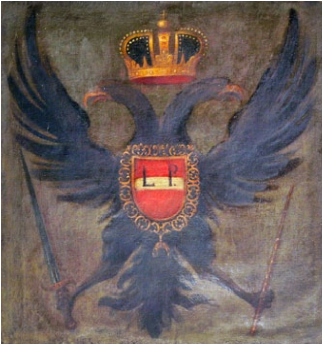
6. Slika s grbom cara Leopolda I., Refektorij Franjevačkog samostana na Trsatu, (izvor: Fototeka Konzervatorskog odjela u Rijeci, foto: D. Krizmanić)

Painting with the coat-of-arms of Emperor Leopold I, Refectory of the Franciscan monastery in Trsat