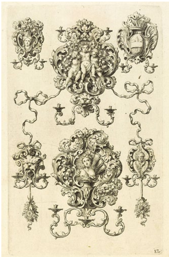
13. Leonhard Heckenauer, Grafika iz Neues sehr dienliches Goldschmidts Buch darinen unterschiedliche Arten von 'Geridon' auch Cron- und Wand-Leuchter , kraj 17. ili početak 18. stoljeća, Augsburg, Victoria & Albert Museum, London

Leonhard Heckenauer, etching from Neues sehr dienliches Goldschmidts Buch darinen unterschiedliche Arten von 'Geridon' auch Cron- und Wand-Leuchter, late 17 th or early 18 th century, Augsburg, Victoria & Albert Museum, London