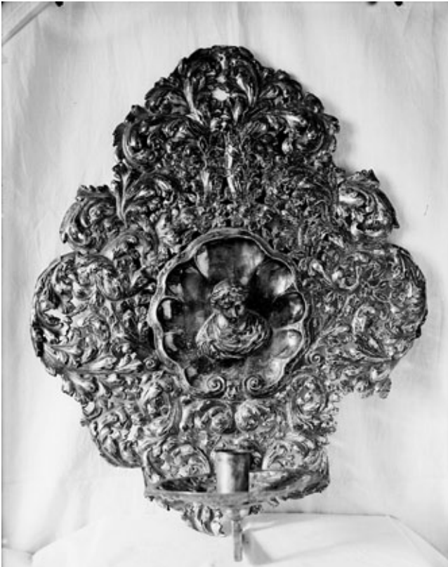
3. Zidni svijećnjak, Franjevački samostan na Trsatu, (izvor: Hrvatska akademija znanosti i umjetnosti, Zagreb, foto: Đ. Griesbach) Wall candelabrum, Franciscan monastery in Trsat