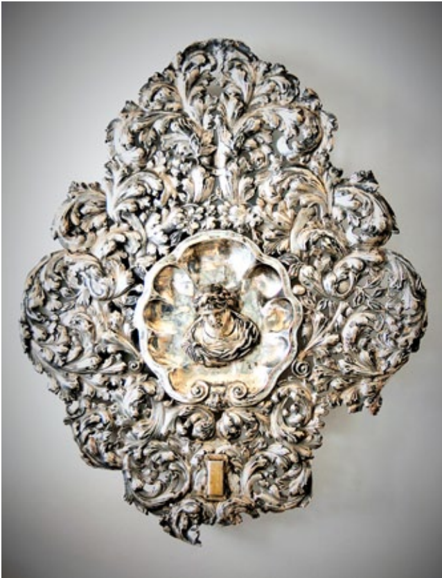
1. Zidni svijećnjak, Franjevački samostan na Trsatu Wall candelabrum, Franciscan monastery in Trsat