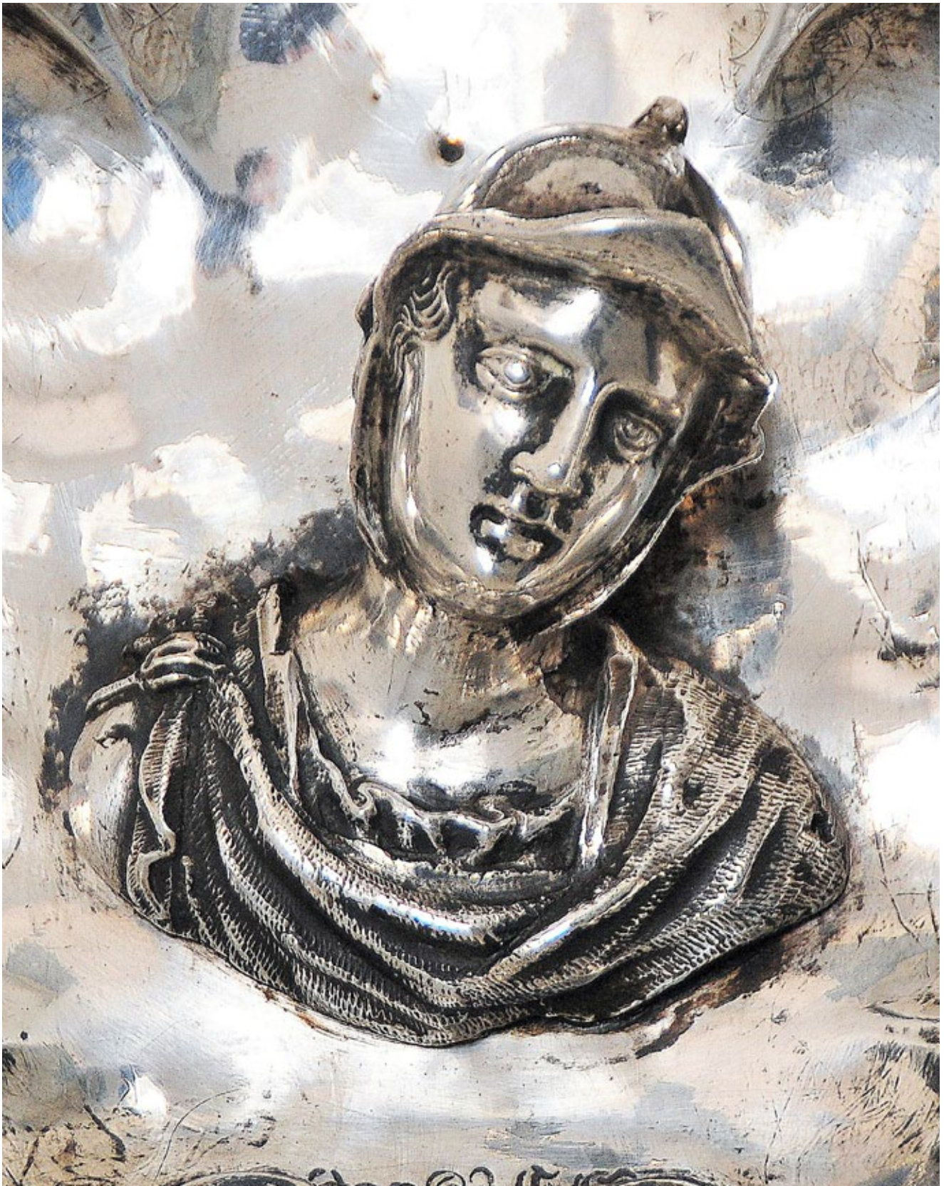
9. Zidni svijećnjak, detalj s prikazom mladog ratnika, Franjevački samostan na Trsatu Wall candelabrum, detail representing a young warrior, Franciscan monastery in Trsat