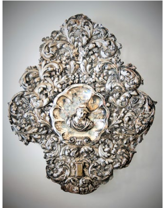
2. Zidni svijećnjak, Franjevački samostan na Trsatu Wall candelabrum, Franciscan monastery in Trsat

zili postavljeni na mramorne stupove glavnog oltara te da se figure smatraju personificiranim prikazima cara i njegovog sina. Već početkom 20. stoljeća, svijećnjaci su izmješteni iz svetišta te su upotrebljavani prilikom crkvenih svečanosti. Taj podatak donosi Riccardo Gigante u relativno detaljnom pregledu riznice franjevačkog samostana, napisanom 1914. godine, a tiskanom tek desetljeće kasnije. 12 Gigante, međutim, opisuje četiri slična zidna svijećnjaka koja, s obzirom na kvalitetu oblikovanja, dijele u dva para. Onaj što u središnjem dijelu nema ljudska poprsja je, prema njegovom mišljenju, skromnijeg izgleda, 13 dok drugi par s poprsjima smatra najfinijim radom vještog majstora. Svijećnjake definira kao predmete nastale u vrijeme baroknog stila te donosi podatke o njihovoj podrijetlu koje preuzima iz već spomenutog teksta Julija Jankovića. K tome, u bilješci argumentira navedene podatke donoseći dijelove teksta Jurja Franje Ksavera Marottija te Klara Pasconija. 14 Zidne svijećnjake zamijetio je i Gjuro Szabo 1915. godine koji ih, nakon pregleda najznačajnijih zlatarskih djela riznice, usputno navodi kao: „(...) bogate svijećnjake za stijenu, sa kartušama, na kojima su dobra poprsja izvedena. Djela rokoko doba.” 15 Takav opis ukazuje da Gjuro Szabo nije bio upoznat s po-