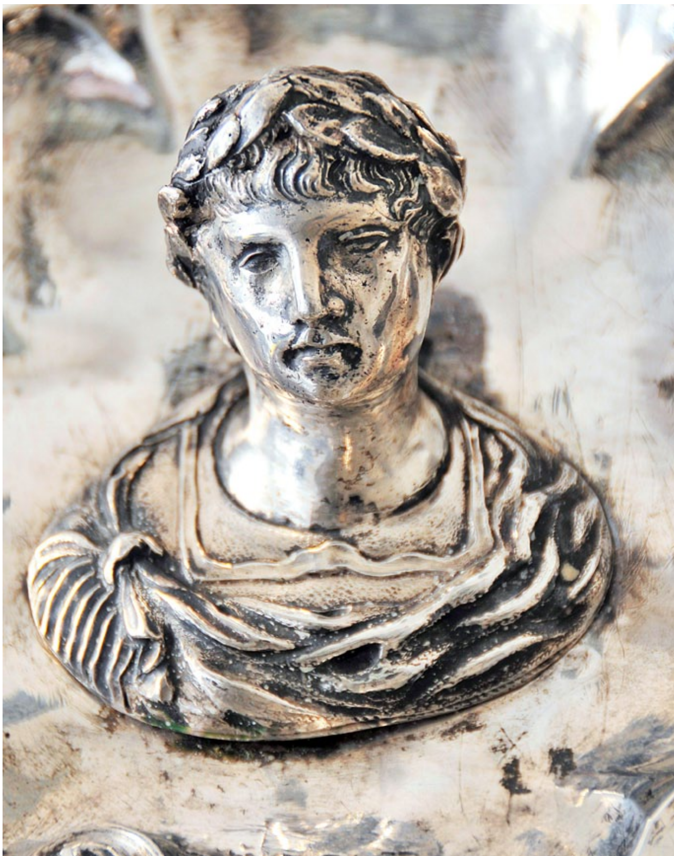
8. Zidni svijećnjak, detalj s prikazom cara Augusta, Franjevački samostan na Trsatu Wall candelabrum, detail representing Emperor Augustus, Franciscan monastery in Trsat