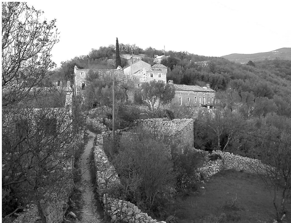
Slika 1. Naselje Kotor