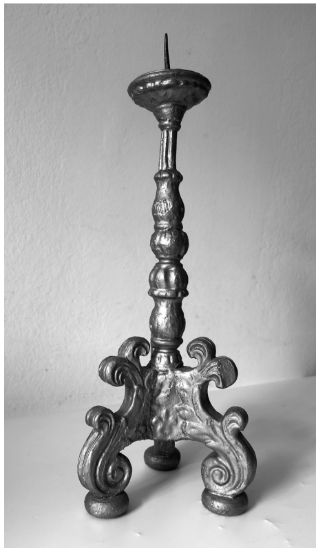
Slika 4. Svjećenjak s Kotora, snimila Tea Rosić, kustos Muzeja Grada Crikvenice, 2015. god.

Jedan popravak raspela zabilježen je 1784. godine među izdatcima u knjizi blagajne spomenute Župne matice župe Kotor u kojoj nalazimo sljedeći zapis: