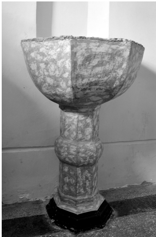
Slike 5., i 6. Krstionica u Crkvi Uznesenja Blažene Djevice Marije. Snimio Slavko Matejčić, 2015. god.