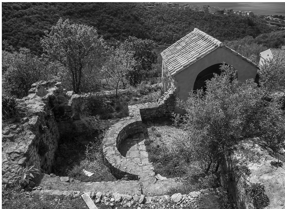
Slika 4. Ostatci crkve Sv. Šimuna i Jude Tadeja konzervirani 2007. godine.

Iz vremena ranoga srednjeg vijeka nemamo povijesnih izvora koji bi evidentirali ili spominjali onodobna groblja na užem prostoru Crikvenice. Ali zato imamo u neposrednoj blizini veliko starohrvatsko groblje na lokalitetu Stranče-Gorica (Cetinić 2011). Groblje je bilo u funkciji od polovice 8. do kraja 11. stoljeća te obuhvaća ukope prema starim poganskim običajima i one iz prijelaznog razdoblja pokrštavanja Hrvata. U razdoblju od 1974. do 1997. godine pronađeno je ukupno 186 grobova na površini od 1400 m 2 u blizini mjesta Semičevići (prijašnje Stranče) na putu Crikvenica – Tribalj. Iskopavanja