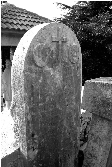
Slika 5. Stari kameni spomenik uzidan u ogradni zid crikveničkog groblja . Snimio Slavko Matejčić 2015. god.

Današnje crikveničko groblje nastalo je na ideji proširenja postojećeg groblja. Nakon osnivanja Banovine Hrvatske 1939. godine promijenjena je spor-