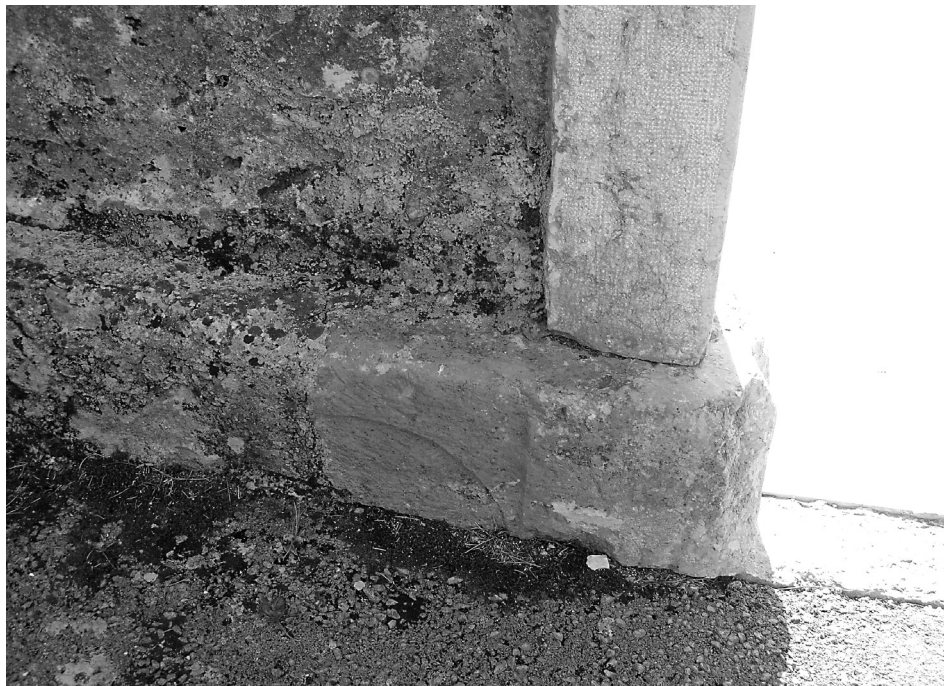
Slika 3. Fragment rimske stele u podnožju baroknog portala. Snimila Sanja Škratić 2012. god.

kojima su Rimljani željeli osigurati prijelaz duše iz ovog u zagrobni život. Dio tih običaja prenesen je i u kasnija razdoblja, pa je dio toga došao i do naših dana (Tomorad 2014). Pogrebne ceremonije trajale su više dana i uključivale su rodbinu, prijatelje i robove, a nekad su i razne udruge brinule o pogrebu svojih članova. Ukop pokojnika vršio se izvan grada uz javne putove, a postojala su dva načina ukopa: inceneracijom (paljevski ukop), prilikom kojega bi se tijelo pokojnika spalilo i zatim bi se pepeo i kosti smjestile u urnu koja bi se zakopala u zemlju, te inhumacijom (skeletalni ukop) polaganjem pokojnika u grob. Sirotinja i robovi pokapali su se u zajedničke grobnice. Kod bogatijih građana i državnih dužnosnika devet dana nakon sprovoda priređivale su se borbe gladijatora. Iznad podzemnog dijela groba postavljao se spomenik s natpisom koji je kod bogatijih Rimljana pretvoren u građevinu – mauzolej.