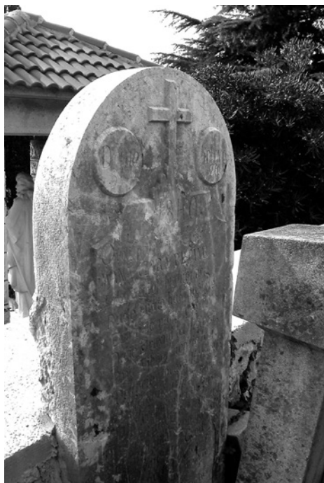
Slika 5. Stari kameni spomenik uzidan u ogradni zid crikveničkog groblja . Snimio Slavko Matejčić 2015. god.

Današnje crikveničko groblje nastalo je na ideji proširenja postojećeg groblja. Nakon osnivanja Banovine Hrvatske 1939. godine promijenjena je spor-