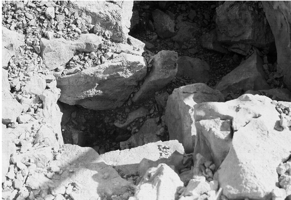
Slika 1. Grobni humak na Stolniču. Snimio Ranko Starac 2003. god.

ropi, sve do njezina zapadnoga ruba; obilježava ju obred spaljivanja pokojnika i pohranjivanja pepela u žare, koje su se potom ukapale u zemljane rake unutar prostranih groblja, te štovanje boga sunca. (Hrvatska enciklopedija 2012).