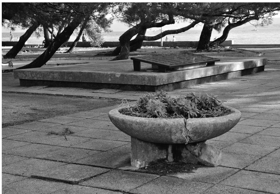
Slika 8. Spomen-kosturnica u crikveničkom Parku palih za domovinu ispred Hotela International .

Osim ovih službenih grobalja postoje i pojedinačna stratišta koja su u vihoru rata privremeno poslužila kao grobišta prilikom nasilnih egzekucija. Na lokalitetu Kmajac blizu mosta za Grižane talijanska fašistička vojska je 26. prosinca 2015. strijeljala dr. Ivana Sobola, Franju Cara i četvoricu Imočana. Isto tako, 1943. godine partizanska vojska je iza klaonice ( Mesoopskrba ) strije-