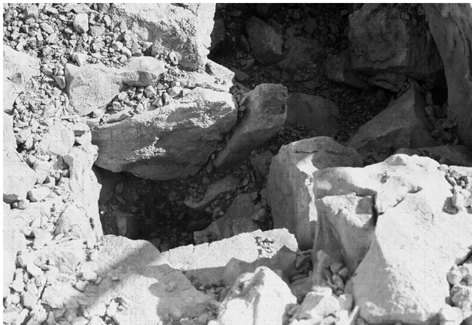
Slika 1. Grobni humak na Stolničju. 2003. god.

ropi, sve do njezina zapadnoga ruba; obilježava ju obred spaljivanja pokojnika i pohranjivanja pepela u žare, koje su se potom ukapale u zemljane rake unutar prostranih grobljâ, te štovanje boga sunca. (Hrvatska enciklopedija 2012).