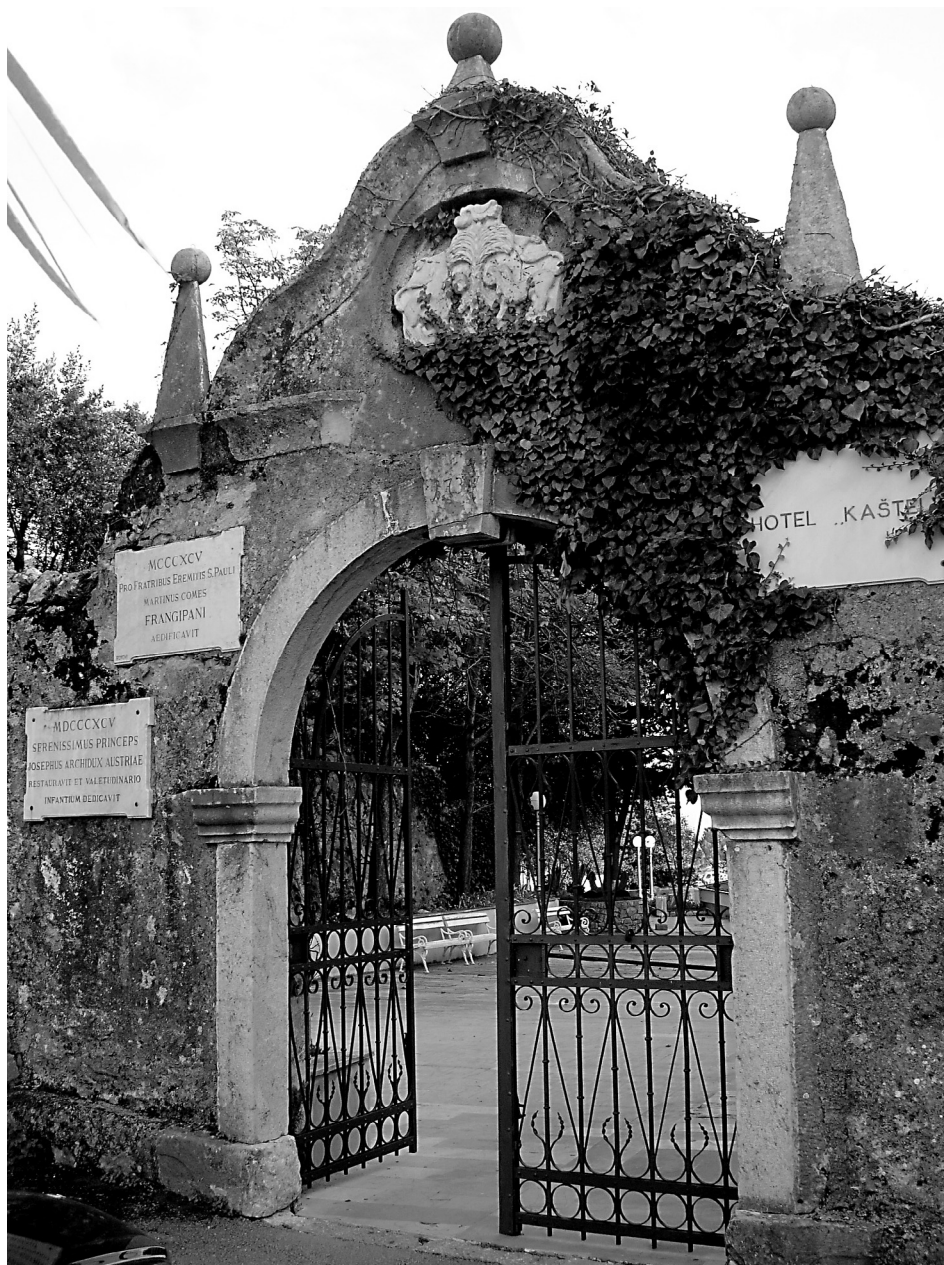
Slika 2. Barokni portal ispred hotela Kaštel. Snimila Sanja Škrgatić 2012. god.