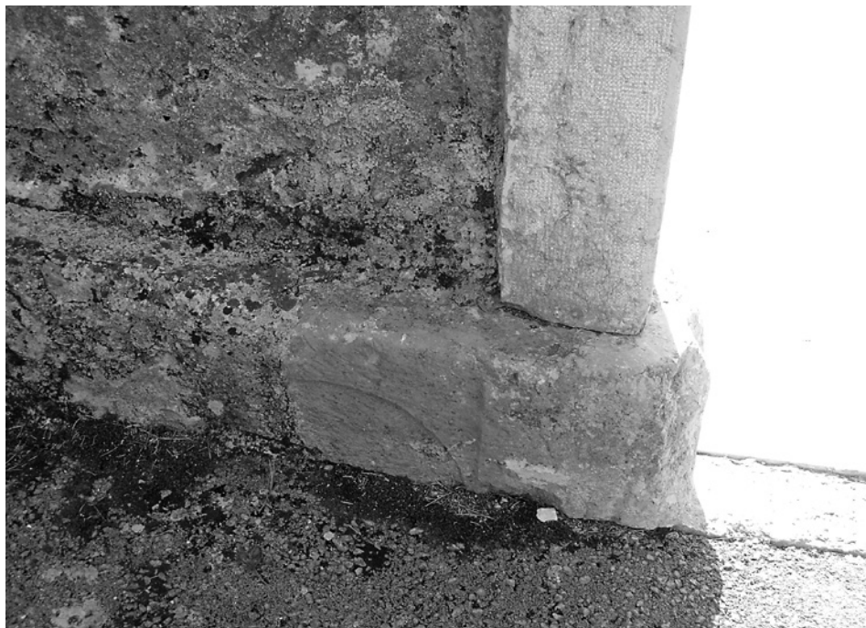
Slika 3. Fragment rimske stele u podnožju baroknog portala. Snimila Sanja Škrgatić 2012. god.

kojima su Rimljani željeli osigurati prijelaz duše iz ovog u zagrobni život. Dio tih običaja prenesen je i u kasnija razdoblja, pa je dio toga došao i do naših dana (Tomorad 2014). Pogrebne ceremonije trajale su više dana i uključivale su rodbinu, prijatelje i robove, a nekad su i razne udruge brinule o pogrebu svojih članova. Ukop pokojnika vršio se izvan grada uz javne putove, a postojala su dva načina ukopa: incineracijom (paljevinski ukop), prilikom kojega bi se tijelo pokojnika spalilo i zatim bi se pepeo i kosti smjestile u urnu koja bi se zakopala u zemlju, te inhumacijom (skeletni ukop) polaganjem pokojnika u grob. Sirotinja i robovi pokapali su se u zajedničke grobnice. Kod bogatijih građana i državnih dužnosnika devet dana nakon sprovoda priređivale su se borbe gladijatora. Iznad podzemnog dijela groba postavljao se spomenik s natpisom koji je kod bogatijih Rimljana pretvoren u građevinu – mauzolej.