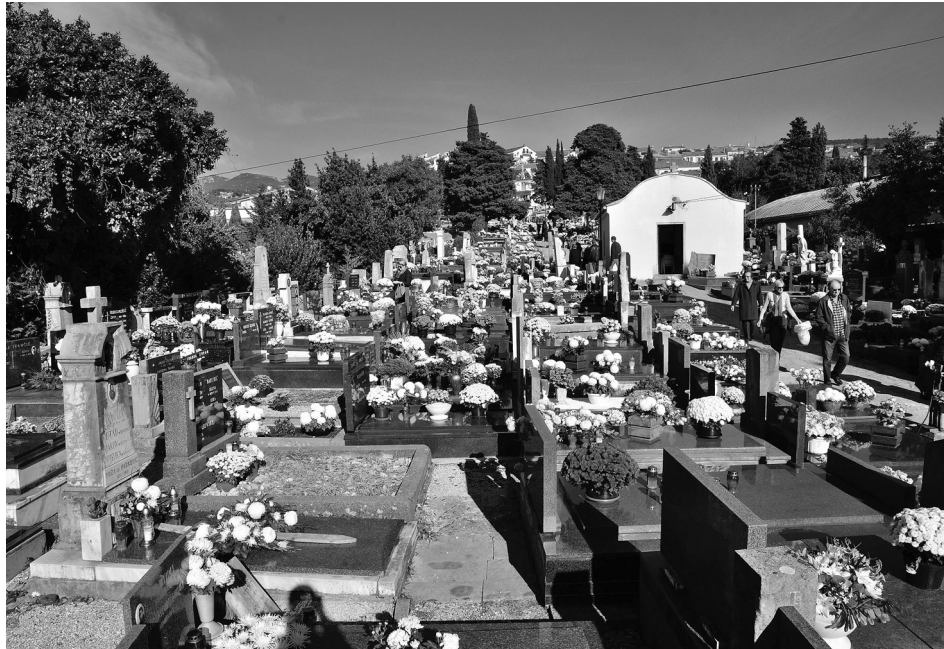
Slika 7. Najstariji dio crikveničkog groblja. Snimio Slavko Matejčić 2015. godine

broj stanovnika Crikvenice povećan je za 72 % ili za ukupno 2.664, što je nešto više od godišnjeg prosjeka tijekom 327 godina. To povećanje broja stanovnika ujedno je značilo i značajno povećanje broja korisnika groblja, a to je i bio glavni motiv rukovodstva komunalnog poduzeća da krene u značajno povećanje površine groblja.