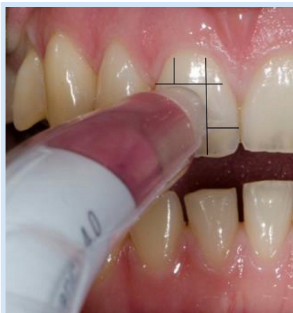
Slika 1. Prikaz postupka mjerenja boje zuba; grafički prikaz pokazuje način određivanja središnjeg područja vestibularne plohe Figure 1 Tooth color measurement; the way of assessing the central region of the labial surface using digital caliper is shown

Central region of the labial surfaces of maxillary right central incisors were measured (Figure 1).