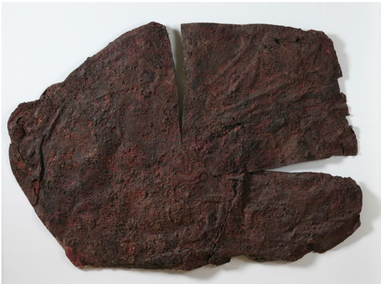
2. Ivo Gattin, Crvena površina s dvije usjekotine , smola, pigment, juta, 1961., Muzej suvremene umjetnosti, Zagreb Ivo Gattin, Red Surface with Two Fissures , 1961, resin, pigment, jute, Museum of Contemporary Art Zagreb

„Napustio je tradicionalnu tehniku, hrabro se suprotstavio normativima ugodnih, prijatnih kvaliteta klasičnog lijepog... Tako je stao upotrebljavati materijale, kojih nema u starim platnima: vosak, lim, pijesak, sirove pigmente... To su nesentimentalne životom nabijene pjesme u materijalima koji postoje i traju u našoj civilizaciji. To