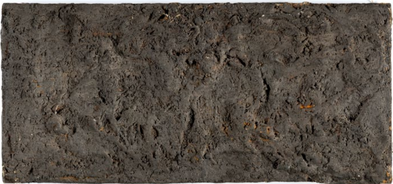
7. Eugen Feller, Malampija , 1962., kombinirana tehnika, platno, Muzej suvremene umjetnosti, Zagreb Eugen Feller, Malampija , 1962, combined technique on canvas, Museum of Contemporary Art Zagreb

„Ovaj izraz uzet je iz Židove reportaže Zatočnica iz Poatjea, u kojoj Žid priča o slučaju jedne žene koju je brat čitavog života držao zatočenu u jednom neverovatno prljavom ćumezu, sa stalno zatvorenim kopcima. Ona je tu počivala na postelji punoj gamadi i izmeta. Brat ju je svakog dana posećivao i dugo bi razgovarao s njom. Kada su je na dostavu suseda izvukli iz ćumeza i već polumrtvu preneli u bolnicu, ona je nepre-