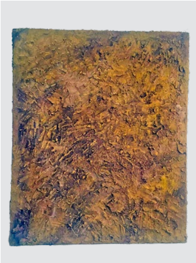
5. Eugen Feller, Žuta površina , 1961., kombinirana tehnika, privatna zbirka Eugen Feller, Yellow Surface , 1961, combined technique, private collection

mnogi stali... Radi se o negaciji slike, o stvaranju antilikovnog djela 27