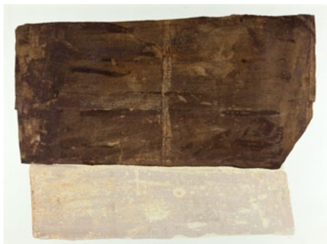
8. Eugen Feller, Bez naslova , 1964., ulje, papir, Muzej suvremene umjetnosti, Zagreb Eugen Feller, Untitled , 1964, oil on paper, Museum of Contemporary Art Zagreb

Pojam Malampije u nazivu vlastita slikarskoga ciklusa Feller, dakle, pronalazi čitajući roman Portret nepoznatog Natalie Sarraute, ali to dakako nipošto ne bi trebalo shvatiti kako taj pojam i slike na koje se odnosi ilustriraju literarni sadržaj teksta spomenute francuske spisateljice. Simptomatično je, pri tome, da Fellerova tadašnja omiljena lektira pripada književnosti „novoga romana”, umjesto što bi to bila književnost predvodnika egzistencijalizma poput Sartreove Mučnine i Camusova Stranca . Umjetnik samouk kao što je to tada mladi Feller u ciklusu Malampije svoje slikarstvo zasniva na mentalnim, umjesto na likovnim/vizualnim temeljima, ali se ipak neizbježno sučeljava sa zadaćom kako da vlastite zamisli uvede i uobličiti na način svojstven kategoriji i praksama slikarstva. Uzor izvršenja svoje slikarske prakse Feller će pronaći u primjeru svoga prethodnika Ive Gattina kojemu duguje određeni repertoar tehničkih i operativnih postupaka, utiskujući u njih vlastite misaone sadržaje i emotivna stanja. Upravo zbog toga, unatoč kratkom trajanju i nevelikom broju izvornih primjeraka, Malampije predstavljaju značajno poglavlje ne jedino u ukupnom Fellerovu umjetničkom opusu nego, zajedno s ostalim protagonistima ovoga pravca, također i u području radikalnoga enformela u hrvatskoj umjetnosti druge polovice 20. stoljeća.