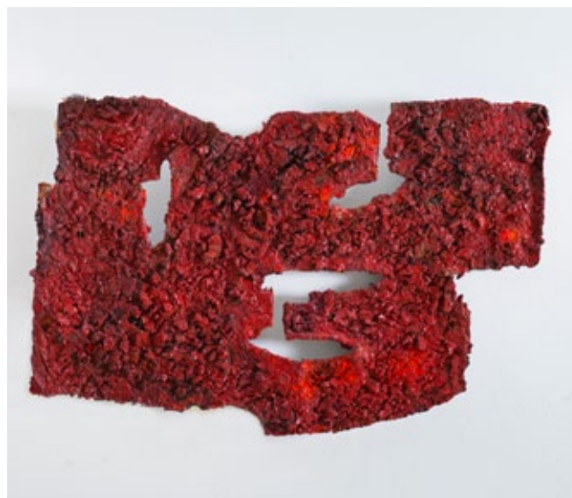
3. Ivo Gattin, Bez naziva , 1962., kombinirana tehnika, kolekcija Tihomir Jukić

„Zabune koje su rezultirale pasivnošću u odnosu na materijal treba ukloniti, jer je jedan od aksioma slikarskog stvaralaštva da slikar ima potpunu vlast nad materijalom i njegovim izborom. Ako je materijal aktivan element, koji ima uticaja na akt stvaranja, tada on može biti bilo koji materijal što ga slikar može podvrgnuti svome htijenju. Ako smo u sebi prevladali stav tradicije s obzi-