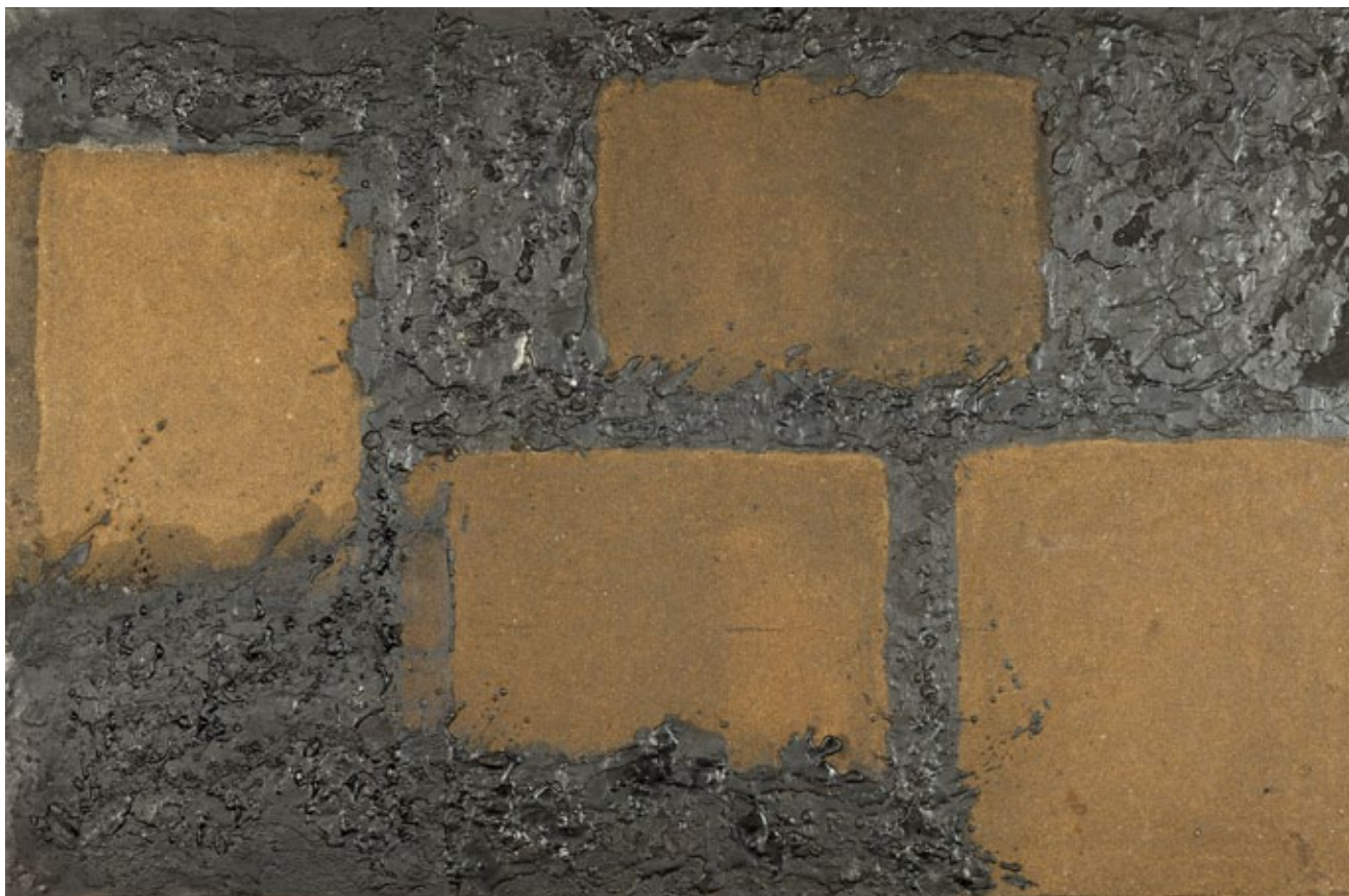
1. Ivo Gattin, Blokovi No 2 , 1956., brusni lak, pigment, vosak, pijesak, platno, Muzej savremene umjetnosti, Zagreb Ivo Gattin, Blocs No 2 , 1956, sanded lacquer, pigment, wax, sand, canvas , Museum of Contemporary Art Zagreb

Moralo je proteći dugo vrijeme, od prvih umjetnikovih nastupa do zaslužene posthumne revalorizacije, kako bi djelo Ive Gattina danas konačno steklo vrlo istaknuto