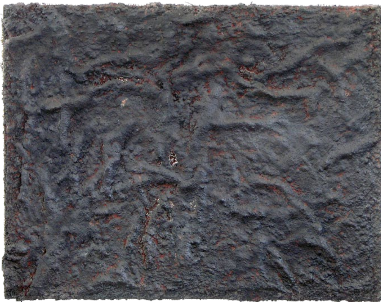
4. Eugen Feller, Malampija , 1961., kombinirana tehnika, Galerija umjetnina, Split Eugen Feller, Malampija , 1961, combined technique, Museum of Fine Arts Split

„Ciklus od osam slika Malampija nema vidljivog početka ni kraja, hermetiski je zatvoren. Traženja mladog slikara (star 20. god.) nalaze se već sada izvan sfere likovnog. Čini se da on počinje gdje su