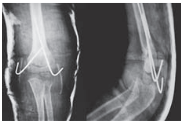
Slika 2. Zatvorena repozicija, perkutana stabilizacija ulomaka s dvije Kirschnerove žice i imobilizacija Figure 2. Close reposition, percutaneous fracture fixation with two Kirschner wires and immobilization

Za fiksaciju ulomaka tog izuzetno nestabilnog prijeloma rabi se više metoda: imobilizacija nadlaktičnom udlagom s podlakticom u raznim položajima, više desetaka trakcijskih metoda, više oblika perkutane fiksacije, operacijska repozicija i fiksacija Kirschnerovim žicama ili vanjskim fiksatorom. 18-22