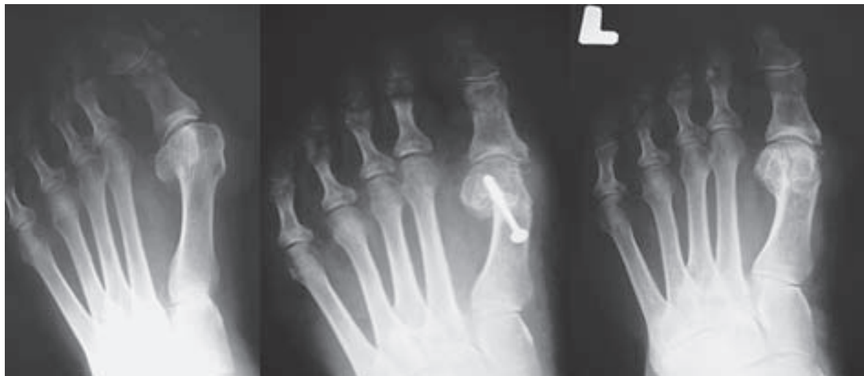
Slika 2. Dorzoplantarna rendgenska snimka lijevog stopala. Slijeva nadesno: prije operacije, dva mjeseca poslije i osam godina poslije korekcije haluksa valgusa autorovom metodom gdje je vidljiv pomak distalnog fragmenta prve metatarzalne kosti u horizontalnoj ravnini (glavica je lateralizirana, a rotirana medijalno). Korigiran je kut haluksa valgusa, prvi intermetatarzalni kut, nagib zglobne površine glavice prve metatarzalne kosti i položaj sesamoida te uspostavljena kongruencija zgloba.

Figure 2. Dorsoplantar X-ray of the left foot. From left to right: before surgery, two months after and eight years after correction of hallux valgus deformity with author's method. Lateral shift of the distal fragment of the first metatarsal is seen in horizontal plane (head is lateralized and rotated medially). Hallux valgus angle is corrected as well as first intermetatarsal angle, distal metatarsal articular angle, sesamoid position and congruency of the joint is restored.