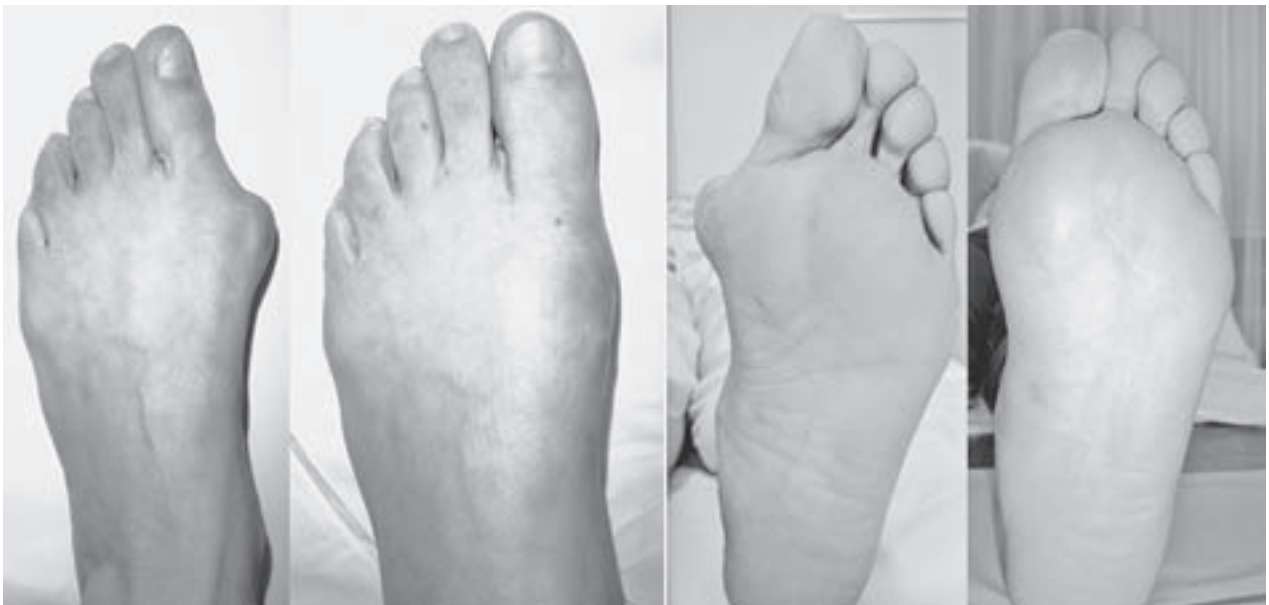
Slika 5. Klinički izgled lijevog stopala. Slijeva nadesno: s dorzalne strane prije operacije i nakon operacijske korekcije lijevog stopala metodom dr. Lucijanića te s plantarne strane prije i nakon operacije.

Figure 4. Axial X-ray of the left foot. From left to right: before surgery, two months after and eight years after correction of hallux valgus deformity with author's method. Correction of the pronation is seen on the first metatarsal.