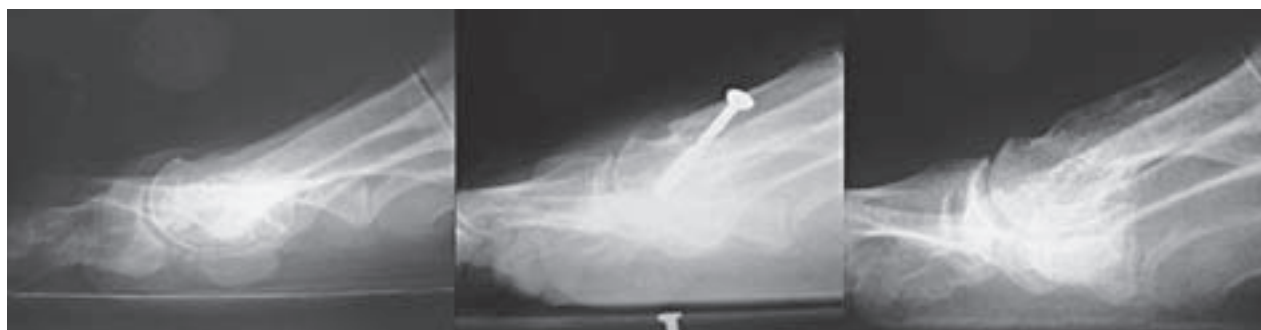
Slika 3. Profilna rendgenska snimka lijevog stopala. Slijeva nadesno: prije operacije, dva mjeseca nakon i osam godina nakon korekcije haluksa valgusa autorovom metodom kada je vidljiv plantarni pomak distalnog fragmenta prve metatarzalne kosti u sagitalnoj ravnini (glavica je plantarizirana).

Figure 2. Dorsoplantar X-ray of the left foot. From left to right: before surgery, two months after and eight years after correction of hallux valgus deformity with author's method. Lateral shift of the distal fragment of the first metatarsal is seen in horizontal plane (head is lateralized and rotated medially). Hallux valgus angle is corrected as well as first intermetatarsal angle, distal metatarsal articular angle, sesamoid position and congruency of the joint is restored.