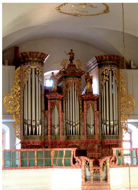
Desno: Slika 6. Orgulje varaždinske katedrale nakon obnove 1990. godine.