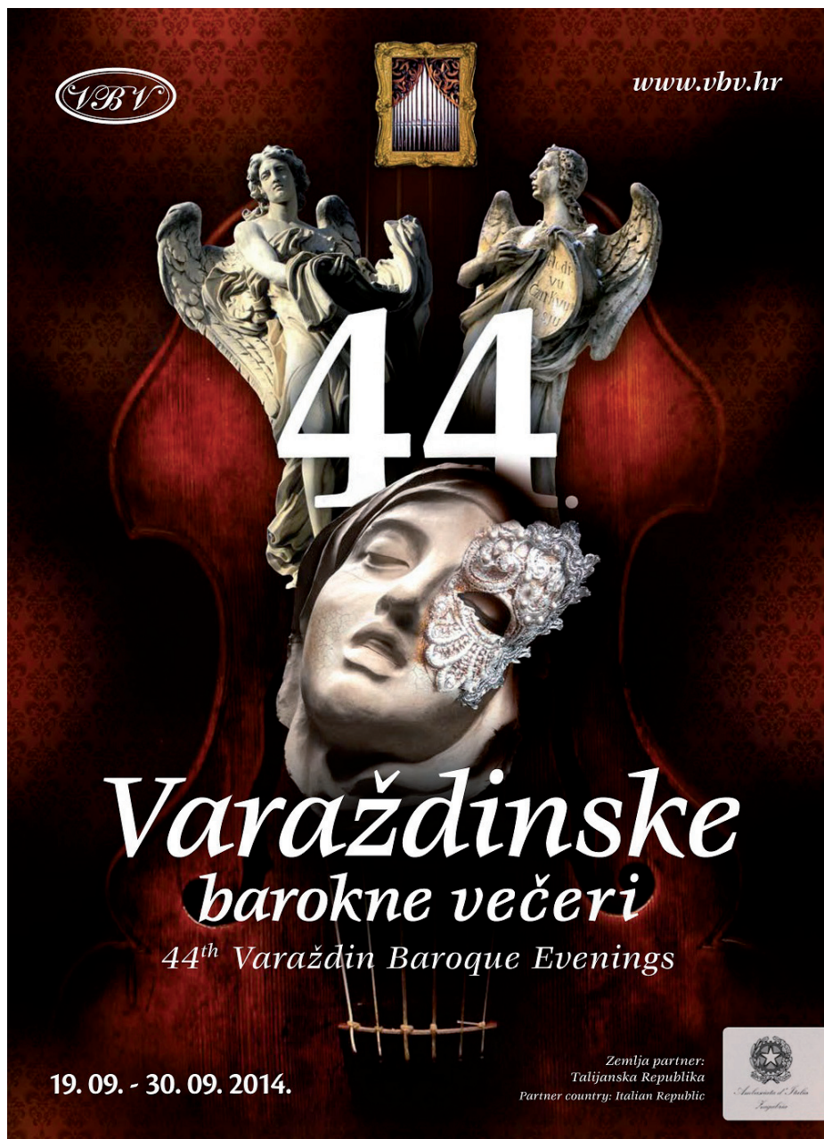
Slika 7. Plakat za 44. Varaždinske barokne večeri / 44 th Varaždin Baroque Evenings 19. 09. – 30. 09. 2014. Zemlja partner: Talijanska Republika.