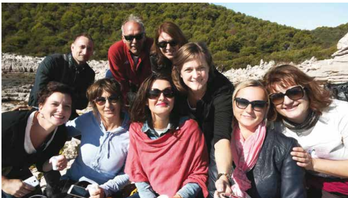
Slika 6: Dio sudionika skupa na stručnoj ekskurziji.

Zahvaljujem organizatorima na sjajno organiziranom skupu te članovima Znanstvenog odbora koji su i ovoga puta osigurali raznolikost i visoku razinu kvalitete prezentiranih radova. Skup je u potpunosti ispunio očekivanja i još jednom postigao cilj definiran prije dvadeset godina te pozivam čitatelje da svakako ne propuste sljedeći skup. „Četiri stvari ne vraćaju se: izgovorena riječ, izbačena strijela, protekla vremena, i propuštena prigoda. “ (Omar Ibn Al – Halif) ■