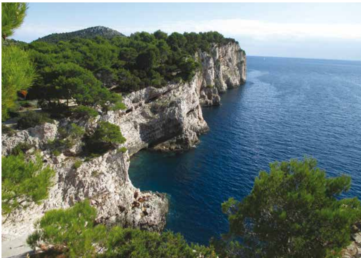
Slika 5: Litica iznad mora u Parku prirode Telašćica.