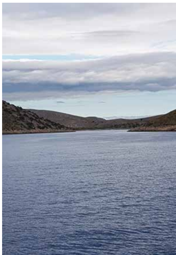
Slika 4: Na razgledavanju Nacionalnog parka Kornati.