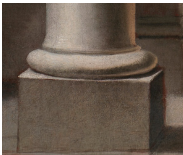
12. Isti detalj nakon radova The same detail after conservation

britanskoj Kraljevskoj kolekciji, ta renesansna pala je spojena i izložena kao cjelina. Peti dio (Sveti Zeno iz Verone i sv. Jeronim) otkupljen je 1929. godine, ali okrnjen. Očuvana je samo gornja polovica prikaza svetačkog para te je nedostajući dio iste godine nadomješten vrlo uspjelom slikarskom interpolacijom i rekonstrukcijom. 10