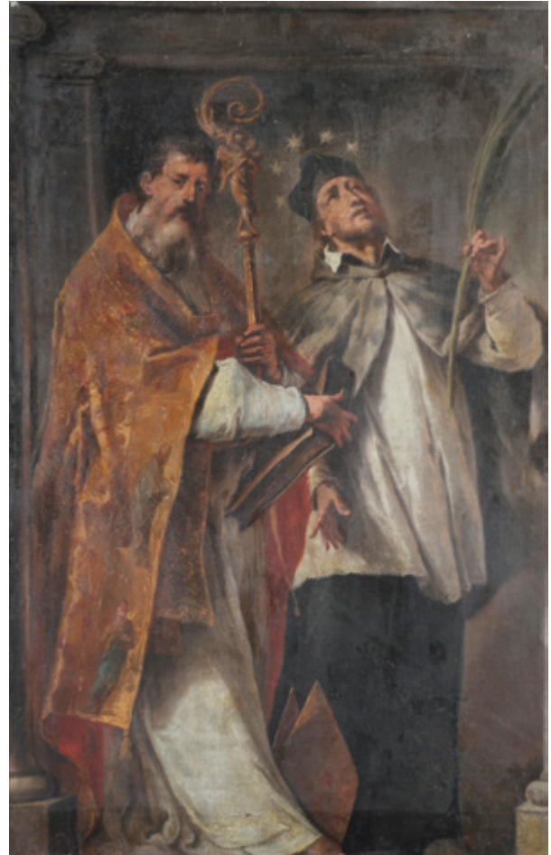
2. Nicola Grassi, Sv. Augustin i sv. Ivan Nepomuk , zatečeno stanje, Krk, Katedralna riznica Nicola Grassi, St. Augustine and St. John of Nepomuk , pre-existing condition, Krk, Cathedral Treasury

tovo da nije moguće sagledati svu raznolikost promjena, žive kronike otisaka ljudske aktivnosti na umjetničkim predmetima koji se oštećuju nesvjesno, iz želje da im se produlji vijek, ili planirano destruktivno. Umjetnine se često i odbacuju, najčešće zbog gubitka izvorne namjene ili zanimanja vlasnika. „Zastarjeli“ predmeti bit će zamijenjeni stilski i sadržajno „modernijim“ ili, nerijetko, zato što pripadaju naslijeđu zajednica sukobljenih zbog političkih, vjerskih i inih razloga. U novije vrijeme, znanstveni, „educirani“ vandalizam ima za posljedicu uklanjanje dijelova inventara koji su nastali u nedovoljno valoriziranom ili namjerno podcijenjenom povijesnom razdoblju i ne uklapaju se u aktualni koncept zaštite i prezentacije složenijih umjetničkih i povijesnih struktura.