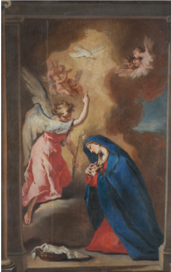
1. Nicola Grassi, Navještenje , zatečeno stanje, Krk, Katedralna riznica Nicola Grassi, Annunciation , pre-existing condition, Krk, Cathedral Treasury