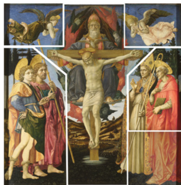
7. Francesco Pesellino, fra Filippo Lippi i radionica, Oltar sv. Trojstva . Razrezani dijelovi pale su tijekom 19. i 20. stoljeća otkupljeni i spojeni u cjelinu. Izgubljeni donji desni dio je rekonstruiran 1929. godine (National Gallery, London and the Royal Collection)

Francesco Pesellino, Fra Filippo Lippi and workshop, The Pistoia Santa Trinità Altarpiece. The severed parts of the altarpiece were collected and brought into a whole during the 19th and 20th century. The lost bottom right portion was reconstructed in 1929 (The National Gallery, London and The Royal Collection)