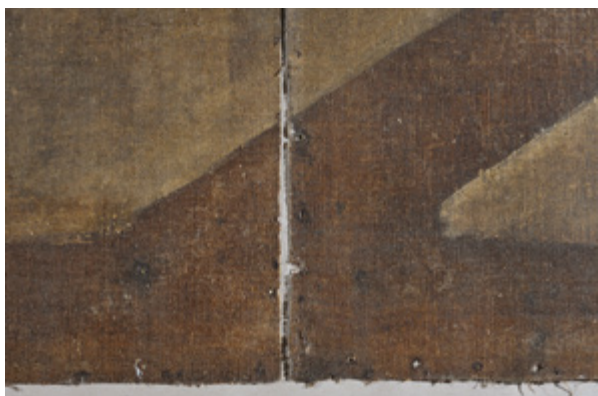
9. Detalj poledine s obrisom izvornog podokvira na spoju fragmenata (fototeka HRZ-a, snimila N. Oštarijaš, 2013.) Detail of the back side with the original stretcher frame at the fragments' joint (Croatian Conservation Institute Photo Archive, photo by N. Oštarijaš, 2013)