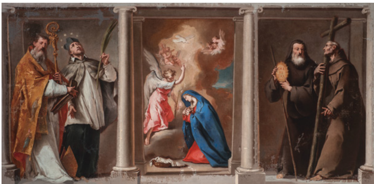
13. - 14. Nicola Grassi, Navještenje sa svecima , stanje nakon kitanja i prve faze retuša, Krk, Katedralna riznica (fototeka HRZ-a, snimio Lj. Gamulin, 2013.)

Nicola Grassi, Annunciation with Saints, after the filling and the first phase of retouching , Krk, Cathedral Treasury (Croatian Conservation Institute Photo Archive, photo by Lj. Gamulin, 2013)