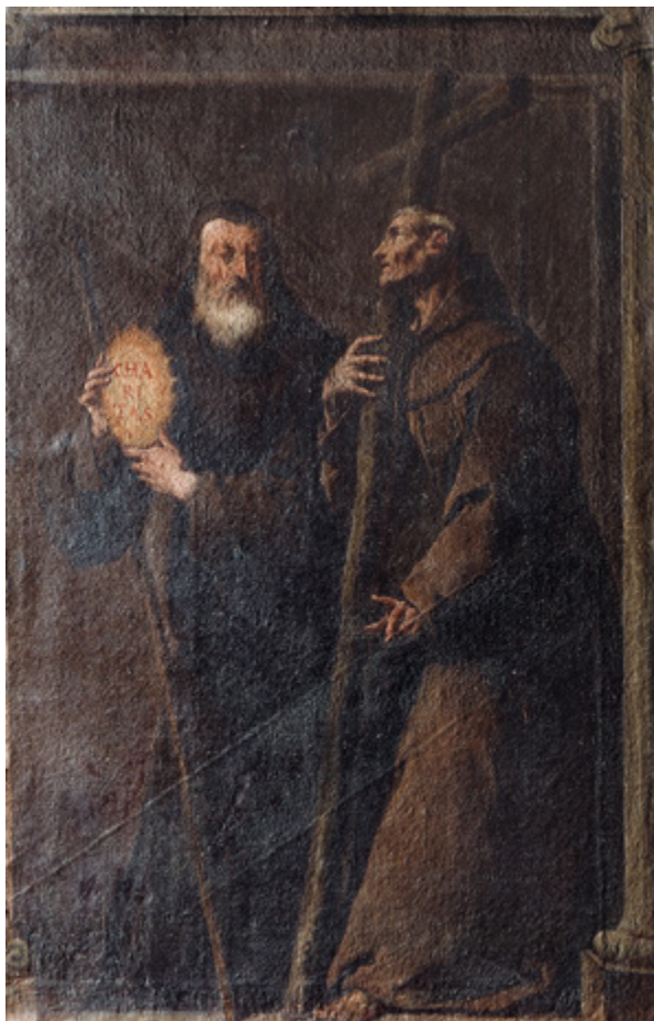
4. Snimka detalja pod kosim svjetlom s vidljivim otiskom dijagonalno postavljene letvice izvornog podokvira

Detail, phot taken under raking light with a visible impression of a diagonally set slat of the original stretcher frame