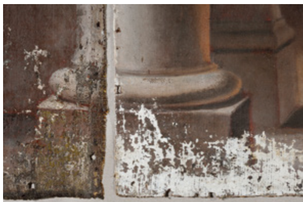
10. Isti detalj slike, s velikim gubicima boje (fototeka HRZ-a, snimila N. Oštarijaš, 2013.) The same detail with visible loss of paint (Croatian Conservation Institute Photo Archive, photo by N. Oštarijaš, 2013)