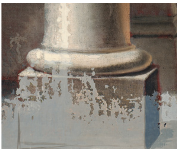
11. Detalj nakon spajanja i tijekom retuša Detail after assembling and during the retouch