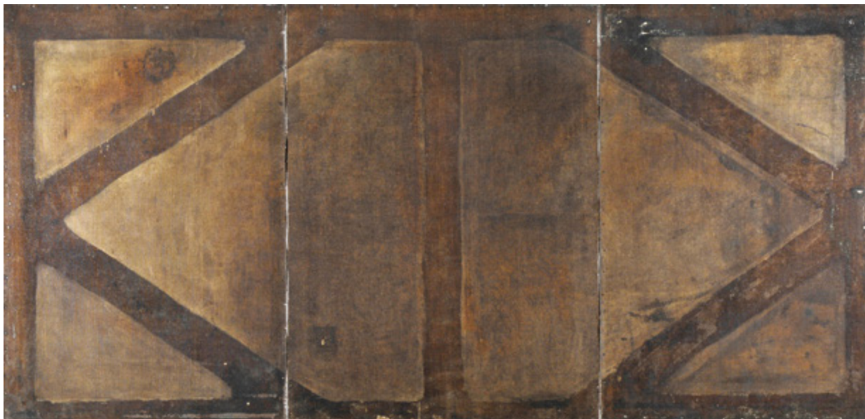
8. Poledina slika s obrisom izvornog podokvira, nakon uklanjanja stare rentoalaže Back side of the paintings with the trace of the diagonally set slot of the original stretcher frame, after the relining was removed

su umjetnine izvorno nastale 7 (sl. 6). Uzimajući u obzir brojnost razjedinjenih umjetnina i umjetničkih cjelina te institucija u kojima se fragmenti nalaze, malo je vjerojatno da će većina ikad biti ponovno objedinjena u izvornu cjelinu, premda su fragmenti postali predmetom mnogih znanstvenih istraživanja i studija.