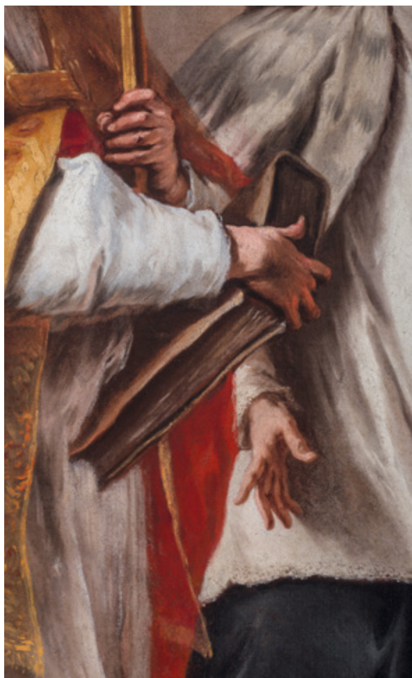
15. - 16. Detalji nakon radova Details after conservation

boje. Stari zakiti su se raspucali, retuši i damar-lak kojim su slike bile lakirane, potamnili i izgubili prozornost, a vezivna snaga voštano-smolne mase za dubliranje popustila. Rastopljena veća količina voštano-smolne mase koja je tijekom dubliranja prošla kroz pukotine s poledine na lice slike, gotovo da i nije bila uklonjena, već je bila prekrivena lakom. Retuš je prekrivao veće, neoštećene zone izvornog slikanog sloja, kao i ostatke voska od dubliranja na licu. Sve tri slike u cjelini su izgledale trošno, ugasla kolorita i umrtvljene slikarske geste čija se živost nazirala pod slojevima lakova, retuša i nečistoće.