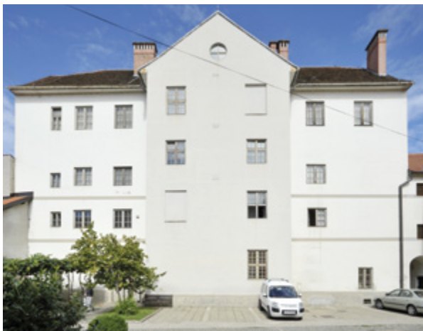
1. Varaždin, zgrada nekadašnjeg franjevačkog nemoćišta, pogled na južno pročelje Varaždin, building of the former Franciscan infirmary, view of the south front

svijeta. 7 Najopsežniju ikonografsku analizu Rangerove freske izradila je Marija Mirković, 8 čiju su tezu o prikazu Marije kao Nebeske ljekarne okružene simbolima četiriju elemenata preuzeli i kasniji autori, koji su temu uglavnom obrađivali u kontekstu Rangerova opusa ili s naglaskom na posttridentsku ikonografiju. 9