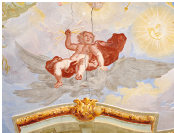
14. Varaždin, zgrada nekadašnjeg franjevačkog nemoćišta, lik dječaka Jupitera, detalj freske u prostoriji nekadašnje ljekarne. Vidljive pukotine na svodu Varaždin, former Franciscan infirmary building, figure of the boy Jupiter, detail of the fresco in the former pharmacy. Visible are cracks on the vault

Marija u središtu prikazana je kao nebeska kraljica, koja lebdi nad sva četiri prapočela. Iako je „sakralna kompo-