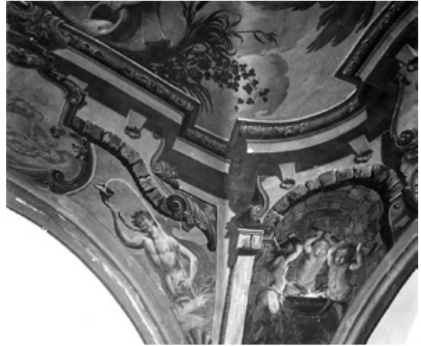
7. Stanje freske na jugozapadnoj peti svoda, 1953. godine (fototeka Ministarstva kulture, inv. br.: 14391, neg.: II-2446, snimio V. Bradač) Condition of the fresco on the southwest foot of the vault in 1953 (Ministry of Culture Photo Archive, inv. no. 14391, neg. II-2446, photo by V. Bradač)