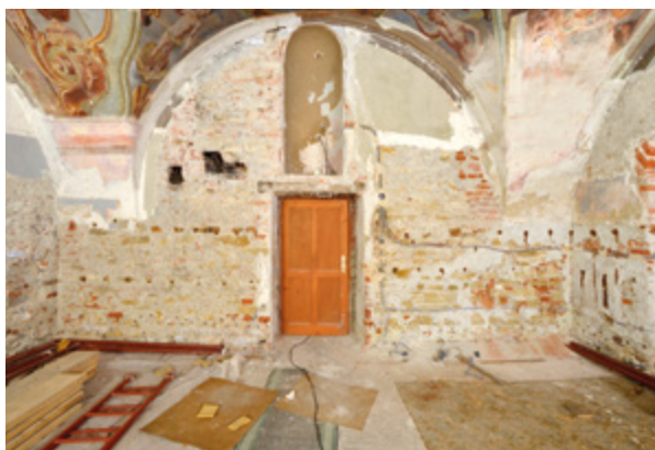
3. Varaždin, zgrada nekadašnjeg franjevačkog nemoćišta, pogled na južni zid prostorije nekadašnje ljekarne (fototeka HRZ-a, snimio J. Kliska, 2013.)

Varaždin, former Franciscan infirmary building, view of the former pharmacy south wall (Croatian Conservation Institute Photo Archive, photo by J. Kliska, 2013)