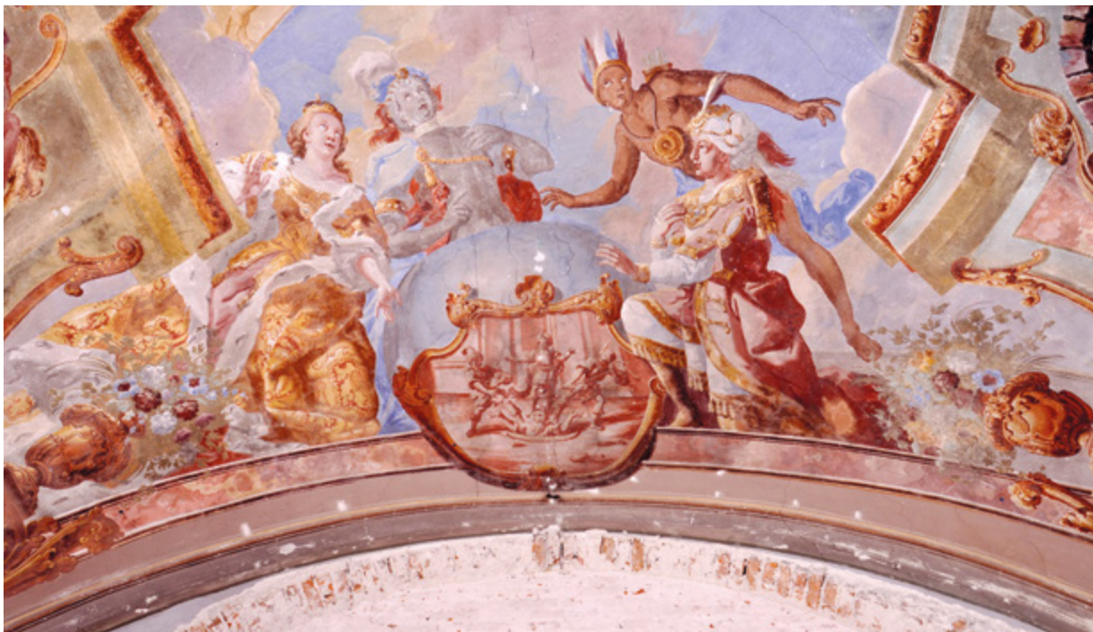
13. Varaždin, zgrada nekadašnjeg franjevačkog nemoćišta, personifikacije četiriju kontinenata na svodnoj freski u prostoriji nekadašnje ljekarne (fototeka HRZ-a, snimio J. Kliska, 2013.)

Varaždin, former Franciscan infirmary building, personifications of four continents on the vault fresco in the former pharmacy (Croatian Conservation Institute Photo Archive, photo by J. Kliska, 2013)