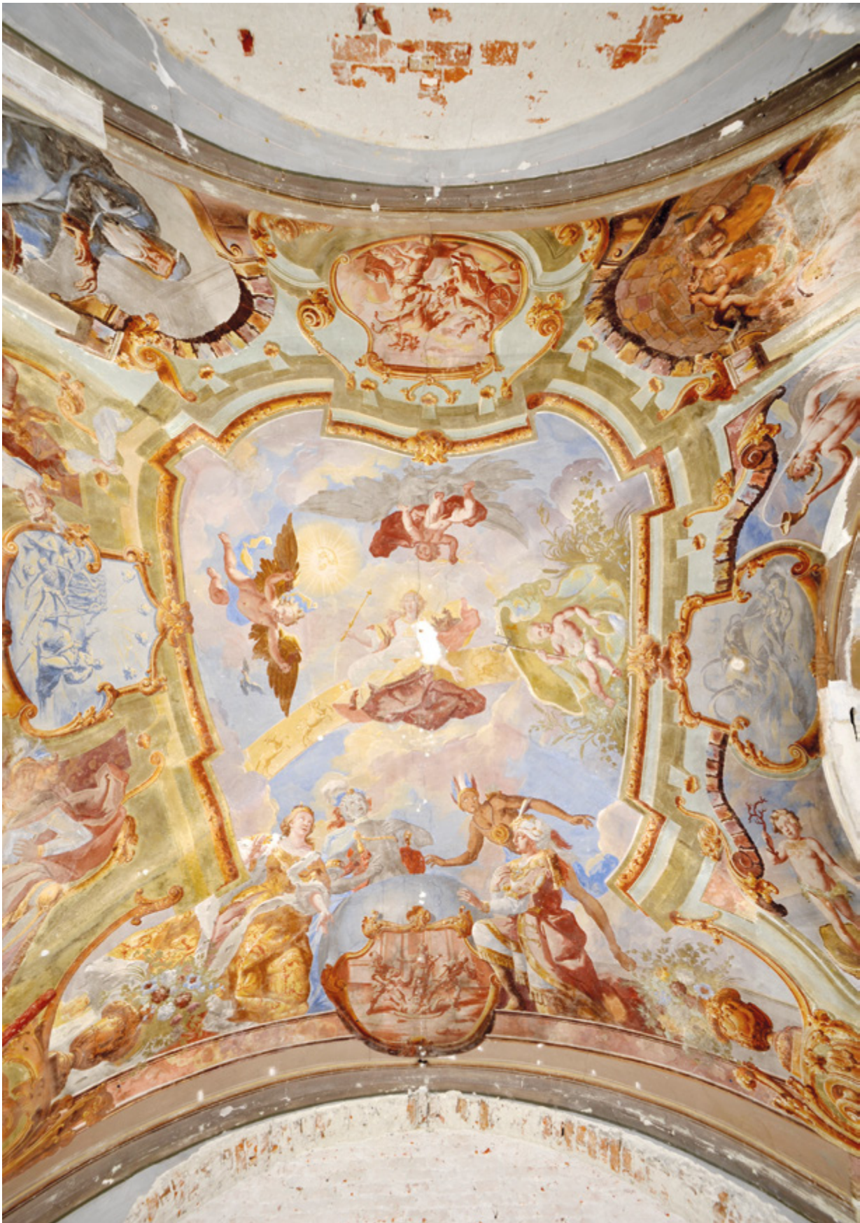
2. Varaždin, zgrada nekadašnjeg franjevačkog nemoćišta, svodna slika u prostoriji nekadašnje ljekarne

Varaždin, former Franciscan infirmary building, vault painting in the former pharmacy