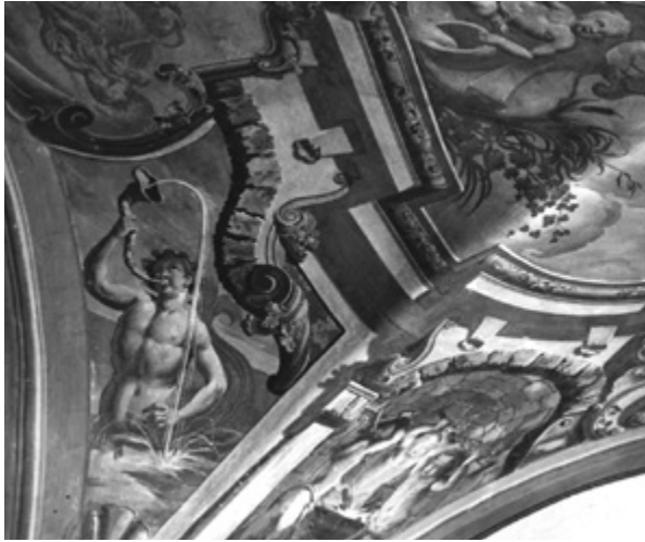
6. Detalj freske na jugozapadnoj peti svoda, stanje 1939. godine (inv. br. SFA-1904-1) Detail of the fresco on the southwest foot of the vault, condition in 1939 (inv. no. SFA-1904-1)