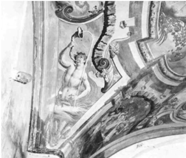
8. Stanje freske na jugozapadnoj peti svoda s vidljivim oštećenjima 1972. godine (inv. br. II-15-17) Condition of the fresco on the southwest foot of the vault with visible injuries in 1972 (inv. no. II-15-17)