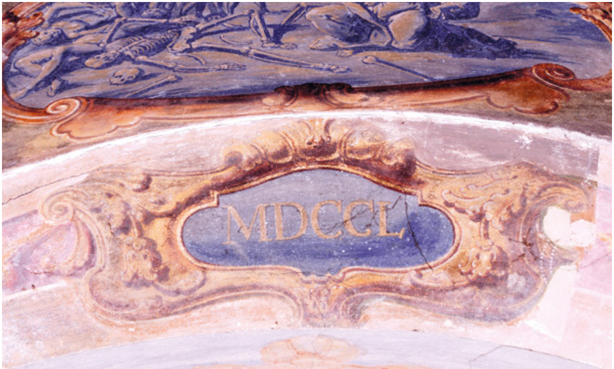
11. Varaždin, zgrada nekadašnjeg franjevačkog nemoćišta, slikana kartuša s 1750. godinom iznad prozora u prostoriji nekadašnje ljekarne

Varaždin, former Franciscan infirmary building, painted cartouche with the year 1750 above the window in the former pharmacy