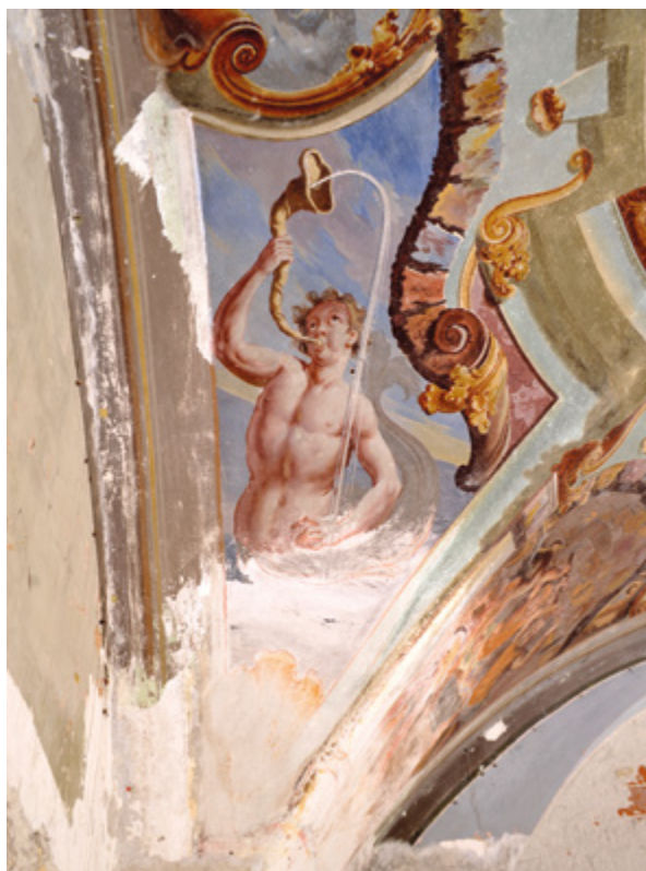
10. Zatečeno stanje freske na jugozapadnoj peti svoda prije početka istraživanja. Vidljiva je pulverizacija i isipanje slikanog sloja

Projekt za dogradnju trećeg kata zgrade sjemeništa te za prigradnju još jednog troetažnog objekta na prostoru između sjemeništa i ulice izrađen je 1940. godine. Pro-