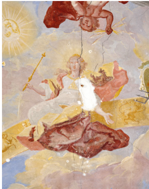
12. Varaždin, zgrada nekadašnjeg franjevačkog nemoćišta, lik Marije kao Nebeske ljekarne na svodnoj freski u prostoriji nekadašnje ljekarne Varaždin, former Franciscan infirmary building, figure of Mary as the Heavenly Pharmacy on the vault fresco in the former pharmacy

Južni zid prostorije u kojoj je uređena obnovljena ljekarna danas je rastvoren te ona s hodnikom čini jedinstven prostor. Izvorno je uzdužni zid hodnika kontinuirao pa je prostorija imala približno kvadratni tlocrt. Svodena je niskim križno-bačvastim svodom na kojem su, ispod