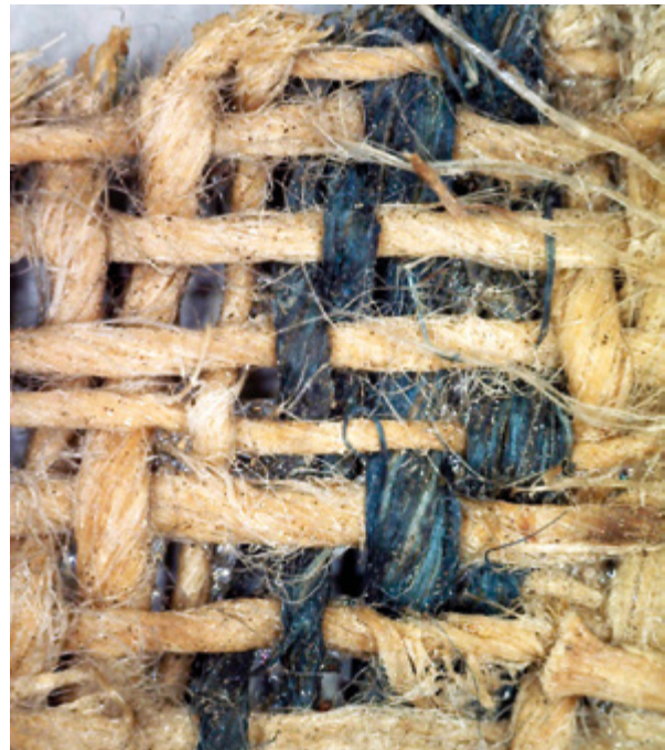
7. Nepoznati slikar, Bogorodica s Djetetom i svecima , vjerojatno 18. stoljeće, detalj tkanja platna s tamnoplavim prugastim uzorkom (naličje tkanine, osnova postavljena vertikalno), Povlja (Brač), crkva sv. Ivana Krstitelja (fototeka HRZ-a, uzorak iz platnoteke Restauratorskog odjela u Splitu, povećanje 50 x, snimila J. Zagora, 2016.)

Unknown artist, Virgin and Child with Saints, probably 18th century, detail of the canvas weave with vague grey and brown striped pattern (fabric face, warp set vertically), Povlja (Brač), church of St. John the Baptist (Croatian Conservation Institute Photo Archive, sample from the canvas sample archive of the Split Conservation Department, magnification 50x, photo by J. Zagora, 2016)