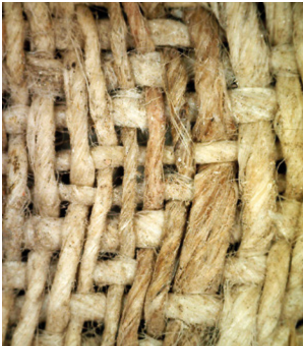
6. Nepoznati slikar, Bogorodica s Djetetom i svecima , vjerojatno 18. stoljeće, detalj tkanja platna s nejasnim sivo-smeđim prugastim uzorkom (lice tkanine, osnova postavljena vertikalno), Povlja (Brač), crkva sv. Ivana Krstitelja (fototeka HRZ-a, uzorak iz platnoteke Restauratorskog odjela u Splitu, povećanje 50 x, snimila J. Zagora, 2016.)

Unknown artist, Virgin and Child with Saints, probably 18th century, detail of the canvas weave with vague grey and brown striped pattern (fabric face, warp set vertically), Povlja (Brač), church of St. John the Baptist (Croatian Conservation Institute Photo Archive, sample from the canvas sample archive of the Split Conservation Department, magnification 50x, photo by J. Zagora, 2016)