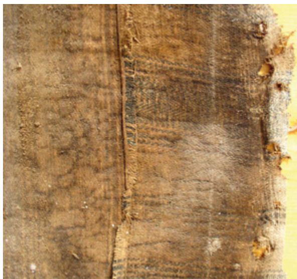
5. Nepoznati slikar, Bogorodica s Djetetom i svecima , vjerojatno 18. stoljeće, detalj poledine platna (spoj dviju različitih vrsta tkanina), Povelja (Brač), crkva sv. Ivana Krstitelja (fototeka HRZ-a, snimila R. Kalilić, 2007.)

Na platnu za madrace veza riblje kosti s plavim prugama Paulus Moreelse je 1621. godine izradio Portret gospodina (124,5 x 97 cm), a 1930. Poklonstvo pastira (90 x 137,5 cm), 48 dok je Pieter van Lint 1631. godine naslikao Poklonstvo kraljeva (širina tkanine je oko 134 cm, niti osnove i potke po centimetru ima 18-20/16, smjer uvoja je Z). 49 U Antwerpenu se čuva djelo Theodoora Romboutsa iz 1636. godine, naslikano na podlozi od dva zašivena komada platna za madrace povratnog kepernog veza s plavim prugama postavljenim u horizontalnom smjeru, dimenzija 136,5 x 211,5 i 133 x 211,5 cm. 50 Na prugastom platnu izrađena je i velika slika Jana Weenixsa Pejzaž s lovcom i