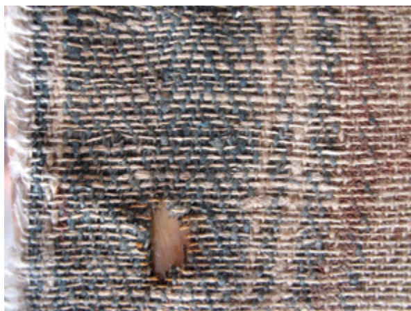
14. Filippo Naldi, Bogorodica s Djetetom i sv. Vlahom , 1774., detalj lijevog ruba poledine platna (naličje tkanine), Viganj (Pelješac), crkva sv. Mihovila Filippo Naldi, Virgin and Child with St. Blaise, 1774, detail of the left edge of the canvas back side (fabric reverse), Viganj (Pelješac), church of St. Michael