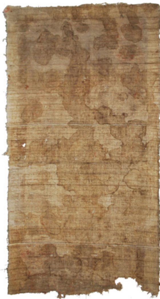
15. Filippo Naldi, Gospa od Karmela i Krštenje Krista , 1761., zatečeno stanje slike (lice i poledina), Kostanje, crkva sv. Mihovila Filippo Naldi, Our Lady of Carmen and The Baptism of Christ, 1761, as found (face and back side), Kostanje, church of St. Michael