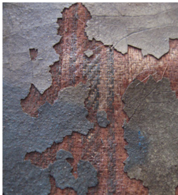
19. Nepoznati slikar, Bogorodica Bezgrešna , 1609., detalj teksture pod kosim svjetlom, Šibenik, crkva sv. Nediljice na predjelu Crnica; nepoznati slikar, Krštenje Krista , 18. stoljeće, detalj teksture pod kosim svjetlom, Gornje Selo (Šolta), crkva sv. Ivana Krstitelja

Unknown artist, The Immaculate Virgin, 1609, detail of the texture under raking light, Šibenik, church of St. Domenica in the Crnica area; unknown artist, The Baptism of Christ, 18th century, detail of the texture under slanted light, Gornje Selo (Šolta), church of St. John the Baptist