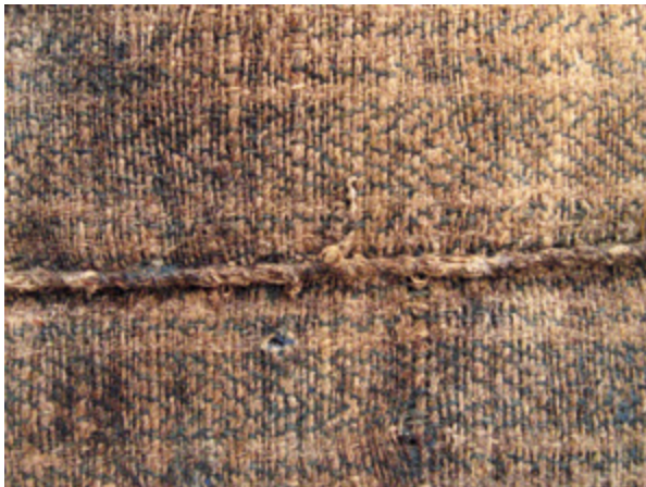
4. Nepoznati slikar, Bogorodica Bezgrešna , 1609., detalj poledine platna s izvornim šavom, Šibenik, crkva sv. Nediljice na predjelu Crnica Unknown artist, The Immaculate Virgin , 1609, detail of the canvas with the original stitch, Šibenik, church of St. Domenica in the Crnica area

carinska tarifa iz 15. stoljeća bilježi ih u popisu lanene robe pod terlixii de lectis (za krevete). Terlici su zabilježeni i kao proizvod ceha tkalaca lana u Paviji. Statuti udruženja tkalaca lana u Veroni razlikuju proizvode od čistog pamuka od onih izrađenih samo s pamučnom potkom ( tramate de bombice ), a uključuju bombasine , valessi i terlici .