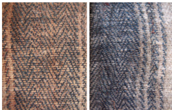
9. Nepoznati slikar, Krštenje Krista , 18. stoljeće, detalji poledine platna (naličje tkanine), Gornje Selo (Šolta), crkva sv. Ivana Krstitelja (fototeka HRZ-a, snimila J. Zagora, 2014.) Unknown artist, The Baptism of Christ, 18th century, details of the canvas back side (fabric reverse), Gornje Selo (Šolta), church of St. John the Baptist (Croatian Conservation Institute Photo Archive, photo by J. Zagora, 2014)

ljeća, uspjela sam pronaći tek jedan primjer slike na prugastom platnu za madrace veza riblje kosti u Italiji. 65 Riječ je o kopiji prema djelu Pijanci ( Los Borrachos , 1628.) Diega Velázquez, naslikanoj vjerojatno u 18. stoljeću, danas u napuljskoj pinakoteci. Ta neobična slika nepoznatog autora izrađena je u temperi na papiru koji je zalijepljen na vrlo gusto platno s plavim horizontalnim prugama, tkano četveroveznom osnovnim povratnim keperom 3/1. 66 Kao primjer korištenja tkanine za izradu madraca i jastuka naziva traliccio u slikarstvu izvan Francuske, napuljsku sliku navodi i Torrioli u svojoj studiji slikarskih platna. 67 Autorica opisuje i zanimljivu sliku Gospa s Djetetom i svecima koju je Niccolò Circignani izradio 1577. godine za crkvu