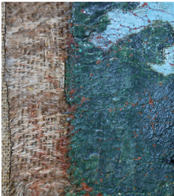
16. Filippo Naldi, Gospa od Karmela i Krštenje Krista , 1761., detalj lica tkanine s teksturom veza riblje kosti, lijevi rub slike, Kostanje, crkva sv. Mihovila Filippo Naldi, Our Lady of Carmen and The Baptism of Christ , 1761, detail of the fabric face with a herringbone pattern, painting left edge, Kostanje, church of St. Michael