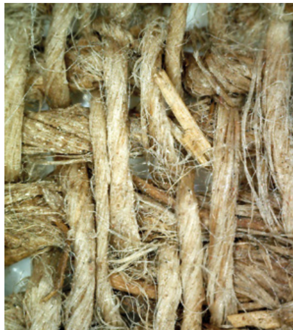
17. Filippo Naldi, Gospa od Ružarija, sv. Jeronim i sv. Roko , 1761., detalj tkanja (lice tkanine, osnova postavljena vertikalno), Kostanje, crkva sv. Mihovila (fototeka HRZ-a, uzorak iz platnoteke Restauratorskog odjela u Splitu, povećanje 50 x, snimila J. Zagora, 2016.) Filippo Naldi, Our Lady of the Rosary, St. Jerome and St. Roche , 1761, detail of the weave (fabric face, warp set vertically), Kostanje, church of St. Michael (Croatian Conservation Institute Photo Archive, sample from the canvas sample archive of the Split Conservation Department, magnification 50x, photo by J. Zagora, 2016)