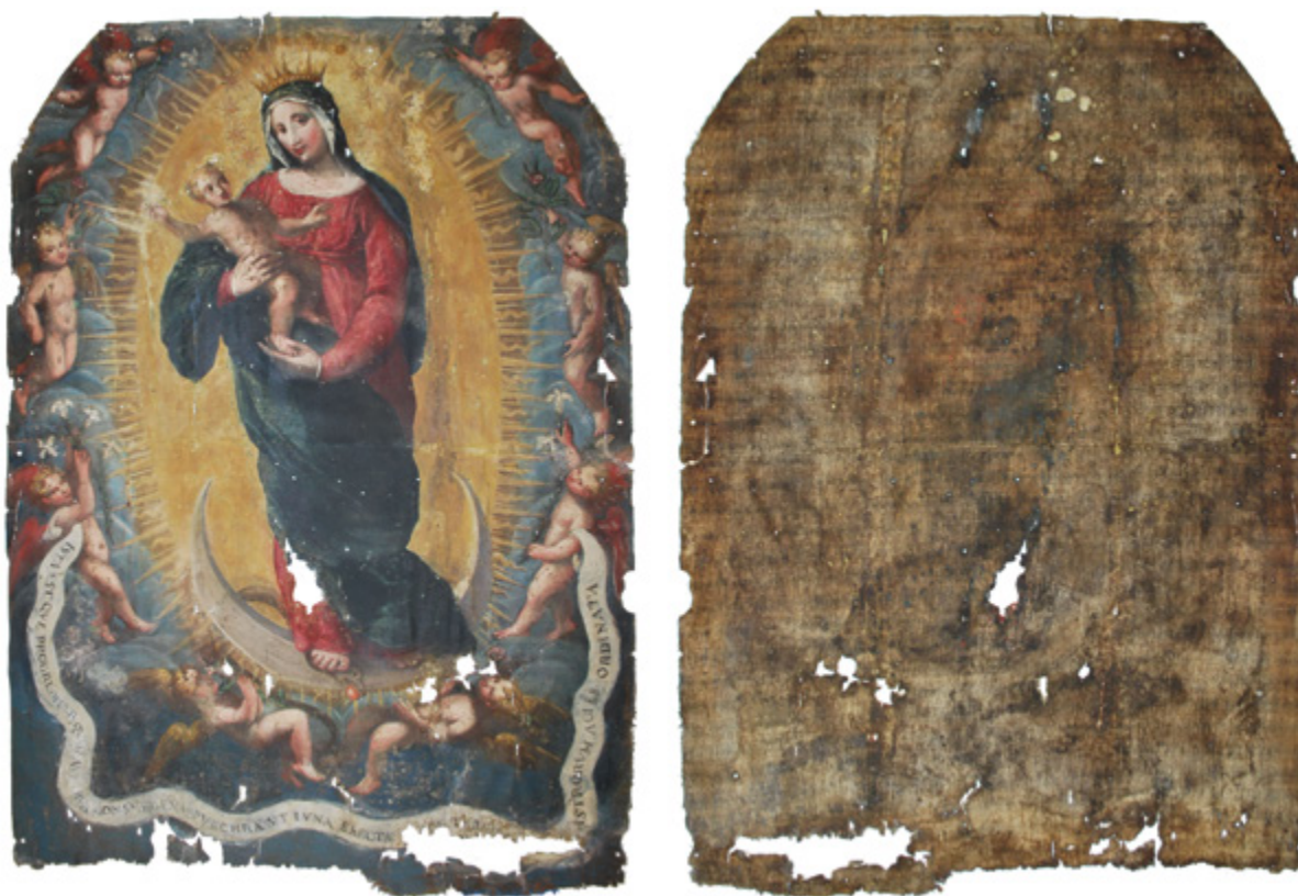
1. Nepoznati slikar, Bogorodica Bezgrešna , 1609., izvorni oslik nakon uklanjanja nekoliko slojeva preslika; poledina platna, Šibenik, crkva sv. Nediljice na predjelu Crnica (fototeka HRZ-a, snimila J. Zagora, 2013.) Unknown artist, The Immaculate Virgin , 1609, original painting after removing several layers of overpaint; back side, Šibenik, church of St. Domenica in the Crnica area (Croatian Conservation Institute Photo Archive, photo by J. Zagora, 2013)