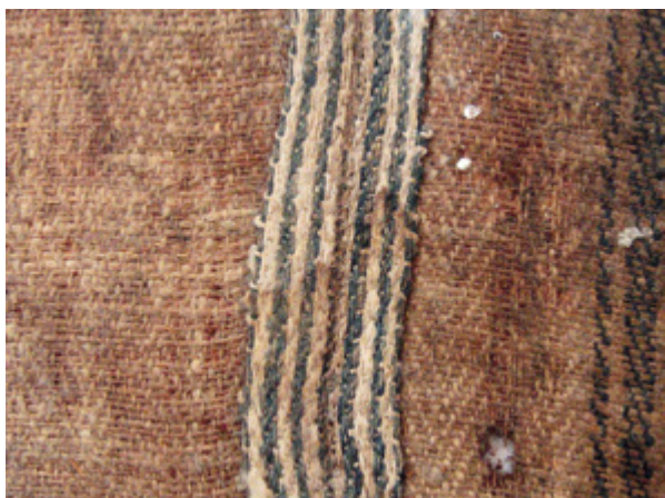
13. Nepoznati slikar, Krštenje Krista , 18. stoljeće, detalj poledine platna s izvornim šavom (živi rubovi), Gornje Selo (Šolta), crkva sv. Ivana Krstitelja Unknown artist, The Baptism of Christ, 18th century, detail of the canvas back side with the original stitch (selvedges), Gornje Selo (Šolta), church of St. John the Baptist