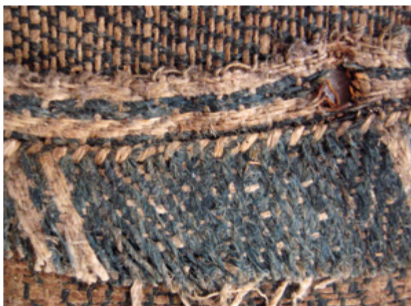
11. Nepoznati slikar, Krštenje Krista , 18. stoljeće, detalj poledine platna s izvornim šavom u vrhu polukružnog završetka (vidi se živi rub i lice tkanine na preklopu - osnova je postavljena u različitim smjerovima), Gornje Selo (Šolta), crkva sv. Ivana Krstitelja

Unknown artist, The Baptism of Christ, 18th century, detail of the canvas back side with the original stitch at the top of the semicircular ending (visible is the selvedge and fabric face at the fold – the warp is set in different directions, Gornje Selo (Šolta), church of St. John the Baptist