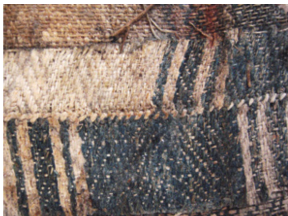
12. Nepoznati slikar, Krštenje Krista , 18. stoljeće, detalj poledine platna (naličje tkanine) s izvornim šavom u predjelu desnog ruba poledine platna (lice tkanine vidi se na preklopima), Gornje Selo (Šolta), crkva sv. Ivana Krstitelja (fototeka HRZ-a, snimila J. Zagora, 2014.)

Unknown artist, The Baptism of Christ, 18th century, detail of the canvas back side with the original stitch at the top of the semicircular ending (visible is the selvedge and fabric face at the fold – the warp is set in different directions, Gornje Selo (Šolta), church of St. John the Baptist (Croatian Conservation Institute Photo Archive, photo by J. Zagora, 2014)