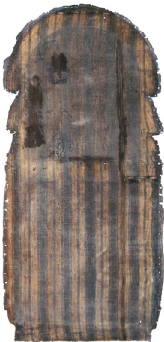
8. Nepoznati slikar, Krštenje Krista , 18. stoljeće, poledina platna tijekom zahvata, Gornje Selo (Šolta), crkva sv. Ivana Krstitelja Unknown artist, The Baptism of Christ, 18th century, back side during the treatment, Gornje Selo (Šolta) church of St. John the Baptist

ljeća, uspjela sam pronaći tek jedan primjer slike na prugastom platnu za madrace veza riblje kosti u Italiji. 65 Riječ je o kopiji prema djelu Pijanci ( Los Borrachos , 1628.) Diega Velázquez, naslikanoj vjerojatno u 18. stoljeću, danas u napuljskoj pinakoteci. Ta neobična slika nepoznatog autora izrađena je u temperi na papiru koji je zalijepljen na vrlo gusto platno s plavim horizontalnim prugama, tkano četveroveznom osnovnim povratnim keperom 3/1. 66 Kao primjer korištenja tkanine za izradu madraca i jastuka naziva traliccio u slikarstvu izvan Francuske, napuljsku sliku navodi i Torrioli u svojoj studiji slikarskih platna. 67 Autorica opisuje i zanimljivu sliku Gospa s Djetetom i svecima koju je Niccolò Circignani izradio 1577. godine za crkvu