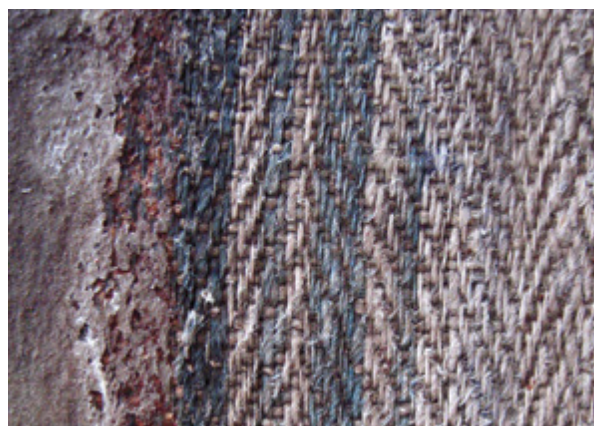
10. Nepoznati slikar, Krštenje Krista , 18. stoljeće, detalj platna (desni rub slike, lice tkanine s izraženom teksturom veza riblje kosti), Gornje Selo (Šolta), crkva sv. Ivana Krstitelja Unknown artist, The Baptism of Christ, 18th century, detail of the canvas (right edge of the painting, fabric face with a distinct herringbone pattern, Gornje Selo (Šolta), church of St. John the Baptist

sv. Franje u mjestu Umbertide (Umbrija). Platno, tkano vezom riblje kosti s tamnoplavim vertikalnim prugama međusobno udaljenim 20 cm, Torrioli je okarakterizirala kao vrlo slično tipu stolnjaka naziva tovaglie perugine , iako bez uvjerljivih argumenata. 68