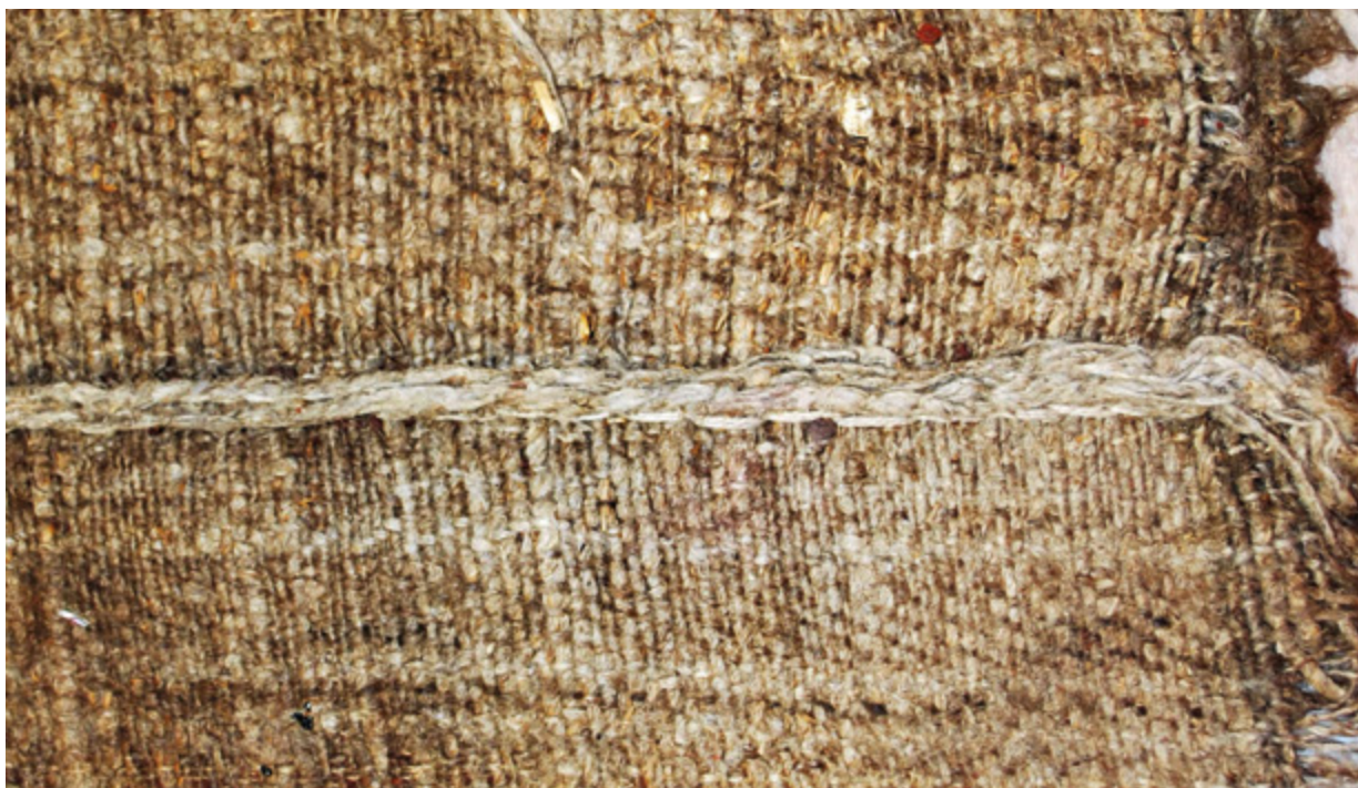
18. Filippo Naldi, Gospa od Karmela i Krštenje Krista , 1761., detalj poledine platna s izvornim šavom, Kostanje, crkva sv. Mihovila Filippo Naldi, Our Lady of Carmen and The Baptism of Christ , 1761, detail of the canvas back side with the original stitch, Kostanje, church of St. Michael