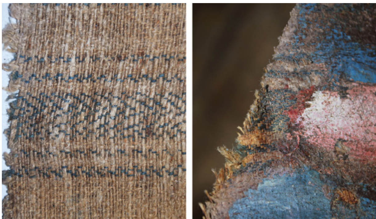
2. Nepoznati slikar, Bogorodica Bezgrešna , 1609., detalj poledine platna (naličje tkanine); detalj platna vidljiv u oštećenju slikanog sloja (lice tkanine), Šibenik, crkva sv. Nediljice na predjelu Crnica Unknown artist, The Immaculate Virgin , 1609, detail of the back side of the canvas (fabric reverse); detail of the canvas visible in the lacuna of the painted layer (fabric face), Šibenik, church of St. Domenica in the Crnica area