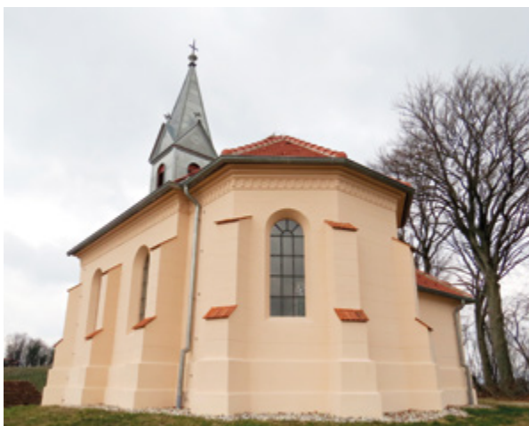
10. Hršak Breg, kapela sv. Antuna Padovanskog, pogled na začelje kapele, stanje nakon radova (fototeka Konzervatorskog odjela u Krapini, 2016.) Hršak Breg, chapel of St. Anthony of Padua, view of the rear of the chapel, after restoration (Photo Archive of the Conservation Department in Krapina, 2016)

replicirati oni povijesni oslici čija se prezentacija kritičkom interpretacijom utvrdi opravdanom.