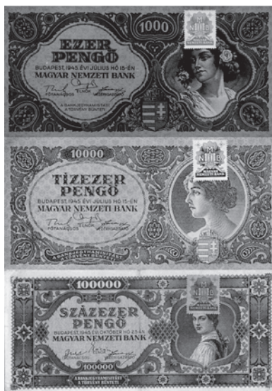
Slika 8. Novčanice od tisuću, deset i sto tisuća penga s markicama, što je bio prvi (zapravo lažni) pokušaj smanjenja broja novčanica u optjecaju.

Vlada je u prosincu 1945. hiperinflaciju pokušala zaustaviti jednim neobičnim postupkom – markiranjem novčanica. Počev od 19. prosinca 1945. uvedene su markice koje su se trebale lijepiti na novčanice od 1000, 10.000 i 100.000 penga, ali na sljedeći način: za jednu markicu trebalo je dati tri novčanice, dakle od četiri novčanice od 1000 penga, trebalo je tri novčanice predati banci, a na četvrtu se lijepila markica te je vraćena vlasniku. Iako je postupkom markiranja ukupna količina novca u optjecaju znatno smanjena, inflacija se zaustavila samo nekoliko dana te se zatim ponovno razbukkala. 30 Naime, vlada nije istodobno poduzela nikakve druge mjere stabilizacije monetarne i fiskalne politike, pa je markiranje novčanica zapravo bila neka vrsta poreza i krajnji cilj nije bio smanjiti količinu novca u optjecaju, nego je vlada na taj način prikupljeni novac iskoristila za privremeno financiranje svojih troškova. 31