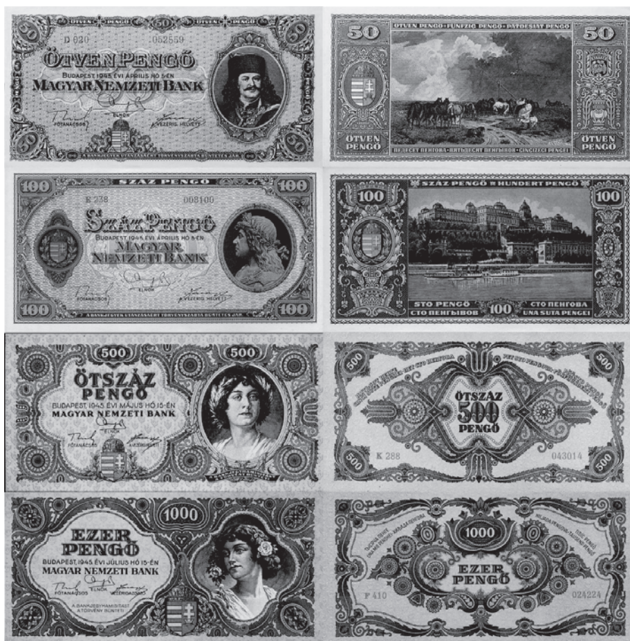
Slika 1. Prve četiri poslijeratne novčanice penga. Prve dvije tek su neznatno modificirane novčanice iz 1926. godine, a druge su dvije nove, posebno dizajnirane i sadržavaju mnogo tradicionalnih mađarskih pučkih motiva (autorova zbirka).

Prva novčanica koja nije sadržavala stvarni povijesni lik bila je novčanica od 1000 penga iz 1927. godine. Na njoj se nalazila ženska glava, dio Kipa slobode iz Arada (danas u Rumunjskoj), koja je simbolizirala Mađarsku ( Hgá ía ). Kip je 1890. godine izradio György Zala na spomen junaka mađarske revolucionarne vojske iz 1848. godine. Od 1939. godine počele su se puštati u optjecaj nove serije novčanica koje više nisu sadržavale portrete poznatih povijesnih ličnosti, no ta je serija sadržala samo apoene od 2, 5, 10 i 20 penga te nema točnih podataka o tome kako su trebale izgledati buduće novčanice od 50 i 100 penga. Budući da su uklonjene povijesne ličnosti s manjih novčanica, vjerojatno bi se takva praksa nastavila i na novčanicama veće vrijednosti, što dokazuju i novčanice od 100 i 1000 penga, koje je pri kraju rata izdala kvislinška vlada Ferenc Szálasiya, a koje također ne sadrže stvarne povijesne likove.