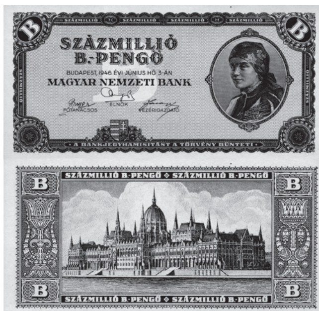
Slika 6. Novčanica s najvećom nominalnom vrijednošću na svijetu – sto milijuna b.-penga, odnosno sto kvadrilijuna penga – bila je posljednja novčanica penga koja je puštena u optjecaj (autorova zbirka).