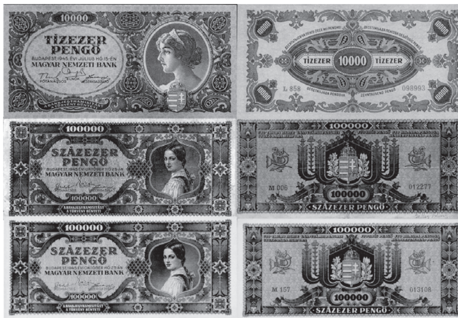
Slika 2. Prve novčanice hiperinflacijskoga razdoblja; ženski likovi umjesto povijesnih i slavni osoba postali su uobičajeni. Lik na novčanicama od 100.000 penga slovačka je djevojka Valéria Rudasová koja se već pojavila na prijeratnoj novčanici od 2 penga.