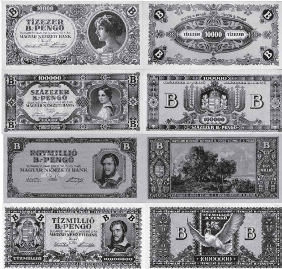
Slika 5. Novčanice b.-penga bile su jednake novčanicama milpenga, ali ponovno s p omijeji ei n b p ama i ddat n m slo m B ik u o ima ili u a k m drgm mjestu na novčanicama.

a u promet su puštene između 1. i 11. srpnja 1946. Novčanica od milijardu b.-penga nije puštena u promet. Novčanica od 100 milijuna b.-penga, odnosno 100 milijuna bilijuna, odnosno 100 kvadrilijuna penga, novčanica je najvećega apoena koja je ikada bila u optjecaju. Novčanica od milijardu b.-penga, koja nije bila u optjecaju, bila je zapravo novčanica od jednoga pentilijuna penga. I te novčanice bile su jednake prethodnima, ali i opet s promijenjenim bojama; osim po nadnevku, te novčanice razlikuju se od prethodne serije i po slovu B koje je radi lakšeg razlikovanja stavljeno u kutove ili na neko drugo mjesto na obje strane novčanica. Te novčanice uopće više nisu imale serijske brojeve. Zamjećujemo da na novčanicama nisu promijenjeni mađarski grbovi, odnosno, zadržani su grbovi kakvi su bili na novčanicama običnoga penga, pa čak i oni grbovi s krunom. Brzina kojom su tiskane novčanice sve većih apoena po svemu sudeći nije dozvoljavala veće zahvate, ili pak to u posljednjim turbulentnim tjednima hiperinflacije nije smatrano bitnim.