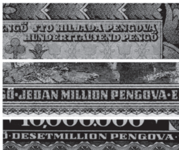
Slika 10. Natpisi na (kvazi)hrvatskom jeziku na novčanicama: „sto hiljada pengova”, „jedan million pengova” i „desetmillion pengova” (autorova zbirka).

Ta se lingvistička zbrka može objasniti na dva načina. Uoči Prvog svjetskog rata u Mađarskoj je živjelo 285.582 Hrvata, 32 ali je njihov broj gubitkom dijelova Bačke i Baranje znatno smanjen. Prema Bunjevačkim i šokačkim novinama iz 1924. godine u Mađarskoj je u to vrijeme živjelo oko 70.000 Bunjevaca i Šokaca. 33 Zbog različitih oblika pritisaka broj Hrvata postupno se smanjivao, a počev od 1945. godine Hrvati su se (prisilno) okupljali u sklopu službene državne organizacije pod nazivom Demokratski savez Južnih Slavena, u kojem je službeni jezik bio „srpsko-hrvatski” (szerb-horvát), katkad nazivan „južnoslavenskim jezikom” (del-szláv nyelv). 34 Budući da su neki srpsko-hrvatski jezik smatrali jednim jezikom koji se pisao dvama pismima, vjerojatno je odlučeno da natpisi budu istovjetni. Takva jednakost, međutim, nije potpuno provedena (primjerice u riječi „million”), vjerojatno zbog brzine kojom su novčanice trebale biti pripremljene, ali i zbog neznanja i nemara dizajnera novčanica. Možda da su dizajneri i kontaktirali s nekim iz Demokratskoga saveza Južnih Slavena (a to je mogao biti netko bilo koje od jugoslavenskih nacionalnosti) te su dobili pogrešne upute ili su ih pak pogrešno razumijeli. Na žalost, nije poznato tko je bio zadužen za pripremu natpisa na novčanicama te se ova zagonetka za sada ne može razjasniti.