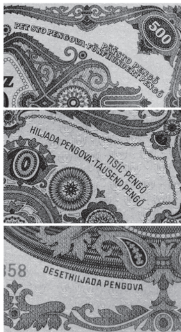
Slika 9. Natpisi na (kvazi)hrvatskom jeziku na novčanicama: „pet sto pengova”, „hiljada pengova” i „desethiljada pengova” (autorova zbirka).