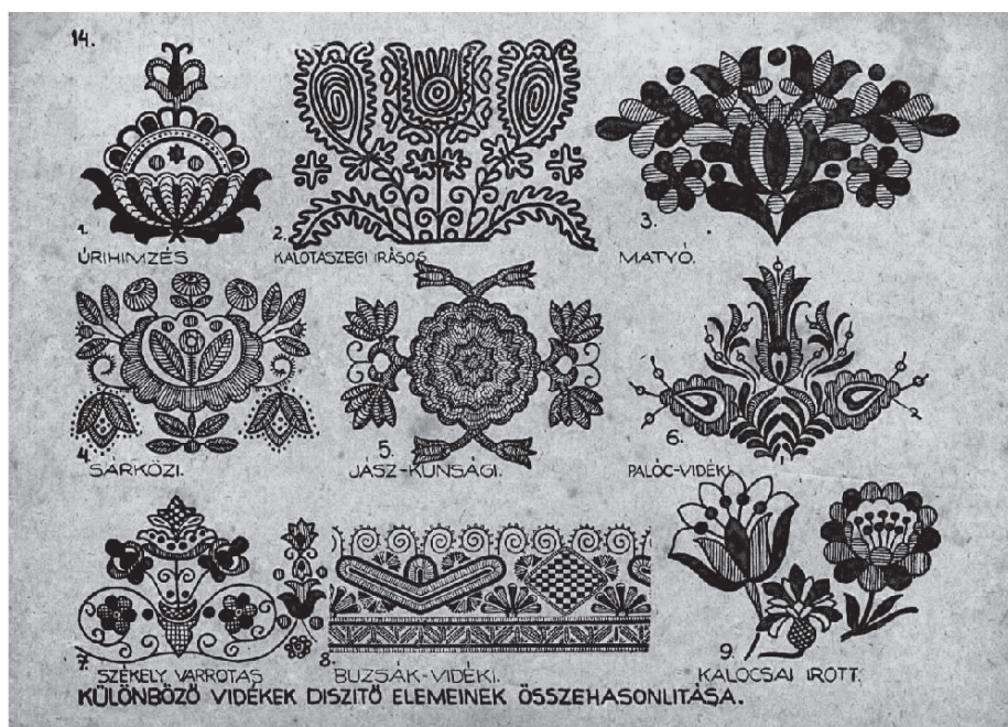
Slika 13. Tradicionalni mađarski pučki motivi iz raznih pokrajina koji su dizajneru novčanica Endreu Horváthu bile inspiracija za ornamente na novčanica penga ( www.hungarianfolk.com/hungarian-folk-motifs ).

novčanica prestaje važiti na dan naveden na prednjoj strani. Nakon isteka roka važenja poreznih novčanica ne mogu se vršiti nikakva potraživanja prema Državnoj riznici. 41