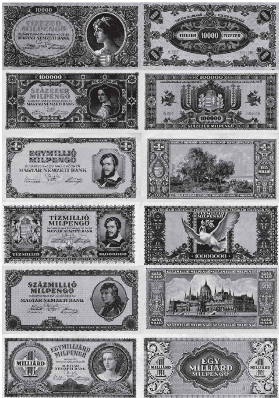
Slika 4. Novčanice milpenga bile su jednake kao dotadašnje novčanice, ali s promijenjenim bojama.