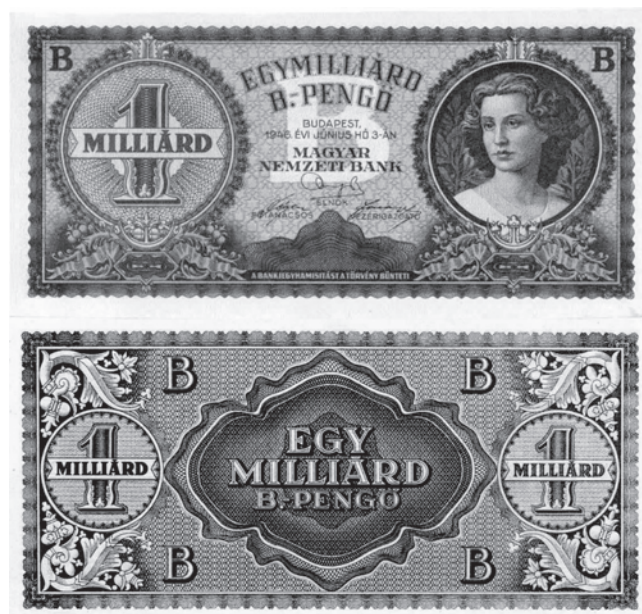
Slika 7. Novčanica od milijarde b.-penga, odnosno pentilijun penga, bila je otisnuta, ali nije puštena u optjecaj.