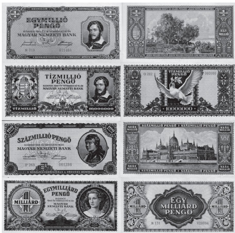
Slika 3. Novčanice od jednog, deset i stotinu milijuna penga, te jedne milijarde penga. Na prve dvije novčanice nalazi se Lajos Kossuth, a na druge dvije nepoznati ženski likovi; prva novčanica gotovo je nepromijenjena novčanica od 20 penga iz 1926., a treća je gotovo nepromijenjena novčanica od 10 penga iz iste godine, samo je umjesto lika Ferenc Deáka stavljen lik djevojke-seljanke.

originalne tiskarske ploče za novčanice penga drugoga prijeratnoga izdanja. 19 Zato se, prema svemu sudeći, u prvo vrijeme nova vlada morala poslužiti starijim tiskarskim pločama prvoga izdanja penga jer je počelo nedostajati izvornoga mađarskoga novca, a nove novčanice nisu se mogle toliko brzo pripremiti.