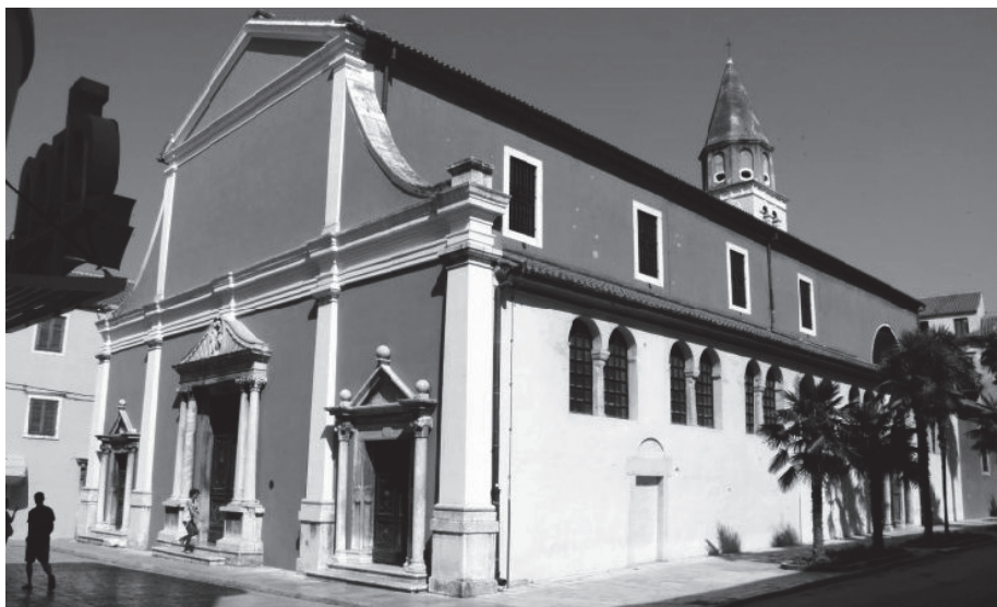
Crkva sv. Šimuna (sv. Stjepana) u Zadru, danas

zlatarstva, a u njoj je pohranjena svečeva relikvija. Izradu škrinje milanskom je zlataru Franji, prema sačuvanom ugovoru iz 1377. godine, povjerila hrvatsko-ugarska kraljica Elizabeta, kći bosanskoga bana Stjepana Kotromanića i žena kralja Ludovika Velikog Anžuvinca. U škrinji se čuvaju vrlo vrijedni zavjetni darovi iz različitih povijesnih razdoblja, a najvrjednija je kraljičina kruna, izniman gotički zlatarski i draguljarski rad. Južno od crkve nalazi se rimski stup postavljen 1729. godine, a sastavljen je od dvaju stupova gradskoga hrama koji su se do tada sačuvali na kapitoliju na Forumu.