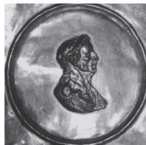
3 G. Julius Caesar