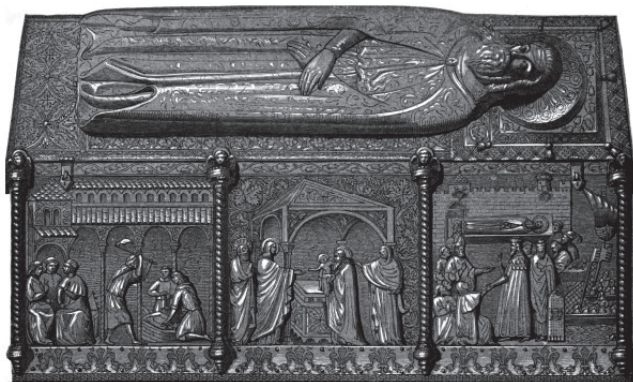
Š rij a sv.Š ma iZ adru