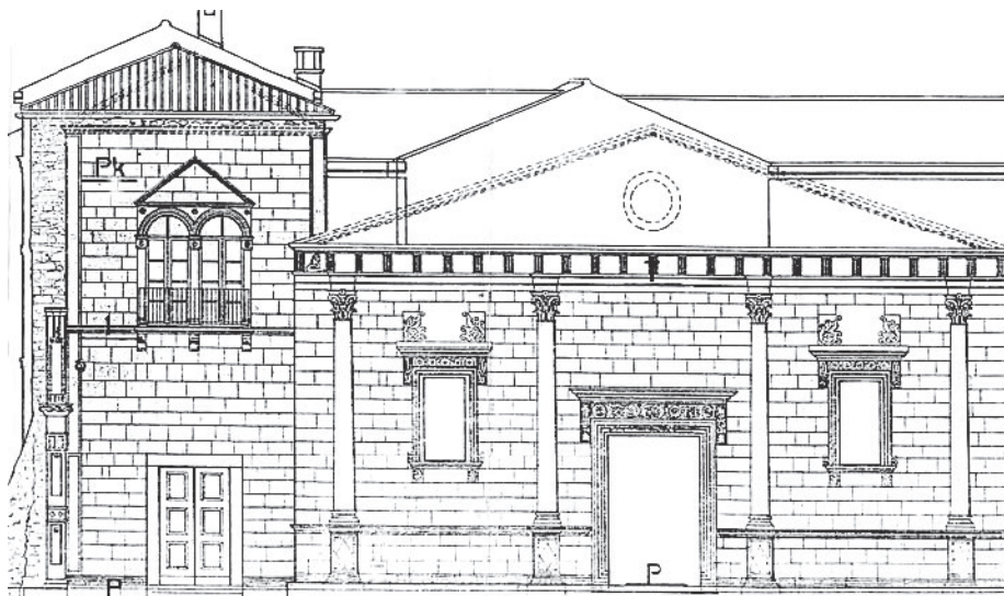
Rekonstrukcija pročelja nedovršene crkve sv. Šimuna