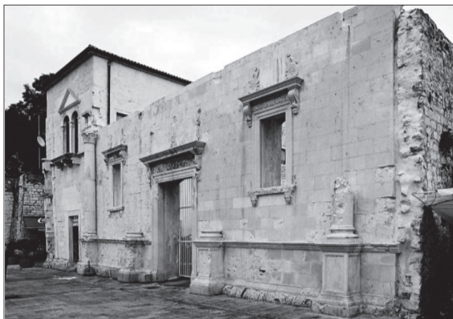
Pročelje nedovršene crkve sv. Šimuna, danas