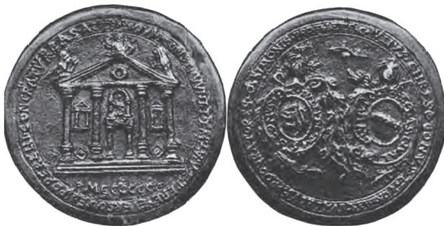
Medalja povodom izgradnje crkve sv. Šimuna u Zadru, 1600. - V 705.