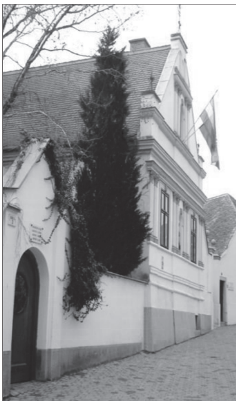
Slika 1. Zgrada Hrvatskoga kluba u Pečuhu

U nas (u Mađarskoj) tog su važnog hrvatskoga pjesnika i pisca nazvali hrvatskim Jókaiem ( Mór Jókai bio je slavni mađarski romanopisac i dramatičar, 1825.-1904. - op. prev. ) zbog njegovih uspješnih romantičnih povijesnih romana. Šenou drže i utemeljiteljem hrvatskoga feljtona. Važnu je ulogu imao i kao jezikotvorac, a važni su i njegovi prevodi raznih djela na hrvatski jezik.