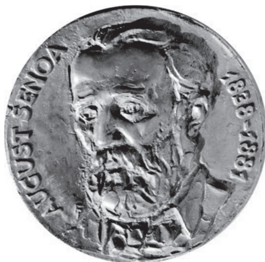
Slika 3. Spomen-medalja Augusta Šenoe

Za tu svečanu prigodu Pál Farkas izradio je i spomen-medalju s likom Šenoe 4 (slika 3.).