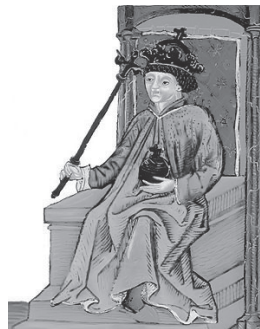
Andrija III. Mlečanin (1290.–1301.)