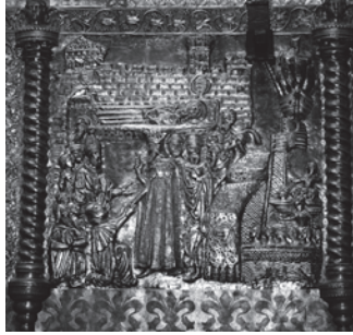
Ludovik I. Anžuvina 1358. ulazi u Zadar. Prizor na škrinji sv. Šimuna u Zadru

Budući da je postigao mnoge uspjehe na unutarnjem i vanjsko-političkom polju, s p avom je dobio nadimak Ludovik I. Veliki. Umro je godinu dana nakon mira u Torinu, 10. IX. 1382. Na mađarskom prijestolju naslijedila ga je starija kći Marija, a na poljskom mlađa kći Jadviga.