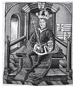
Ludovik I. Veliki (1342.–1382.)