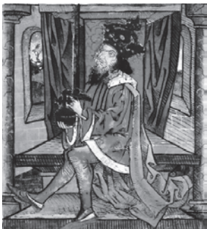
Ladislav IV. Kumanac (1272.–1290.)