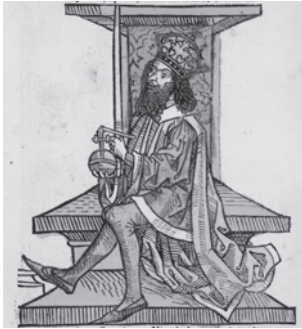
Andrija II. (1205.–1235.)

No uskoro, 1295. godine kuga je pokosila Karla Martela pa je papa Bonifacije VIII. odredio njegova sina Karla Roberta za budućeg ugarsko-hrvatskoga kralja. Pavao Šubić tada je otvoreno stao na stranu Karla Roberta Anžuvince jer je preko njegove majke Marije iz dinastije Arpad bio njegov rođak.