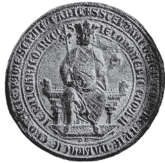
Stjepan V. (1270.–1272.)