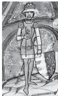
Karlo I. Robert (1301.–1342.)