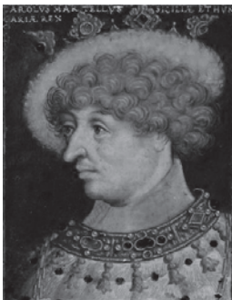
Karlo Martel (umro 1295.)