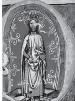
Bela IV. (1235.–1270.)