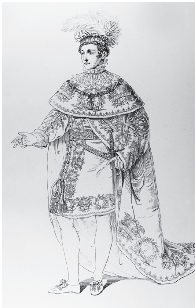
Slika 10. Ornat viteza 1. stupnja carskoga austrijskog Reda željezne krune.

Prvom Statutu (iz 1816. godine) dodano je s godinama nekoliko novih zakonskih odredbi, koje su uvrštene u Dodatke ( Nachtragen , odnosno Suplementi ).