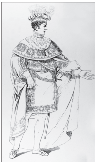
Slika 16. Ornat viteza 2. stupnja carskog austrijskog Reda željezne krune.