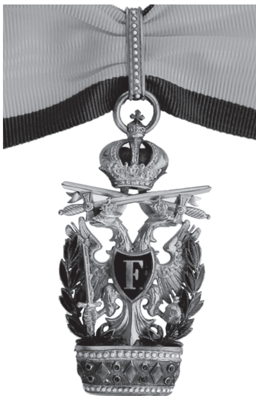
Slika 14. Austrijski carski Orden željezne krune 2. stupnja s ratnom dekoracijom i mačevima.