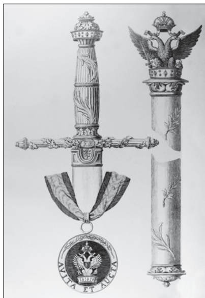
Slika 19. Mač vitezova Reda, medalja službenika Reda i štap herolda Reda.

Trećim dodatkom Statutu od 24. svibnja 1877. određeno je da se ordenska zvijezda ubuduće izrađuje od srebra u „briljantiniranom” obliku ( in brillantierter Form ). Prije toga ordenske zvijezde bile su izrađene također od srebra, ali s ispupčenim i glatkim krakovima (vidi sliku 8.). Najranije zvijezde bile su izvezene.