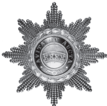
Slika 13. Zvijezda austrijskoga carskog Ordена željezne krune 1. stupnja s ratnom dekoracijom 2. ili 3. stupnja.