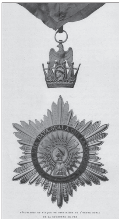
Slika 2. Znakovi Dostojanstvenika velikoga križa francuskog Ordена željezne kruna.

Najviši stupanj reda - Dostojanstvenika velikoga križa ( Gran Dignitario ili Dignitaires Grand-croix ) sastoji se od ordenskog znaka, koji se nosio na lentici ispod vrata. Ordenski znak ima oblik zlatnoga francuskoga carskog orla koji drži srebrnu krunu sa šiljcima. Dakle, nije na njemu langobardska Željezna kruna. Na središnjoj dva šiljka krune položen je ovalni medaljon s glavom cara Napoleona, okrenutom ulijevo. Careva glava ovjenčana je zeleno emajliranim lovorovim vijencem. Na dnu krune kruži geslo na talijanskom: „DIO ME LA DIEDE, GUAI A CHI LA TOCCHERA”, ili na francuskom jeziku: „DIEU ME L’A DONNÉE, GARE À QUI LA TOUCHERA” (Bog mi ju je dao 4 , neka se čuva tko je dirne), ovisno o tome je li odlikovana osoba talijanski ili francuski državljanin. 5 Geslo je čuvena Napoleonova fraza koju je izrekao prilikom krunjenja za kralja Italije u Milanu 26. svibnja 1805.