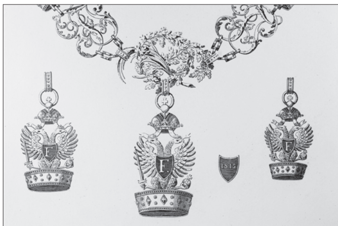
Slika 7. Ordenski znakovi 1., 2. i 3. stupnja austrijskoga carskog Ordена željezne krune.