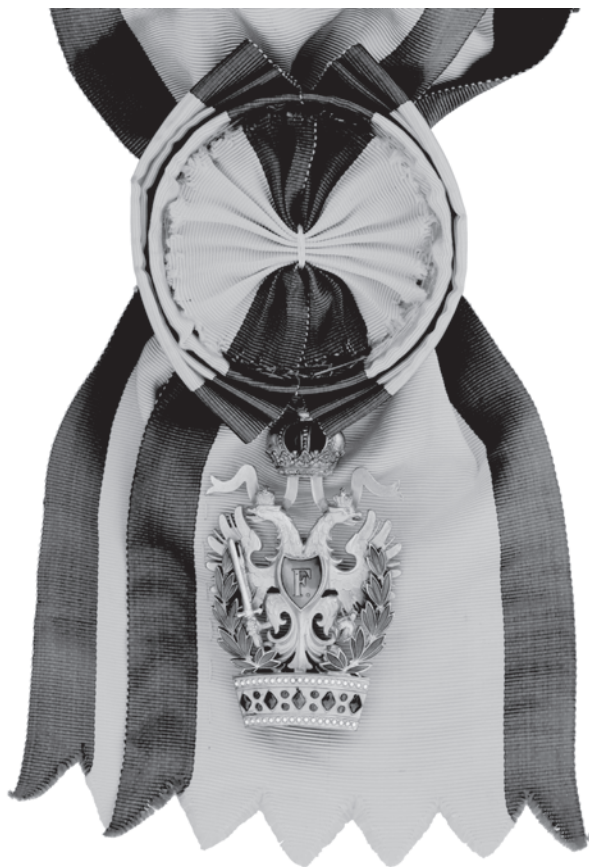
Slika 11. Austrijski carski Orden željezne krune 1. stupnja s ratnom dekoracijom.