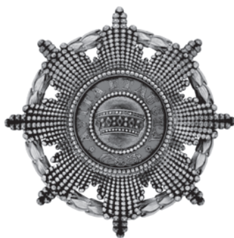
Slika 12. Zvijezda austrijskoga carskog Ordена željezne krune 1. stupnja s ratnom dekoracijom.