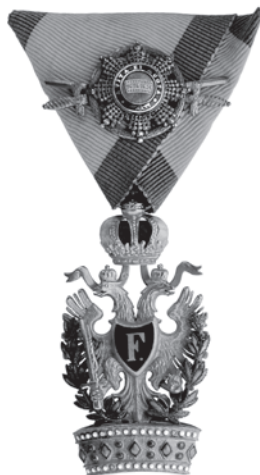
Slika 20. Mala dekoracija austrijskoga carskog Ordена željezne krune 1. stupnja s ratnom dekoracijom i mačevima.

U petom dodatku Statuta navodi se da je 23. ožujka 1908. propisano nošenje „male dekoracije” ( kleine Dekoration ) za Orden željezne krune 1. stupnja. Mala dekoracija ordena 1. stupnja ima oblik ordena 3. stupnja, s umanjenom zvijezdom (promjera 20 mm) pričvršćenom na trokutastu vrpču (slika 20.). Ta se mala dekoracija nosila umjesto originalnih ordenskih znakova na bojnom polju i tijekom vojnih manevara, iz praktičnih razloga. Mala dekoracija za Orden željezne krune 2. stupnja propisana je 27. listopada 1917. Na trokutastu vrpču ordenskog znaka 3. stupnja pričvršćena je umanjena Željezna kruna.