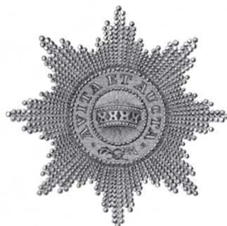
Slika 9. Crtež zvijezde austrijskoga carskog Ordена željezne krune, koja je bila u uporabi poslije 1877. godine.