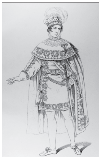
Slika 18. Orden željezne krune 2. stupnja s ratnom dekoracijom 3. stupnja.

Isto tako, osoba odlikovana Ordenom željezne krune 2. stupnja mogla je kasnije dobiti Orden željezne krune 3. stupnja s ratnom dekoracijom. U tom slučaju zeleno emajlirane ratne dekoracije na ordenskom znaku položene su uz središnji štiti (vidi sliku 18.).