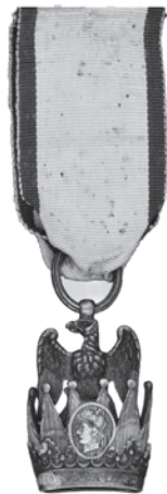
Slika 5. Znak Viteza francuskog Ordена željezne krune, 2. model.

Kasniji modeli francuskog Ordена željezne krune razlikuju se na prvi pogled od prethodnih modela izvedbom šiljaka krune na ordenskom znaku. Naime, drugi model krune nosi kuglice na vrhovima šiljaka. Sličnu promjenu pretrpio je i Napoleonov Orden Legije časti, koji je dobio kuglice na vrhovima rascijepljene zvijezde ordenskoga znaka.