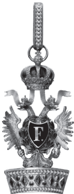
Slika 15. Austrijski carski Orden željezne krune 2. stupnja s ratnom dekoracijom 3. stupnja.