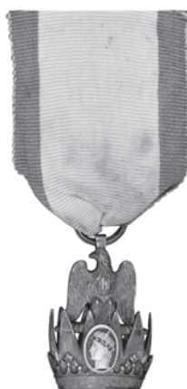
Slika 4. Znak Viteza francuskog Ordena željezne krune, 1. model.

Vitezovi su nosili srebrni ordenski znak na lijevoj strani grudi, na uskoj vrpici (bez rozete).