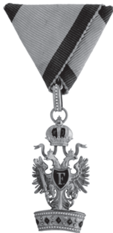
Slika 17. Orden željezne krune 3. stupnja.

Nositelj ranije dodijeljenog Ordena željezne krune 1. stupnja, mogao je kasnije biti odlikovan i za (vojne) zasluge Ordenom željezne krune 2. ili 3. stupnja s ratnom dekoracijom. U tom slučaju odlikovana osoba dobila bi ordenski znak na lenti, sa zvijezdom, kao i ranije. Ordenski znak 1. stupnja s ratnom dekoracijom 2. ili 3. stupnja jednak je mirnodopskom ordenskom znaku 1. stupnja. Razlika je vidljiva tek na zvijezdi, gdje su zeleno emajlirane ratne dekoracije položene uz središnji štiti (vidi sliku 13.).