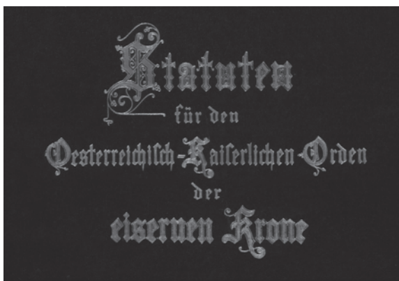
Slika 6. Statut austrijskog carskog Reda željezne krune (detalj)

Statut je dragocjen izvor podataka o Redu željezne krune i mislimo da će njegov prijevod biti zanimljiv čitateljima. Arhaični stil izlaganja svjedoči o duhu vremena prije dvjesto godina i pokušali smo ga slijediti što je više moguće.