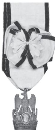
Slika 3. Znak Komandera francuskog Ordena željezne krune.

Komanderi su nosili zlatni ordenski znak na lijevoj strani grudi, na uskoj vrpici s rozetom.