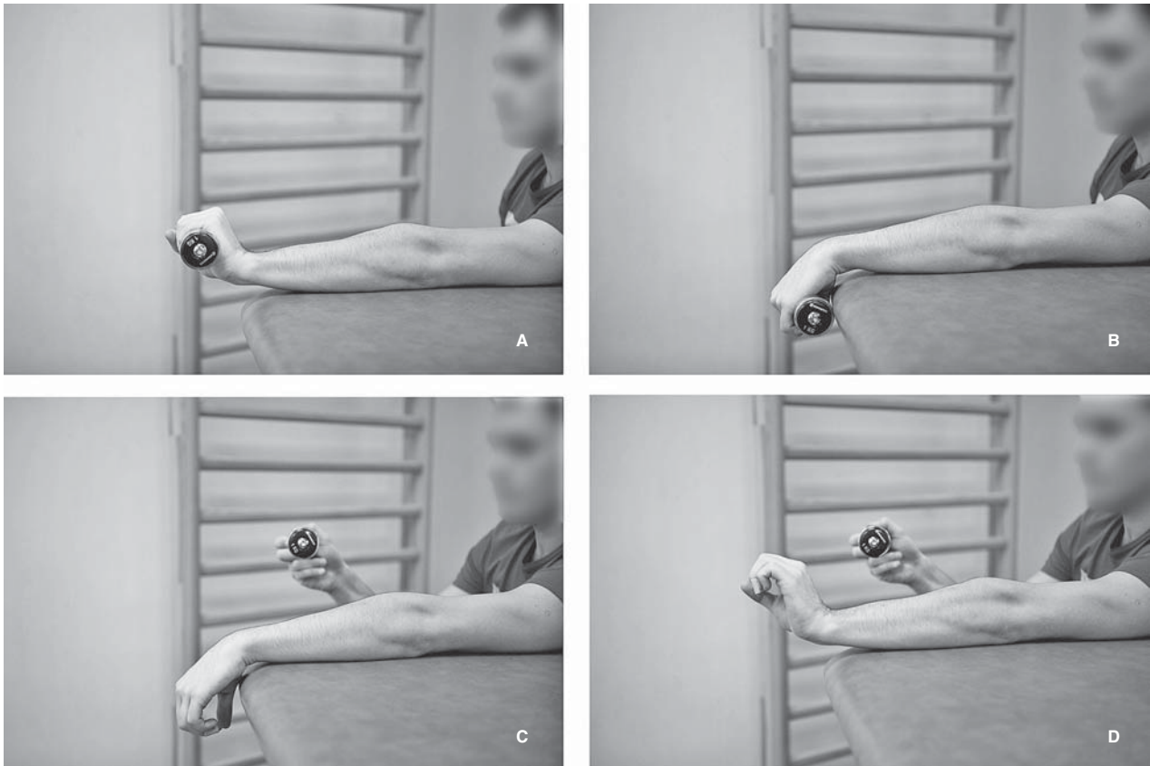
Slika 3. Prikaz izvođenja ekscentrične vježbe u liječenju lateralnog epikondilitisa. A) Osoba sjedi pokraj stola tako da je ruka koja se liječi zbog lateralnog epikondilitisa, u ovome slučaju lijeva, potpuno ispružena u laktu i oslonjena na stol. Ruka je u položaju pune pronacije, a ručni je zglob u položaju maksimalne ekstenzije, dok je uteg čvrsto stisnut u šaci. B) Iz tog se položaja ručni zglob savija prema dolje, tj. čini se palmarna fleksija šake. To je spuštanje ekscentrična faza vježbe pa je od iznimne važnosti da se ta kretanja izvede vrlo polako, tj. da traje najmanje 4 do 5 sekundi. C) U trenutku kad se dostigne najveća moguća palmarna fleksija šake, osoba drugom, slobodnom rukom prihvaća uteg te ga izvuče iz šake ruke kojom čini ekscentričnu vježbu. D) Nakon što se u ruci koja se liječi zbog lateralnog epikondilitisa više ne nalazi uteg, osoba ekstendira ručni zglob te se na taj način ručni zglob vraća u početni položaj. Ovaj dio ekscentrične vježbe nije potrebno izvoditi polako.

Figure 3. Eccentric exercises for the treatment of lateral epicondylitis. A) The person is sitting by the table, with the arm being treated for lateral epicondylitis, in this case the left one, fully extended in the elbow and on the table. The arm is fully pronated, with the wrist in maximum extension and the person is holding the weight tightly in the fist. B) From that position the person lowers the fist i.e. palmar flexion is done. This lowering is the eccentric phase of the exercise so it is of utmost importance that it is done very slowly, for at least 4 or 5 seconds. C) When the maximal palmar flexion is achieved, the person reaches for the weight with the other, free hand and takes the weight from the arm with which he does the eccentric exercise. D) After the arm being treated for lateral epicondylitis is weight-free, the person does wrist extension, so that the wrist is raised to the start-ing position. For this part of the eccentric exercise it is not important to do it slowly.