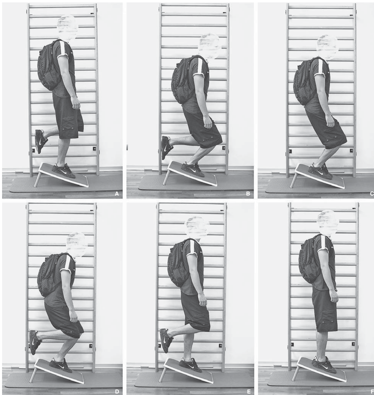
Slika 1. Prikaz izvođenja ekscentrične vježbe u liječenju skakačkog koljena. A) Osoba stoji uspravno na kosoj platformi, i to na nozi koja se liječi zbog skakačkog koljena, u ovome slučaju desnoj. Druga, »zdrava« noga, u ovome slučaju lijeva, treba pritom biti odignuta od podloge i na nju se ne oslanja. Ruke trebaju biti prislunjene uz tijelo, a leđa izravnana. B) Vrlo polaganim spuštanjem valja doći u položaj u kojem natkoljenica i potkoljenica čine pravi kut. To je spuštanje ekscentrična faza vježbe te je od iznimne važnosti da se ta kretanja izvodi vrlo polako, tj. da traje najmanje 4 do 5 sekundi. C) Nakon što dosegne položaj u kojem natkoljenica i potkoljenica bolesne noge čine pravi kut, valja spustiti zdravu nogu na podlogu tako da su u jednom trenutku obje noge na podlozi i da su pritom obje savijene u koljenu pod pravim kutom. D) U trenutku dok su obje noge na podlozi, čitavu tjelesnu težinu valja prebaciti na zdravu, u ovome slučaju lijevu nogu, a nogu koju liječi zbog skakačkog koljena valja podići s podloge. E) Potom se samo na zdravoj nozi podiže u uspravni položaj tako da je zdrava noga na kraju pokreta potpuno ispružena u koljenu. To se podizanje ne mora izvoditi polako. F) Na kraju ponovno na podlogu spušta nogu koju liječi zbog skakačkog koljena, u ovome slučaju desnu, te na nju prebacuje čitavu tjelesnu težinu i time započinje nova ekscentrična vježba.

Figure 1. Eccentric exercises for the treatment of jumper's knee. A) The patient is standing on the board, on a single leg, the one being treated for jumper's knee, in this case the right leg. The posture is an upstraight position with the hands always by the side. B) After very slow descending on the single leg, the position in which the knee is in 90° flexion, is achieved. Descending is the eccentric phase of the exercise so it is of utmost importance that this part of exercise is done very slowly in such way that it lasts for at least 4 seconds. C) After the position, in which knee is in 90° flexion, is achieved, the other healthy leg is lowered on the board so that at one moment both legs are on the board, while both knees are flexed at 90°. D) While both legs are still on the board, full body weight is transferred on the healthy leg, in this case the left one and the leg being treated for jumper's knee is raised from the board. E) The person raises to the upright position only on the healthy leg, so that it is straight in the final position. Ascending doesn't have to be done slowly. F) The leg that's being treated for jumper's knee is again lowered on the board and the full body weight is being transferred on it and so begins a new eccentric exercise.