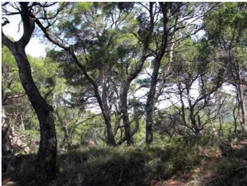
Figure 1. Forests of aleppo pine ( Pinus halepensis Mill.)

Slika 1. Šume alepskog bora ( Pinus halepensis Mill.)