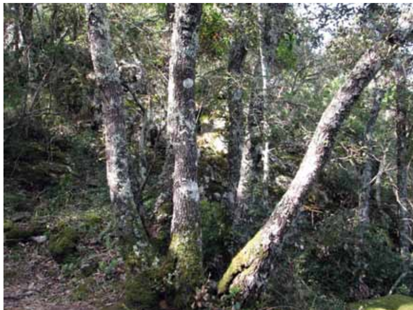
Figure 2. Forests of holm oak ( Quercus ilex L.)

Značajne površine zauzimaju i trajni stadiji razvijeni u obliku makije. Makija somine i tršlje ( Pistacio lentisci-Juniperetum phoeniceae Trinajstić 1987) zauzima na Mljetu vrlo velike površine, a razvija se kao progresivni stadij nakon šumskih požara ili nakon prestanka paše. U Parku se nalazi na više mjesta uz Veliko i Malo jezero te na padinama Gloga. Zajednica velikog vrijesa i planike ( Erico arboreae-Arbutetum unedonis Allier et Lacoste 1980) je na otoku Mljetu proučavana na lokalitetu Sikirica na području Parka, gdje je neposredno iznad obale otkrivena jedna njena manja sastojina, dok vegetacija bušika (gariga) zauzima razmjerno male površine. Zajednica Erico manipuliflorae-Calycotometum infestae (H-ić-1958) na otoku Mljetu zauzima razmjerno velike površine, ali je postupno obrašćuje alepski bor ( Pinus halepensis ).