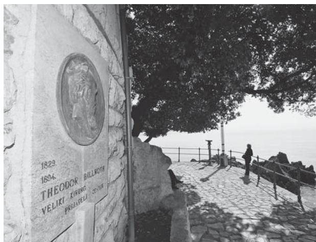
Slika 2. Spomen-ploča prof. Theodoru Billrothu na opatijskom šetalištu Lungomare Figure 2. Memorial plaque of Prof. Theodore Billroth on Opatija seaside promenade Lungomare

za počasnog člana Zbora liječnika Hrvatske. Schwerdtnerov reljef Billrotha iz 1907. s natpisom Dem großen Arzt und Förderer des Kurortes («Velikom liječniku i unapreditelju lječilišta»), uništen je za vrijeme Drugoga svjetskog rata, a nova Dolinarova spomen-ploča postavljena je 1965. s natpisom: »Veliki kirurg i prijatelj Opatije«, nekoliko metara južnije na zid crkvice sv. Jakova (slika 2).