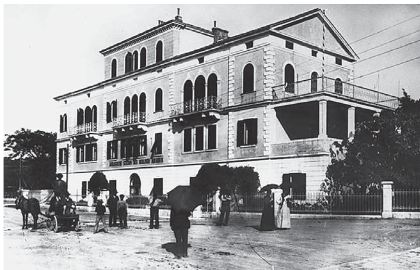
Slika 3. Rovinjski institut – Centar za istraživanje mora kojemu je gostujući znanstvenik bio Rudolf Virchow Figure 3. Rovinj institute – Centre for Marine Research where Rudolf Virchow was a guest scientist

Prof. dr. Robert Koch (Clausthal, 11. 12. 1843. – Baden-Baden, 25. 5. 1910.) njemački je bakteriolog. 1882. otkrio je uzročnika tuberkuloze koji je po njemu nazvan Kochov bacil. Također je pronašao uzročnike kolere (1883.), ispitivao malariju i afričku bolest spavanja te uveo liječenje kininom. Godine 1905. dodijeljena mu je Nobelova nagrada za medicinu. 14 Na poziv austrijskog industrijalca Paula Kupelweisera, koji je 1893. kupio Brijune i kasnije ih pretvorio u mondni turistički centar, stigao je sa suradnicima 1900. i 1901. i suzbio epidemiju malarije na Brijunima. 15 Ta metoda liječenja prenijeta je na istarsko kopno i otoke Cres i Lošinj. Kochov mikroskop, koji je upotrebljavao pri otkrivanju uzročnika malarije u krvi bolesnika na otoku, danas se nalazi u Muzeju na Velom Brijunu (slika 4). U znak zahvalnosti Paul Kupelweiser na otoku mu je podigao spo-