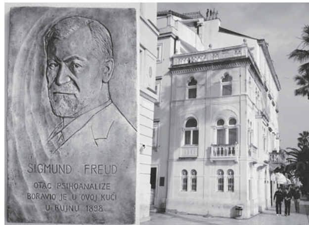
Slika 6. Spomen-reljef prof. Sigmundu Freudu na »neomaurskoj kući« na Rivi u Splitu gdje je stanovao u rujnu 1898. godine

Figure 5. The relief in memory of Robert Koch in honour for eradication of the malaria plague from the Brijuni islands