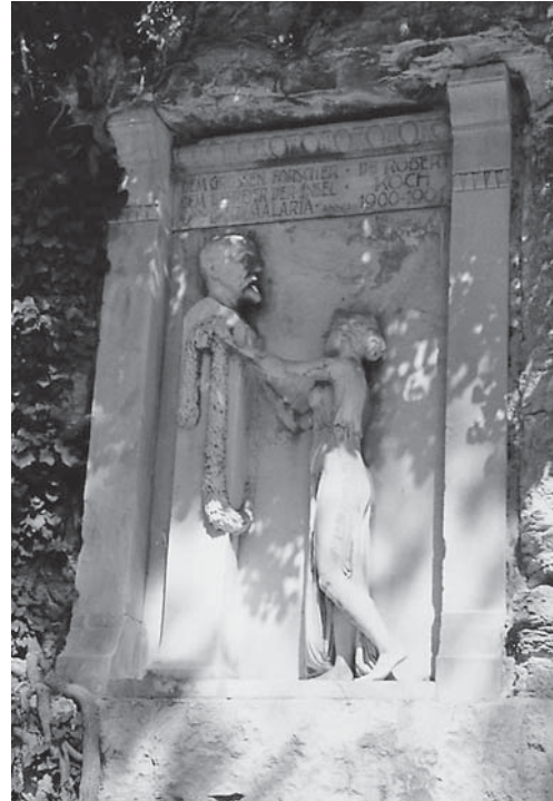
Slika 5. Spomen-obilježje prof. Robertu Kochu u znak zahvalnosti za suzbijanje malarije na Brijunima

Prof. dr. Leopold Schrötter Ritter von Kristelli (Graz, 5. 2. 1837. – Beč, 22. 4. 1908.), austrijski je laringolog i internist. U Beču je osnovao prvu Katedru za laringologiju 1868.,