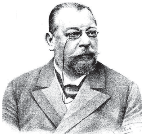
Slika 1. Prof. Julius Glax, europski balneološki autoritet, popularizirao Opatiju kao europsko morsko klimatološko lječilište krajem 19. stoljeća Figure 1. Prof. Julius Glax, European balneological authority, who popularized Opatija as a European marine climatological health resort at the end of the 19 th century