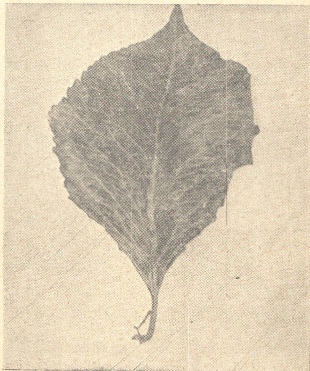
Žučenje nervature na sorti Dielova

Mosaik kruške proširen je skoro po cijeloj Evropi. Još 1935. g. ustanovio ga je Christoff (3) u Bugarskoj. Do sada je konstatiran u Njemačkoj (6), Holandiji (5), En-