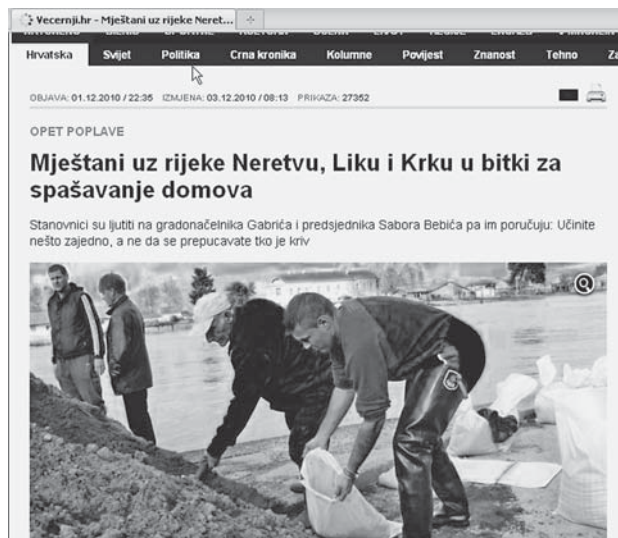
Slika 2. »Opet poplave«, Večernji list 1. 12. 2010., internetsko izdanje Figure 2. »Come back of flooding«, Večernji list december 1, 2010, on-line edition