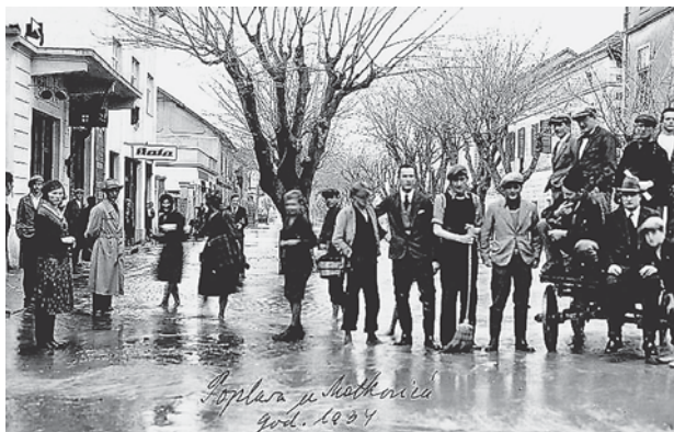
Slika 1. Poplava u Metkoviću 1934., preslik fotografije, autor nepoznat Figure 1. Flooding in Metkovic 1934 th , copy of the photograph, author unknown

vode do samog središta Metkovića bila je očekivana i uobičajena, gotovo redovita pojava, sve do danas (slika 1).