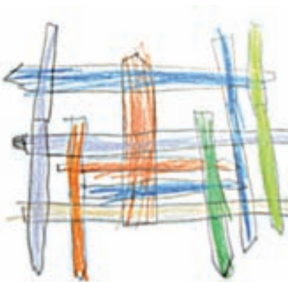
Svaki zapis koji može pomoći u razumijevanju nekog procesa ima veliki pedagoški potencijal

da razumiju snimljeno te u tom smislu svrha dokumentacije nije prikaz nego objašnjenje (Forman i Fyfe, 1998.). Sam etnografski zapis omogućuje prikaz nekog segmenta, odnosno prikaz 'produkta', dok dokumentacija pokazuje proces. Razlika između prikaza (etnografskog zapisa) i dokumentacije upravo je u objašnjenju onoga što je na prikazu. U tom smislu je svakom etnografskom zapisu potrebna interpretacija kako bismo ga mogli kvalificirati kao dokumentaciju. Dakle, baš svaki zapis koji može pomoći u razumijevanju nekog procesa, a koji je pritom kontekstualan i kvalitetno interpretiran, ima veliki pedagoški potencijal – odnosno time on postaje dokumentacija. Hoće li taj pedagoški potencijal biti iskorišten ovisi o mnogim faktorima, među ostalim i o vještinama onih koji ga koriste. Prema tome, kako bi zapis postao dokumentacija i bio u pedagoškom smislu iskoristiv, potrebno