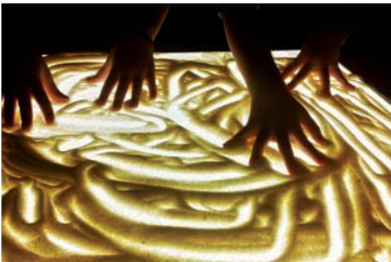
U istraživačkom pristupu sudjelujućim promatranjem se nastoji razumjeti kontekst koji se promatra