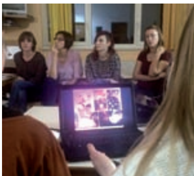
Zajedničke rasprave, promišljanja i analize rada

Timsko planiranje osiguravaju kontinuitet između svih oblika stručnog usavršavanja s ciljem podizanja kvalitete odgojno-obrazovnog procesa, unapređivanja međuljudskih odnosa i suradnje (partnerstva) s roditeljima. Refleksivni praktikum još možemo nazvati i međuodgajateljska podrška kroz koju se osigurava podizanje i uravnoteživanje kvalitete odgojno-obrazovnog procesa kroz razmjenu