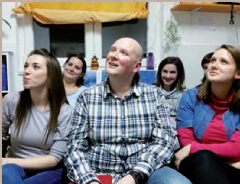
Kontinuirano stručno usavršavanje čini osnovu razvoja vrtića

i izvan nje te rad s pripravnicima. Koji model stručnog usavršavanja će se više ili manje potencirati, ovisi o specifičnostima pojedinog vrtića. Da bi se osigurao kontinuitet razvoja vrtića, bitno je naglasiti da profesionalno usavršavanje odgajatelja i drugih stručnih