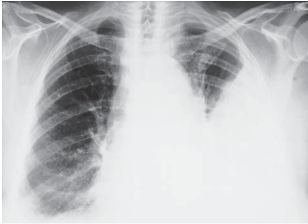
Slika 1. Rendgenska snimka prsa prikazuje prošireni mediјastinum i opsežan lijevi pleuralni izljev

marno je tretiran torakalnom drenažom. Postavljena je opsežna drenaža zahvaćenih fascijalnih prostora vrata i mediјastinuma. Obavljene su česte irigacije »otvorene« rane