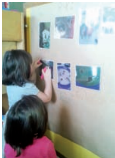
Dokumentacija nam služi za bolje razumijevanje djeteta i njegovih interesa

Svaki oblik dokumentacije ima svoje prednosti i nedostatke, a na odgajatelju je da odluči kojim će se oblikom