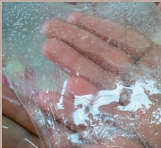
Kako bi se došlo do što objektivnijeg tumačenja dokumentacije, ona postaje predmetom zajedničkih refleksija

Dokumentacija nam služi za bolje razumijevanje djeteta, njegovih interesa, ideja i doživljaja, teorija, znanja i kompetencija. Služi nam i za djelovanje u skladu s tim razumijevanjem. Oblici dokumentacije koje koristimo u našem odgojno-obrazovnom radu su fotodokumentacija, videodokumentaci-