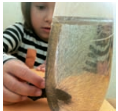
Prednost fotodokumentacije jest u tome što prikazuje ključne trenutke u nekoj situaciji

tumačenja dokumentacije, ona postaje predmetom zajedničkih refleksija, promišljanja i interpretiranja – potom i djelovanja cijelog tima, a ne samo pojedinca. Timski rad i zajedničke refleksije prilika su ne samo za unapređenje odgojno-obrazovne prakse, nego i dokumentacije same.