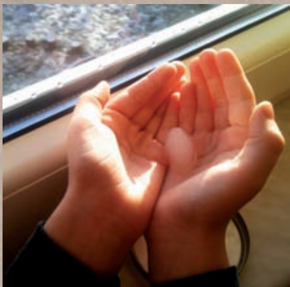
Pažljivim dokumentiranjem moguće je zabilježiti kako djeca stvaraju određene teorije

Kako bismo dijete podržali u njegovu razvoju, prvenstveno ga nastojimo razumjeti. Prvi korak na tom putu je izgradnja otvorenog i uvažavajućeg odnosa s djecom. U tom procesu dokumentiranje postaje alat za unapređenje kvalitete odgojno-obrazovne prakse. Ako prostor nazivamo trećim odgajateljem, dokumentaciju bismo zasigurno mogli nazvati trećim okom koje nam omogućuje uvid u djetetovo viđenje i poimanje stvarnosti.