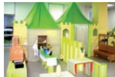
Soba dnevnog boravka djece u objektu Jaglac

cesu, a povjerenje u dijete prestaje biti nepoznat pojam već postaje dio naše svakodnevnice.