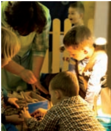
Odgajateljica u ulozi suigračice

dobi djeca imaju priliku istražiti svjetlost, boju i manipulirati različitim rastresitim i sitnim materijalima. Povjerenje u dijete odražava se i u organizacijskoj i vremenskoj strukturi. Glavna riječ kojom se trebamo voditi prilikom organiziranja svih segmenata u odgojno-obrazovnoj ustanovi jest fleksibilnost . 'Vrtić osigurava uvjete za ostvarivanje visoke razine fleksibilnosti odgojno-obrazovnog procesa koja omogućuje prilagodljivost konkretnim mogućnostima, potrebama i interesima djece i odraslih u ustanovi, kao i uvjetima i kulturi sredine u kojoj ustanova djeluje.' (MZOS, 2014.) Što je veća razina povjerenja u dijete, sustav će biti fleksibilniji i otvoreniji za nove i nepredvidive situacije. Djetetu svakodnevno pružamo mogućnost izbora aktivnosti, vremena kad će se njima baviti, koliko dugo, na koji način i s kim. Razina povjerenja u dijete jasno je vidljiva u odnosima i komunikaciji svih sudionika odgojno-obrazovnog procesa. Pomislite na jednu brižnu i podržavajuću obitelj – upravo tako treba biti koncipiran i vrtić, poput velike kuće u kojoj žive djeca i odrasli. U takvoj ustanovi temelji su postavljeni na demokratskim osnovama, što uključuje međusobno poštovanje i ostvarivanje recipročne komunikacije svih sudionika odgojno-obrazovnog procesa. (Miljak, 2009.) Svim sudionicima odgojno-obrazovnog procesa, i djeci i odraslima, dana je mogućnost izražavanja prijedloga, inicijativa i su-