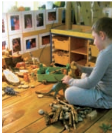
Dječak u samoorganiziranoj aktivnosti

dobi djeca imaju priliku istražiti svjetlost, boju i manipulirati različitim rastresitim i sitnim materijalima. Povjerenje u dijete odražava se i u organizacijskoj i vremenskoj strukturi. Glavna riječ kojom se trebamo voditi prilikom organiziranja svih segmenata u odgojno-obrazovnoj ustanovi jest fleksibilnost . 'Vrtić osigurava uvjete za ostvarivanje visoke razine fleksibilnosti odgojno-obrazovnog procesa koja omogućuje prilagodljivost konkretnim mogućnostima, potrebama i interesima djece i odraslih u ustanovi, kao i uvjetima i kulturi sredine u kojoj ustanova djeluje.' (MZOS, 2014.) Što je veća razina povjerenja u dijete, sustav će biti fleksibilniji i otvoreniji za nove i nepredvidive situacije. Djetetu svakodnevno pružamo mogućnost izbora aktivnosti, vremena kad će se njima baviti, koliko dugo, na koji način i s kim. Razina povjerenja u dijete jasno je vidljiva u odnosima i komunikaciji svih sudionika odgojno-obrazovnog procesa. Pomislite na jednu brižnu i podržavajuću obitelj – upravo tako treba biti koncipiran i vrtić, poput velike kuće u kojoj žive djeca i odrasli. U takvoj ustanovi temelji su postavljeni na demokratskim osnovama, što uključuje međusobno poštovanje i ostvarivanje recipročne komunikacije svih sudionika odgojno-obrazovnog procesa. (Miljak, 2009.) Svim sudionicima odgojno-obrazovnog procesa, i djeci i odraslima, dana je mogućnost izražavanja prijedloga, inicijativa i su-