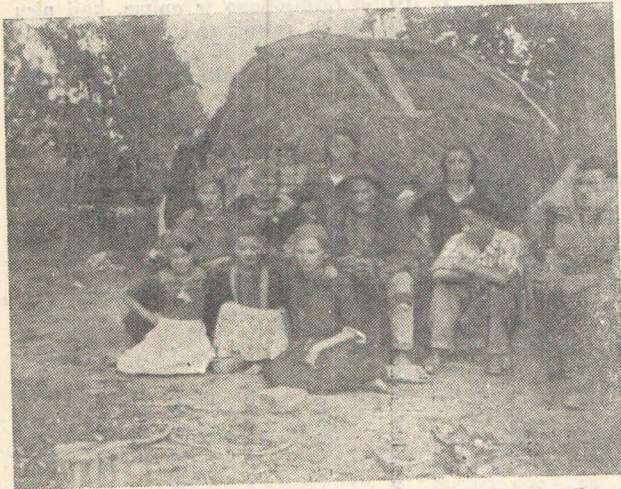
Članovi porodice sakupili su se pred bajtom na zgařištu svoje kuće. Selo Strmen, Banija.

Ustaše uspijevaju u jeku proljetnih radova da prođu u sela gračačkog kotara i da izvrše ubojstva, razaranja i pljačke u selima gračačke i mazinske općine.