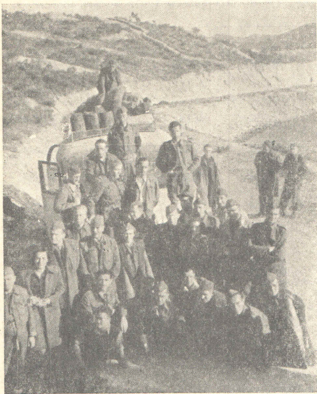
Ministarstva vlade NR Hrvatske premještaju se iz Šibenika u oslobođeni Zagreb, maja 1945.