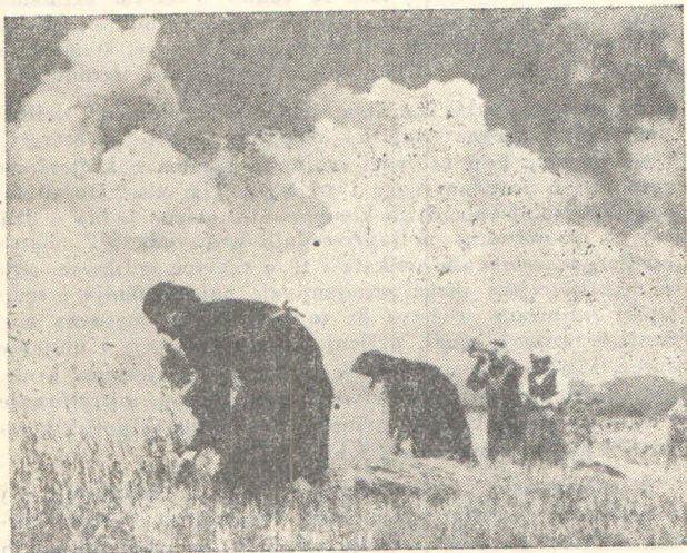
Žetva na oslobođenim područjima u Drežnici, 1942. g.

Skrivajte ljetinu, štitite je oružjem u rukama! Ni zrno žita fašističkim okupatorima!»