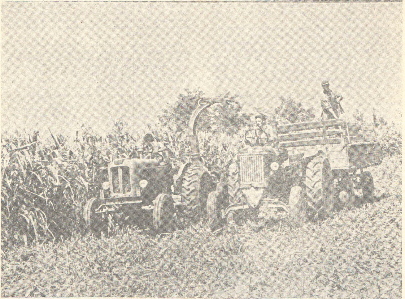
INŽ. JOCO MIČIĆ, INDUSTRIJA POLJOPRIVREDNIH MAŠINA »ZMAJ«, ZEMUN