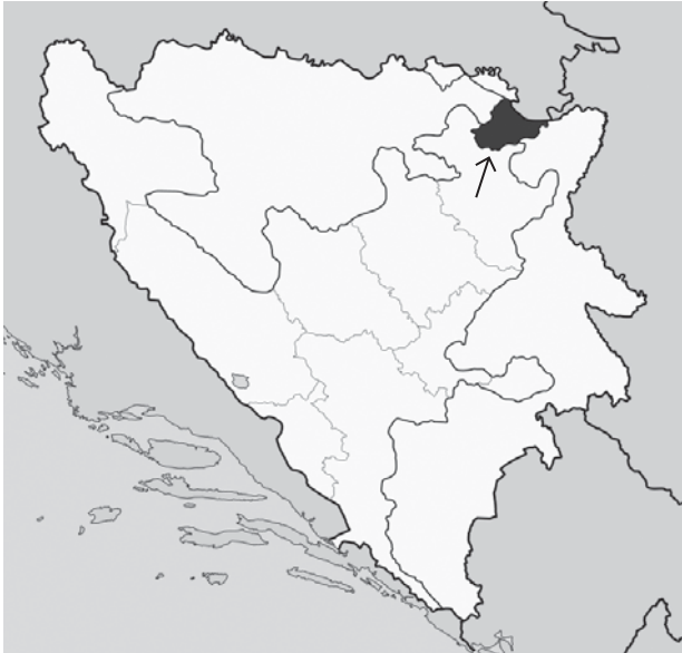
Slika 1. Područje Distrikta Brčko u Bosni i Hercegovini (strelica) Figure 1. The area of the Brčko District of Bosnia and Herzegovina (arrow)

Područje Distrikta Brčko (slika 1.) obuhvaća površinu od 493,3 km 2 gdje je u 2011. godini živjelo 75.625 stanovnika s prosječnom gustoćom naseljenosti od 153 stanovnika na četvorni kilometar, što znači veću napučenost u odnosu prema nekim područjima iz bližeg okružja. Od ukupnog su broja stanovnika 24,2% djeca i adolescenti. U 2011. godini na području Distrikta Brčko ukupno je rođeno 905-ero djece; stopa nataliteta iznosi 11,9‰, dok je stopa prirodnog priraštaja negativna i iznosi 0,6‰. 18