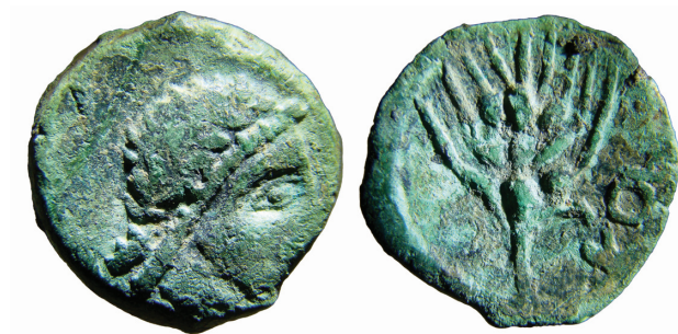
Sl. 1. Novac jadranske Korkire s Budima