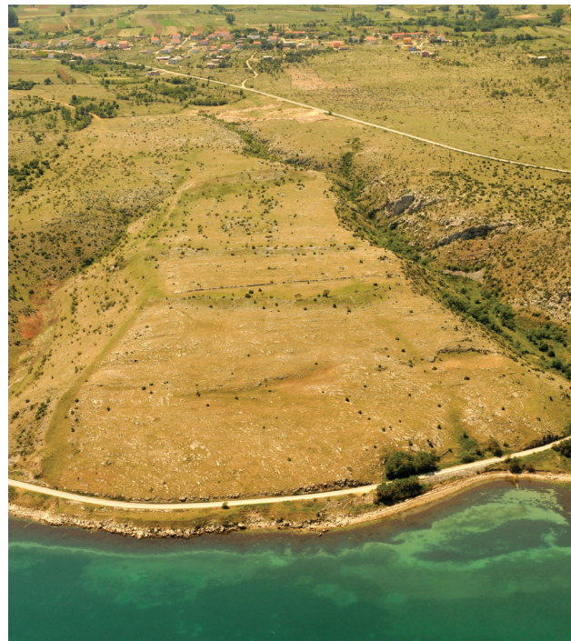
Sl. 2. Gradina Budim

Za sada nije moguće pouzdano locirati položaj politički autonomnog naselja na Korčuli iz helenističkog razdoblja kojemu bi pripadalo ime s novca, što je vjerojatno i odraz stanja arheološke istraženosti na tom južnodalmatinskom otoku, koje, očito, nije zadovoljavajuće. Međutim, neki od istraživača koji su se bavili ovom problematikom pretpostavljaju da on pripada grčkoj koloniji koju su Isejci osnovali u 3. stoljeću prije Krista, i to vjerojatno na području današnje Lumbarde. Kako bi ju razlikovali od jonske Korkire, tj. Krfa, nazivaju ju Crnom Korkirom (grčki Κόρκυρα ή Μέλαινα , latinski Corcyra Nigra ), odnosno po antičkom imenu Korčule, otoku bujne vegetacije na Jadranu, uz koji se vezuje smještaj knidske kolonije, utemeljene negdje na njemu tri stoljeća ranije. 12 Aversni