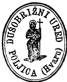
6. Pečat Dušobrižnog ureda Poljica 1919.g.