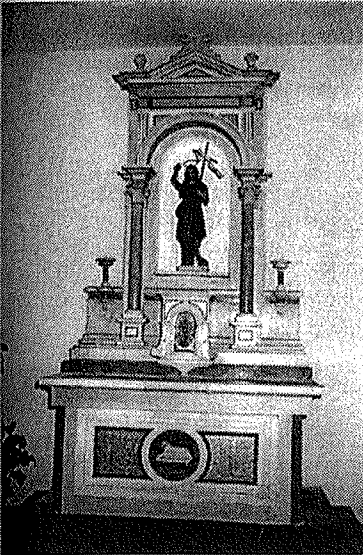
2. Poljica: glavni oltar u župnoj crkvi

posjednik Petar Dančević pok. Ante iz Jelse, uz pomoć malobrojnih stanovnika, te je bila i popravljena. 28