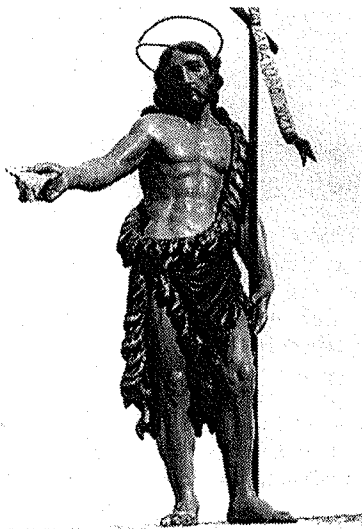
4. Stariji kip sv. Ivana Krstitelja u župnoj crkvi

Nacrt proširenja crkve, od Jurja Novaka - "Trumbite", ovlaštenog zidarskog "majštora" iz Jelse (rodod iz Hvara), odobren je od jelšanske općine 5. VIII. 1940. Nutarnje su mjere lađe 13 x 6,5 metara, a apsida je iznutra duga 6,5 metara; vanjska je dužina cijele crkve 20,5 metara. Bile su predviđene dvije sakristije - ona s juga ostala je neizvedena. Na čelu odbora za gradnju bio je dušobrižnik don Zore Paršić, 30 koji je ujedno bio i najzaslužniji za proširenje crkve, blagoslovljene 8. prosinca 1940. godine. 31