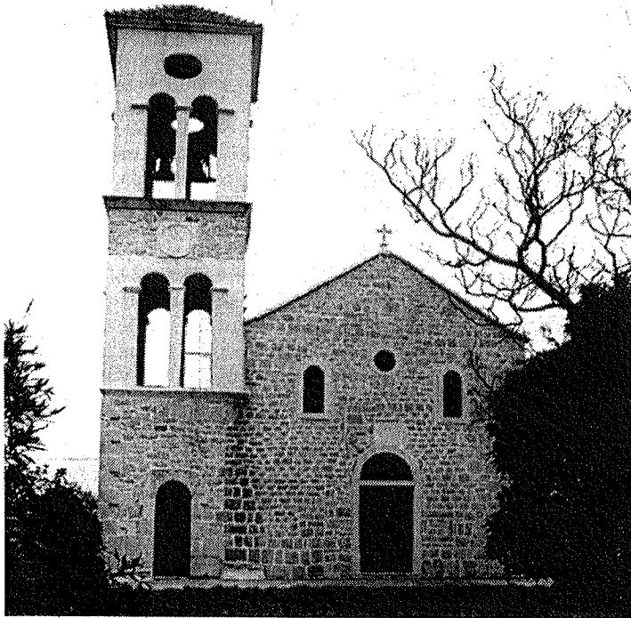
1. Poljica: pročelje župne crkve

sječu drva i sijanje žitarica; stalnih naselja i stanovnika nije bilo. 3 - No netom naznačeno stanje nije dugo potrajalo, niti je to moglo. Već 70-ak godina kasnije, u reviziji općinskog zemljišnika iz 1407. godine, gdje se Poljica po prvi nam znani put spominju kao toponim, nailazimo na promjene. I tada je većina zemljišta bila općinska, ali se već javljaju i posebnici, od kojih poimence Juraj (zapisano u hrvatskom obliku: Juraj!) Petrović i ser Vidoš Desković. Općinsku od posebničke zemlje dijele međašni kameni s uklesanim križem ( lapides signati cum cruce ), a važna je napomena da je zemlja u ravnici, tj. ona najbolja, već tada u privatnim rukama: " Et totum planum est personarum specialium. " - Dvadesetak godina kasnije, u novoj reviziji općinskog zemljišnika iz travnja 1425. godine, nalazimo nove zaposjedatelje općinske zemlje uokolo Poljica, ovoga puta nezakonite. Bijahu to Luka Bratošević, Marin Kovačić, Ivan (sic! u hrvatskom obliku) Šantić, Radić Avancanić, Nikola Megarović i Cvitan Prvošić te vlastela Katarin Mikšić, Antonij Jakovljević i Antonij Zečić.