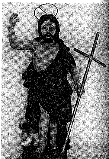
5. Kip sv. Ivana Krstitelja u crkvi na groblju