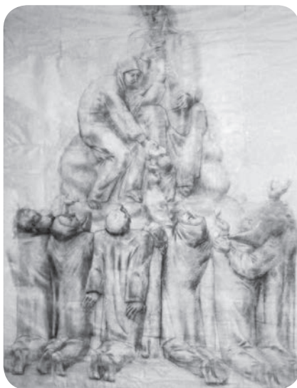
Slika 13. Ivan Meštrović, skica za reljef Santa Maria Mediatrice