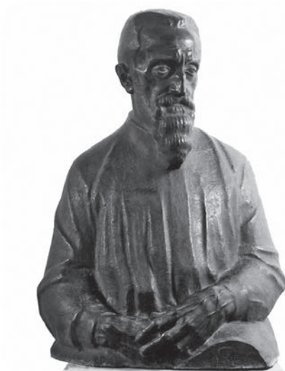
Slika 6. Ivan Meštrović, Portret Leonarda Bistolfija , 1913.