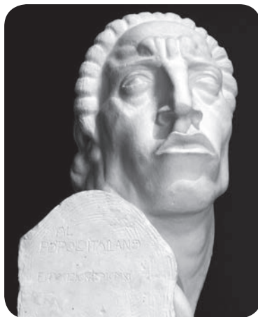
Slika 3. Ivan Meštrović, Srđa Zlopogleđa , 1911.

Skulptura Srđa Zlopogleđa (slika 3) 11 nalazi se u stalnom postavu Galerije i nosi inventarni broj 273. Činila je dio Kosovskog ciklusa s rimske izložbe 1911. godine, kada je i nastala. Modelirana je u gipsu, a dimenzije su joj 110 x 59 x 45 cm. Skulpturu je Galeriji darovao Ivan Meštrović nakon rimske izložbe na kojoj je osvojio prvu nagradu za skulpturu. Kosovski ciklus sadržavao je 62 skulpture, koje su služile kao ukras Vidovdanskom hramu , spomenu na bitku iz 1398. godine. Inspiraciju za ciklus radova Meštrović je crpio iz narodnih pjesama i legendi koje sintetiziraju povijest zemlje preko figura poginulih junaka. Godine 1919. skulptura je bila pohranjena u depou Umjetničke akademije u Ravenni, odakle je godine 1998. vraćena u Galeriju moderne umjetnosti u Rimu, kako bi se pridružila ostalim skulpturama s Međunarodne izložbe 1911. godine. Osim ovog gipsanog modela postoji i jedan brončani i jedan mramorni primjerak skulpture.