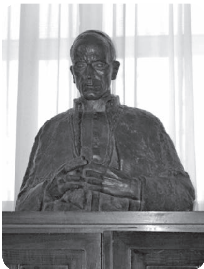
Slika 12. Ivan Meštrović, Papa Pio XII.