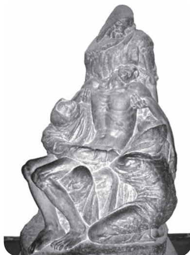
Slika 7. Ivan Meštrović, Rimska Pietà , 1942.-1946.