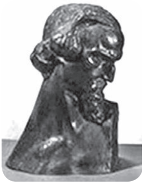
Slika 2. Ivan Meštrović, Autoportret , 1912.

U Galeriji moderne umjetnosti 8 u Firenci čuva se Autoportret Ivana Meštrovića (slika 2). 9 Radi se o brončanoj skulpturi smještenoj u depou Galerije, s inventarnim brojem 533. Djelo je nastalo u Rimu 1912. godine. Dimenzije su mu 65 x 30 x 29 cm. Talijansko Ministarstvo obrazovanja zatražilo je skulpturu od Meštrovića najvjerojatnije nakon uspjeha srpskog paviljona na Međunarodnoj izložbi u Rimu 1911. godine. Djelo je izloženo na Biennaleu u Veneciji 1914. godine, nakon čega je poslano u Firencu. Jednu brončanu inačicu tog djela (gipsani model najvjerojatnije je ostao kod umjetnika) prodao je 1964. godine Galeriji Sveučilišta Syracuse Meštrovićev brat Petar. Potpisana je na istome mjestu kao i firentinski Autoportret , ali nije datirana. Dakle, djelo se najprije nalazilo u privatnom vlasništvu, a od godine 1915. postalo je dijelom zbirke Galerije Uffizi u Firenci. Od 14. kolovoza 1943. nalazi se u Villa del Monte , u Firenci, Galliano - Mugello, nakon čega