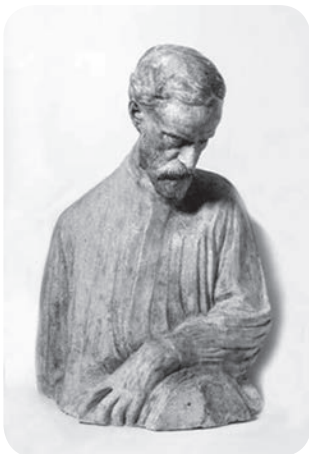
Slika 5. Ivan Meštrović, Felice Carena, 1914.

Skulptura Starica (slika 4) 12 također se nalazi u stalnom postavu Galerije i ima inventarni broj 1370. To je mramorna skulptura nastala između 1906. i 1910. godine. Tema starenja kod Meštrovića se javlja godine 1906., a djelo je zabilježeno na fotografiji iz umjetnikova atelijera u jednoj publikaciji iz 1910. godine, po čemu se zaključuje vrijeme nastanka. Prikaz tijela žene i njenog položaj upućuju na Klimtovu sliku Tri doba žene i Meštrovićevo secesijsko razdoblje, ali se primjećuje i utjecaj Rodina i Bourdella, koje je Meštrović proučavao u Parizu 1908. godine. Djelo je nabavljeno otkupom nakon Međunarodne izložbe u Rimu 1911. godine.