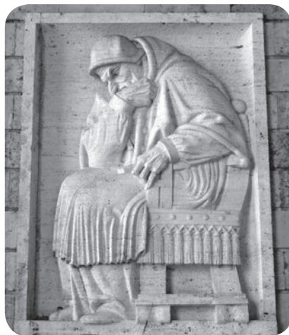
Slika 10. Ivan Meštrović, Papa Siksto V. , 1942.

U Hrvatskom zavodu sv. Jeronima u Rimu, 25 odnosno u istoimenoj zbornoj crkvi nalaze se tri Meštrovićeva reljefa, jedna skulptura i jedan crtež. Hrvatski prostori postali su posebno povezani s Rimom kad se središte kršćanstva pomaknulo prema Zapadu, a te stoljetne veze prisutne su i danas.