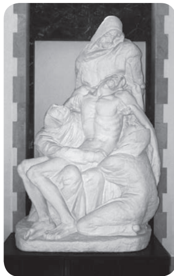
Slika 11. Ivan Meštrović, Pietà , 1960.

Velika umjetnička ostavština Ivana Meštrovića snažan je poticatelj povijesnoumjetničkih istraživanja. Pregledom bibliografske građe i hemeroteke može se zaključiti da je Meštrovićeva poetika u kojoj slavi čovjeka i njegove vrijednosti produhovljenim i opipljivim umjetničkim izrazom bila veoma cijenjena u prvoj polovici 20. stoljeća u Italiji, o čemu svjedoči i uključivanje njegovih djela u stalne postave talijanskih muzeja.