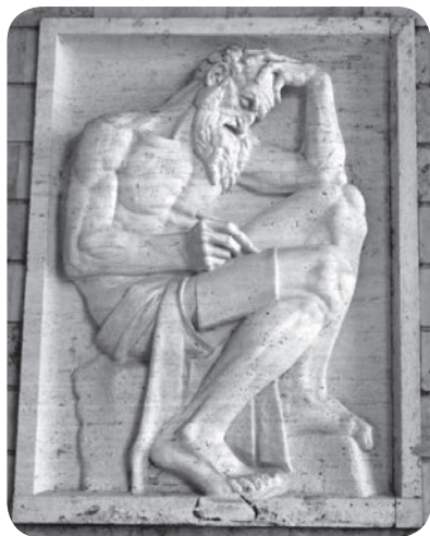
Slika 9. Ivan Meštrović, Sveti Jeronim , 1942.