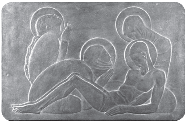
Slika 1. Ivan Meštrović, Pietà

kod Meštrovića se javlja od 1913. godine. Taj je prizor Meštrović prikazao nekoliko puta, potaknut potresnim događajima i ljudskim stradanjima tijekom Prvog svjetskog rata.