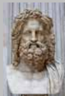
Slika 3: Vrhovni grčki bog. 2

1. Na slici je prikazan jedan od osnivača olimpijskih igara. Napiši njegovo ime.