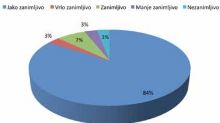
Slika 2: Zadovoljstvo sudionika međupredmetnim povezivanjem