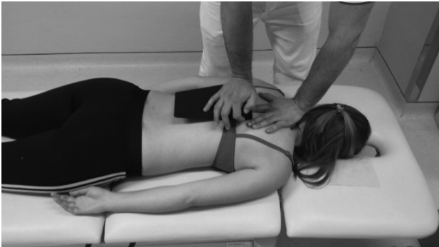
Slika 1. Trakcijska mobilizacija fasetnih zglobova torakalne kralježnice

glavu kako bi vratna kralježnica bila u neutralnom položaju i paravertebralna miškulatura opuštena. Fizioterapeut jednom rukom palpira interspinozni prostor između dvaju torakalnih kralježaka, a drugom rukom preko mobilizacijskog klina vrši pritisak na transversalne nastavke kaudalnog kralješka u segmentu koji se mobilizira. Primjenjuje se mobilizacija 3. stupnja prema Kaltenbornu okomito na terapijsku ravninu fasetnih zglobova(22). Pritisak je zadržan 10 sekundi, te je zatim mobiliziran sljedeći segment. Segmenti su mobilizirani od kaudalno prema kranijalno počevši od Th12 pa sve do Th1. Trajanje mobilizacije je oko dvije minute (slika 1.).