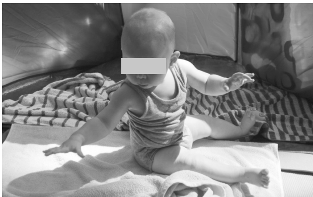
Slika 2. Uspravan sjed uz rotaciju trupa (uz suglasnost roditelja)