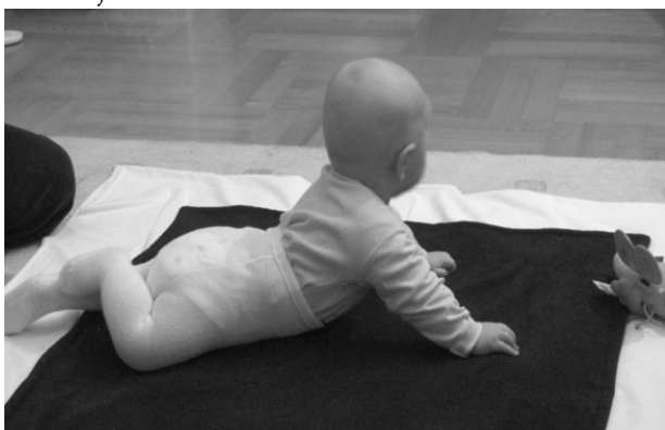
Slika 1. Reakcije uspravljanja (uz suglasnost roditelja)