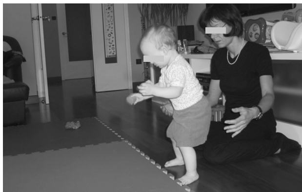
Slika 3. Ravnoteža prilikom stajanja (uz suglasnost roditelja)