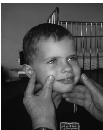
Slika 5. Prikaz vježbi mimičke terapije – podizanje kuta usne (uz suglasnost roditelja).