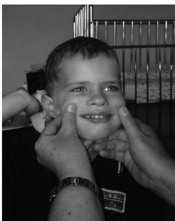
Slika 6. Prikaz vježbi mimičke terapije – osmjeh (uz suglasnost roditelja).