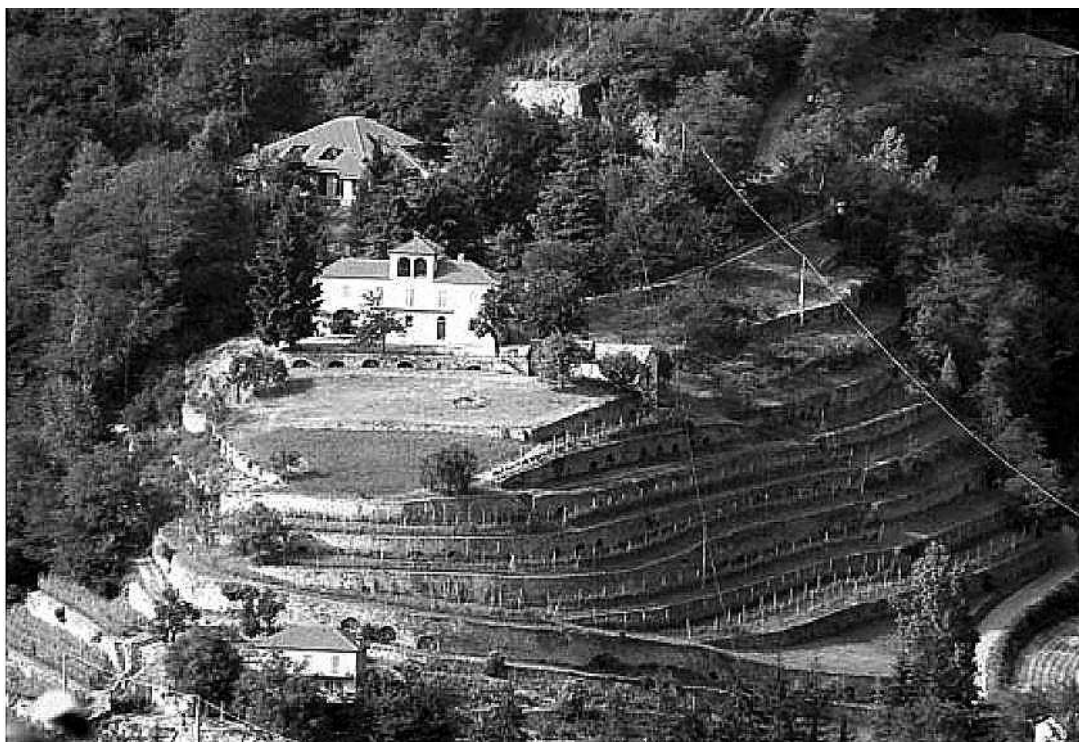
sl. 1. Ekomuzej terasa i loze (Cortemilia, Italija)

Ekomuzej zaljeva Ha Long u Vijetnamu dio je arhipelaga koji obuhvaća tisuće vapnenačkih vrhova, područje iznimne prirodne ljepote na kojemu uspijeva izuzetno velik broj različitih životinjskih i biljnih vrsta. Područje je 1994. uvršteno na UNESCO-ov Popis svjetske baštine. Iako suočen s brojnim problemima poput turizma, pretjeranog izlova ribe, urbanizacije i vađenja minerala, taj je ekomuzej shvaćen kao posrednik u njihovu rješavanju (Schwartz, 2001.). Jedna od temeljnih namjena glavne zgrade ekomuzeja (Ekomuzejski centar), koja istodobno nudi i prostor i priliku lokalnoj ribarskoj zajednici da preuzme aktivnu ulogu u razvoju vlastitih prirodnih i kulturnih dobara, jest sudjelovanje zajednice. S obzirom na upravljanje kulturnom baštinom, upravljanje okolišem i operativno upravljanje samim Centrom, izgradnja kapaciteta jača sudionički aspekt projekta. Cilj očuvanja baštine za buduće generacije promiče se ponovnim uspostavljanjem tradicionalnih pristupa upravljanju ribljim zalihama i podizanjem svijesti zajednice o vlastitoj uporabi kulturnih i prirodnih resursa za revitalizaciju regije.