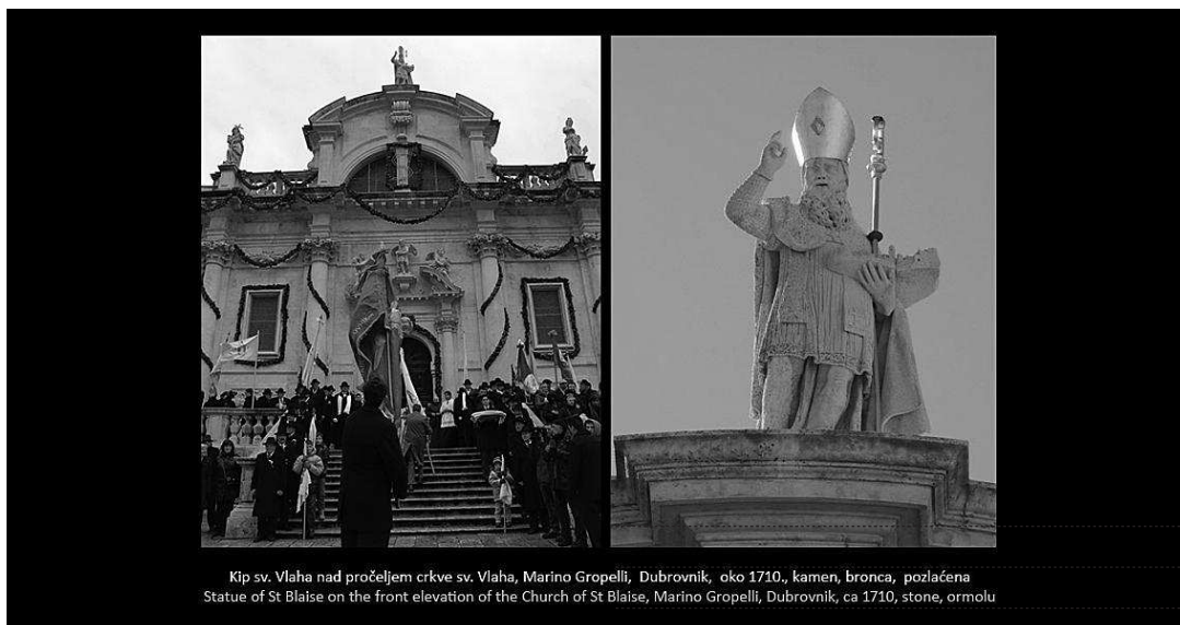
Kip sv. Vlaha nad pročeljem crkve sv. Vlaha, Marino Gropelli, Dubrovnik, oko 1710., kamen, bronca, pozlaćena Statue of St Blaise on the front elevation of the Church of St Blaise, Marino Gropelli, Dubrovnik, ca 1710, stone, ormolu

sl. 9. Zaslón touchscreena s prikazom moćnika glave sv. Vlaha iz riznice katedrale