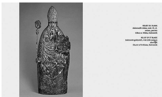
RELIEF SV. VLAHA dubrovački (slika, emajl, 18. st.) srebro, pečena Crkva sv. Vlaha, Dubrovnik RELIEF OF ST BLAISE Dubrovnik gotički, 18th-19th century silver gilt Church of St Blaise, Dubrovnik