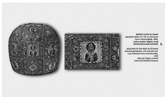
MOĆNIK GLAVE SV. VLAHA reprodukt (slika), 18. i 19. st., Francuska Festo, ukrašavanje, 1894. srebro, srebrna, filigran, emajl Moćnik katedrale Dubrovnik RELICUARY OF THE HEAD OF ST BLAISE ukraseni gotički, 18th and 19th cen- tury (reproduction from reconstruction), 1894 silver gilt, filigree enamel Dubrovnik Cathedral Treasury