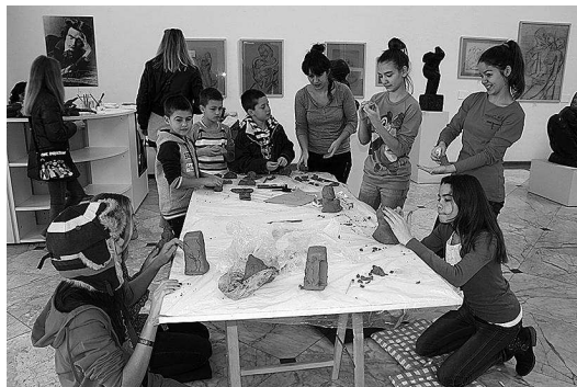
sl.9. Radionica priređena uz izložbu Zahvalimo njoj , Narodni muzej Zadar.

prijašnjih radionica, koje su bile unaprijed dogovorene. Koncept radionice podrazumijevao je da se djeca upoznaju s Meštrovićem kao osobom i njegovim radom te da tu inspiraciju iskoriste u modeliranju, crtanju i grafičkim tehnikama, kao i u slaganju memory igara. Radionica je naplaćivana, a pohađalo ju je ukupno 28 djece. 17