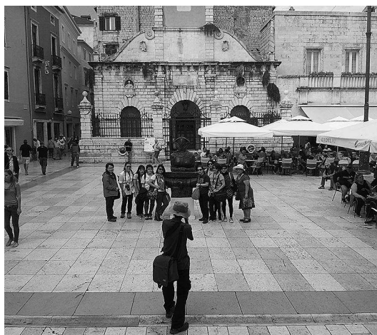
sl.10.-11. Skulptura Povijest Hrvata u javnom prostoru trga 'poziv' a slučajne prolaznike da posjete izložbu.