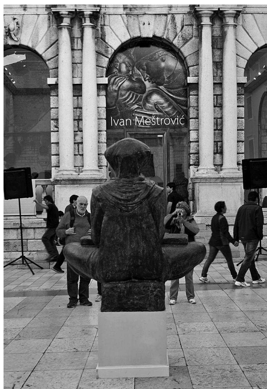
sl.4. Pogled na izložbu Zahvalimo njoj u Grdskoj loži, Narodni muzej Zadar, 2013.