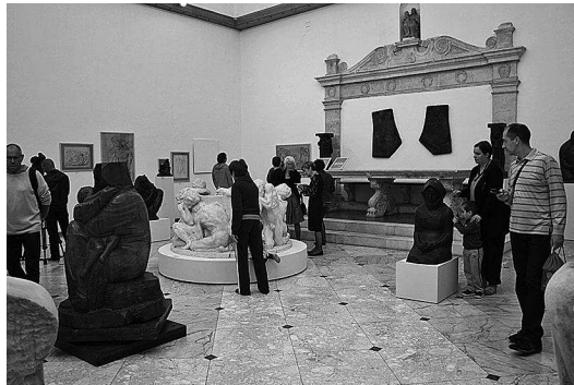
sl.7.-8. Pogled na izložbu Zahvalimo njoj , Narodni muzej Zadar

Za vrijeme trajanja zimskih praznika, od 6. do 12. siječnja 2014., organiziran je ciklus radionica pod nazivom Praznici u Loži , namijenjen djeci osnovnih škola. Nekoliko dana prije radionice djeci je putem medija i putem web i Facebook stranica Muzeja upućen poziv da se uključe u radionice, a u Dokumentacijskoj službi kreiran je i plakat za te radionice. Radionice su bile prilika da se vidi koliko je individualni odaziv djece, za razliku od