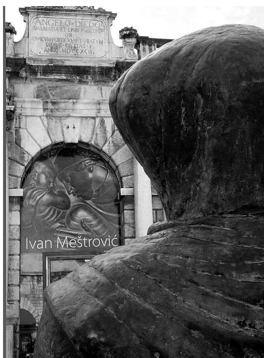
sl.2. Detalj Meštrovićeve skulpture Povijest Hrvata izložene u javnom prostoru na gradskom trgu ispred Gradske lože.

Sljedeća oblikovna faza prezentirana je djelima koja otkrivaju Meštrovićevo duhovno i religijsko sazrijevanje