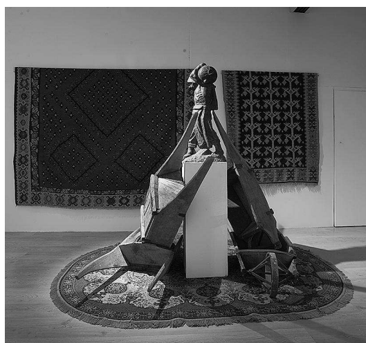
sl.1.-12. Izložba Refleksije vremena 1945.-1955. , Galerija Klovičevi dvori, Zagreb, 2012./2013.