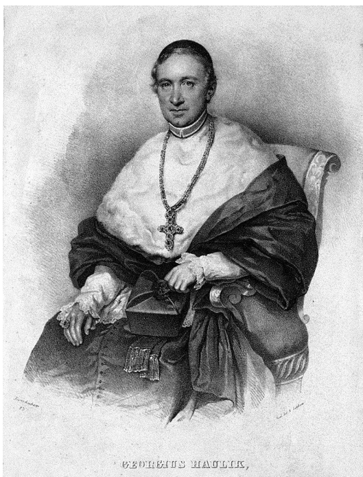
sl.8. Josef Kriehuber: Zagrebački biskup Juraj Haulik (1837.)