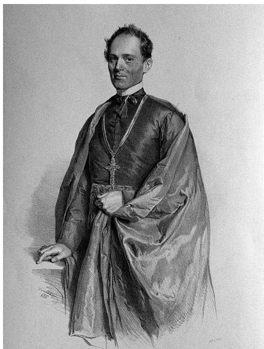
sl. 9. Josef Kriehuber: Đakovački biskup Josip Juraj Strossmayer (1850.)