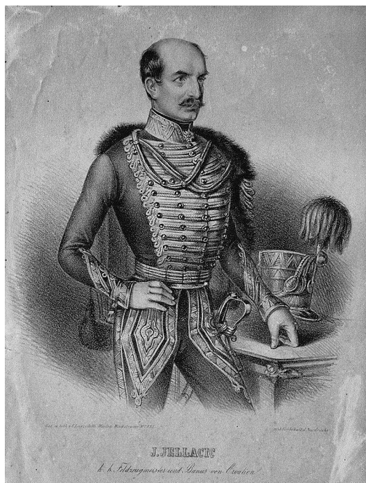
sl.4. Josef Kriehuber: Ban Hrvatske i Slavonije grof Josip Jelačić (1848.)