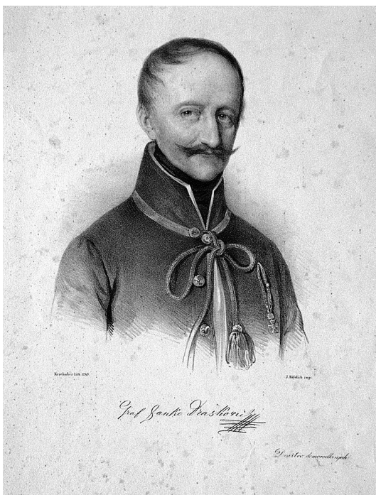
sl.10. Josef Kriehuber: Janko Drašković grof Trakošćanski (1843.)