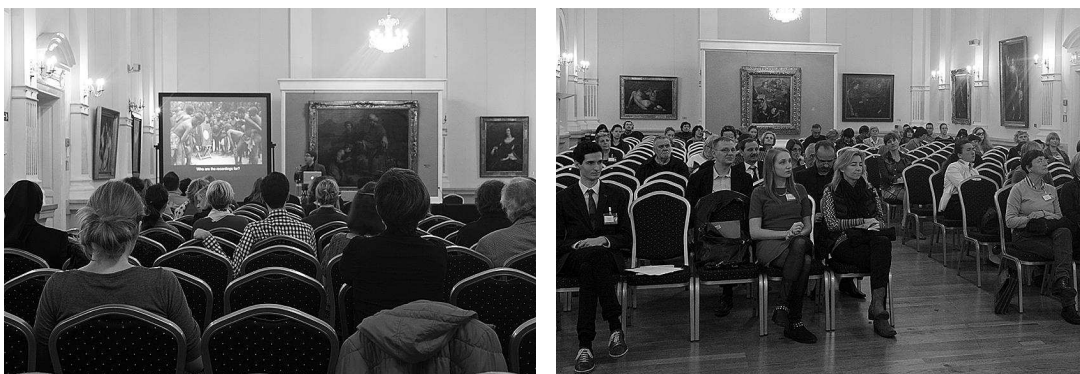
sl.2.-3. Pogled na dvoranu u Muzeju Mimara u kojoj se održavao međunarodni simpozij Glazba u muzeju / Muzeji glazbe.