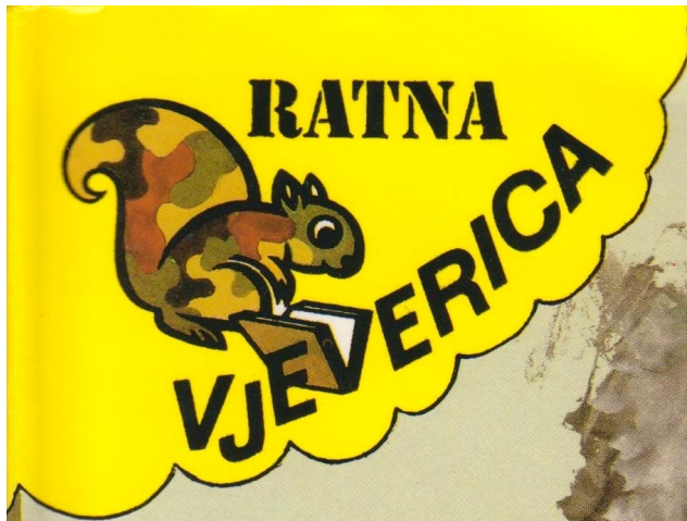
Sl. 3. Logotip Ratne vjeverice. Fig. 3. The logo of the War Vjeverica.

U prvim godinama Domovinskoga rata, 1991. i 1992., izišla su četiri naslova osobite Ratne vjeverice koja u gornjemu lijevome uglu ima trokutasti dio s natpisom i crtežom vjeverice u bojama maskirne uniforme, što je također dizajnirao Krešimir Haluga (Sl. 3.). Te knjige izgledom uopće ne podsjećaju na Vjevericu, tanke su, drugačijega formata, mekih korica, tiskane na žućkasto-smeđemu papiru i na kraju ne donose popis prethodnih izdanja u istoj biblioteci.