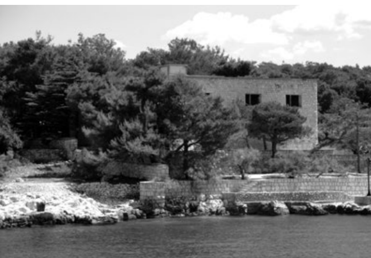
Prikaz 8. »Kamena« zgrada 2014. Komparirati pošumljenost prikaza 7. i 8.

Ja kažem ljudima, kad idem Golim Otokom s' njima, vodim, koji zastanu u sjeni stabala. Pa im to pričam. Pa kažem: »Vidite, kad bi ti ljudi, koji su uzgojili tu mladu biljku da bi postala drvo, stablo, kad bi vidjeli kako vi stojite u sjeni tih stabala, pa (...) oni bi bili sretni. Da to vide, ne? Dakle, sve što je nastalo, to je rukom čovjeka nastalo, na Golom Otoku. 32