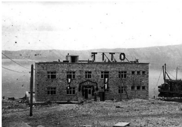
Prikaz 7. »Kamena« zgrada 1949./1950. godine.