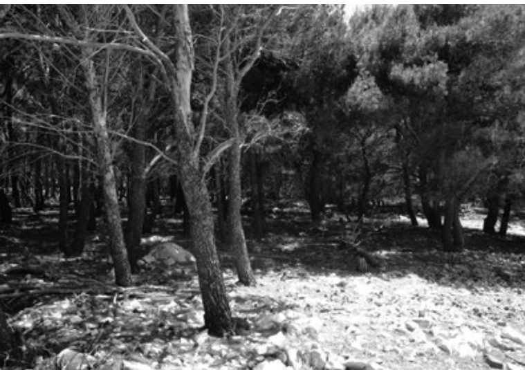
Prikaz 6. Šuma ispred zgrade »Hotela« danas.