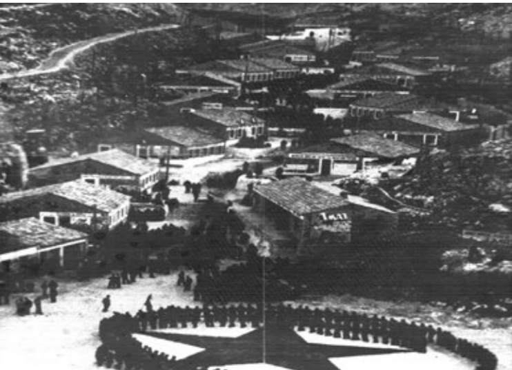
Prikaz 2. »Žica« 1951. ili 1952. godine. Zamijetiti razinu pošumljavanja te komparirati sa sljedećom fotografijom.