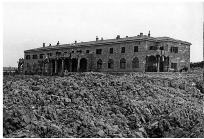
Prikaz 5. Fotografija zgrade »Hotela« 1950./1951. godine. (Autor nepoznat). Okolo zgrade pustoš, ali i tek zasađene mladice borova. Usporediti sa sljedećim prikazom i približno istim mjestom više od 60 godina kasnije.

Logor na Golom otoku uistinu je bio mjesto surove represije nad ibeovcima, kako su nazivane pristalice Staljina, ali razdoblje od 1949. do 1956., koliko je funkcionirao logor ima je i neke popratne efekte; promjenu fizičkog izgleda samog otoka. Uprava, pa onda i logoraši hotimično ili ne, transformirali su pusti otok bez šuma, u djelomično pošumljen, izgrađen gotovo mali industrijski kompleks. Razne kazne primjenjivane nad logorašima, koje su imale svrhu pritiska na ibeovce (»revidiranje stava«) imale su drastične učinke po izgled Golog otoka kao i njegov ekosistem. Na primjer, kao što je već apostrofirano, oblik kazne prisile bilo je čuvanje sadnice drva svojim tijelo (što je bila samo jedna metoda pošumljavanja), da bi kroz šezdeset godina 1/8 površine Golog otoka bilo pošumljeno. Koliko to nije, u općim predodžbama, povezano uz rad logoraša, prisjeća se logoraš Vlado Bobinac: