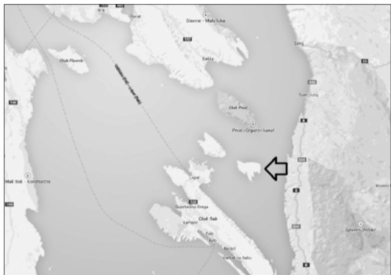
Prikaz 1. Goli otok na karti sjevernog Jadrana

Dakle, još prije trajnog i većeg ljudskog prisustva i aforestacije, tvrdolisna makija i drugo mediteransko rastinje na Golom otoku nudilo je izuzetan varijetet, usprkos kvantitativnoj oskudnosti. Međutim, pogled eksperata kao što su biolozi i ekobotaničari i kontekst njihovog razmatranja otoka drastično se razlikovao od vidokruga promatranja dezorijentiranih kažnjenika, ali i onih koji su Goli otok odredili kao kažnjenički logor. Njima je kamenita pustoš, koja je fizionomski zaista skoro potpuna, predstavljala važnu potvrdu onoga što je kažnjenike trebalo čekati - trajno teško stanje.