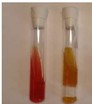
Slika 4. Test fermentacije Fig. 4. The test of fermentation

smatrajte reakciju pozitivnom (Slika 4). Kolonije koje su oksidaza negativne i glukoza pozitivne potvrđene su kao Enterobacteriaceae . Rezultati se izražavaju kao broj kolonija (CFU) u volumenu uzorka hrane.