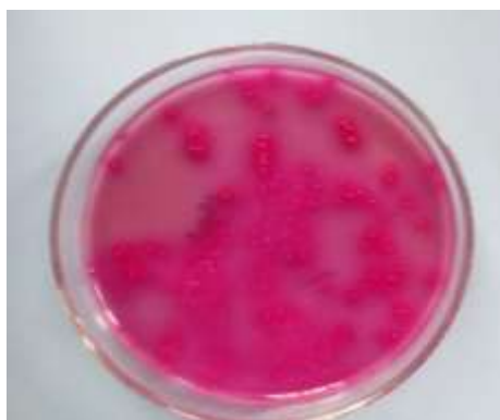
Slika 2. Enterobacteriaceae na hranjivoj selektivnoj podlozi VRBG

U dvije sterilne Petrijeve posude prebaciti sterilnom pipetom po 1 ml ispitnog uzorka, ako je uzorak tekućina, ili 1 ml početne suspenzije u slučaju uzoraka druge konzistencije. Uzeti dvije druge sterilne Petrijeve ploče i koristeći nove sterilne pipete prebaciti u svaku ploču po 1 ml prvog decimalnog razrjeđenja ( 10^{-1} ) ispitivanog uzorka, ako je uzorak tekućina, ili 1 ml prvog decimalnog razrjeđenja početne suspenzije ( 10^{-2} ) u slučaju uzoraka druge konzistencije. Ponoviti opisani postupak s narednim razrjeđenjem, koristeći novu sterilnu pipetu za svako razrjeđenje. U svaku petrijevu posudu izliti 10 ml medija podloge violet red glukoza žučne podloge ohlađen na 44 do 47 °C u vodenom kupatilu. Vrijeme koje prođe između inokulacije Petrijevih posuda i trenutka kada se podloga izlije ne smije biti duže od 15 minuta. Nakon potpunog stvrdnjavanja smjese dodati pokrovni sloj od 15 ml ljubičasto crvene glukozne podloge, ohlađene na 44 do 47 °C u vodenom kupatilu, kako bi se spriječio rast i postigli polu-anaerobni uvjeti. Ostaviti da se podloga stvrdne. Preokrenuti ploče i inkubirati u inkubatoru na 37 °C 24h ±2h (Slika 2) (Karaklašević, 1987; Duraković, 1996; Govedarica i sur., 1995; Ha, 1996).