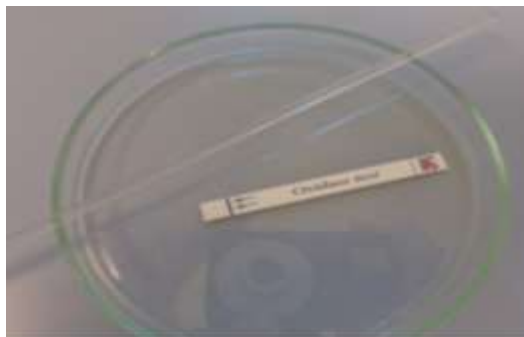
Slika 3. Oxidase test Fig. 3. The test of oxidase

Reakcija oksidaze: Pomoću eze ili staklenim štapićem uzeti dio svake dobro izolirane kolonije i razmazati na filter papir navlažen reagensom oksidaze ili na komercijalno dostupni disk. Smatrajte da je test negativan ako boja filter papira ne potamni u roku od 10 sekundi. Pridržavajte se uputa proizvođača za gotove diskove (Slika 3).