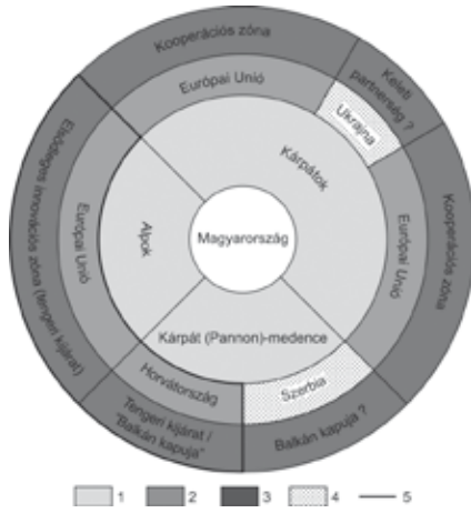
Ilustracija 1. Geopolitička i geoprivredna okolina Mađarske

1. zemljopisna prirodna okolina, 2. integracijska zona, 3. geoprivredna i geopolitička okolina, 4. pojas s ograničenim kooperacijskim sposobnostima, 5. stratejsko partnerstvo