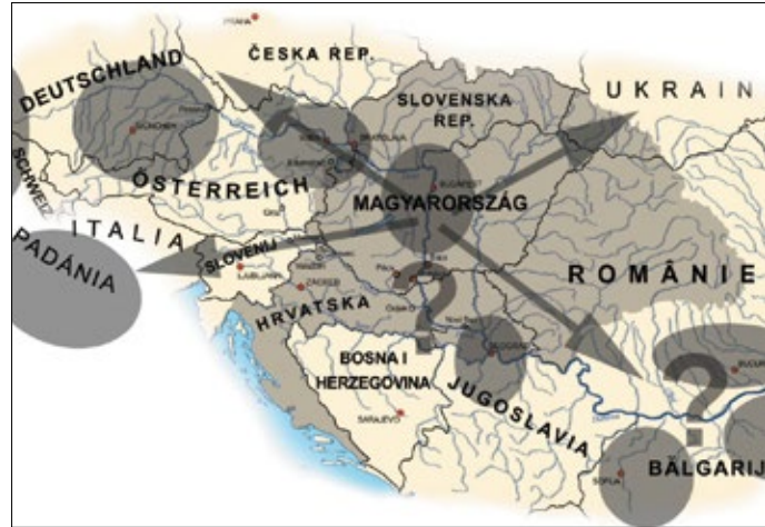
Ilustracija 2. Regionalna središnja područja i začeci regija uz Dunav na početku 21. stoljeća